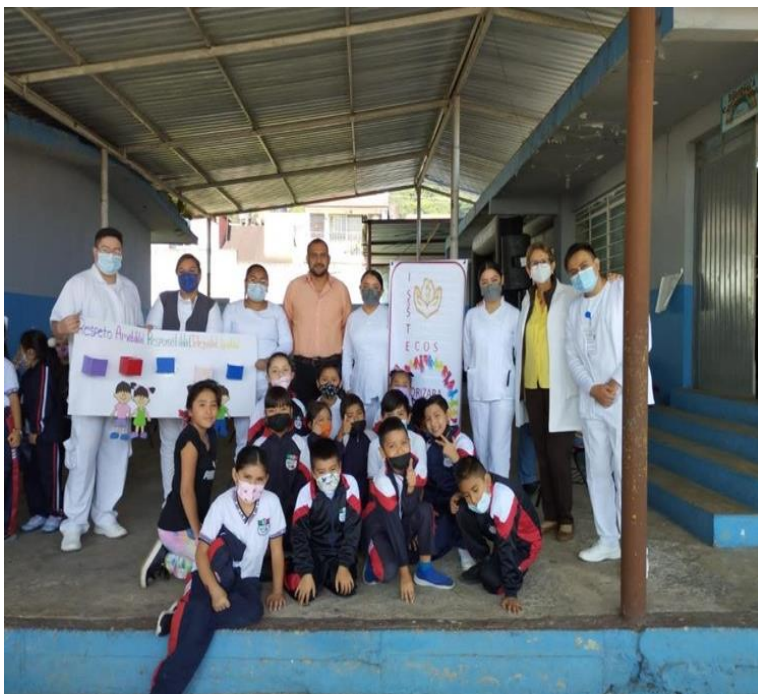
Exposición sobre “La prevención de Alcoholismo” a niños de 6º de primaria, en el municipio de Ixtaczoquitlan.