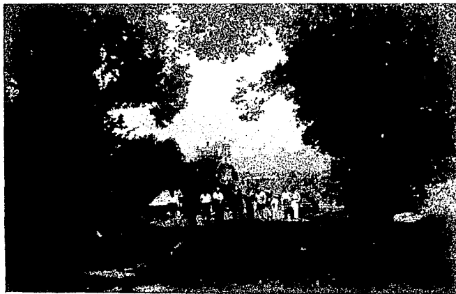
Fig. No. 3. Fotografía de la carretera anterior.

Además hay servicios de correos, de telégrafos y de teléfonos.