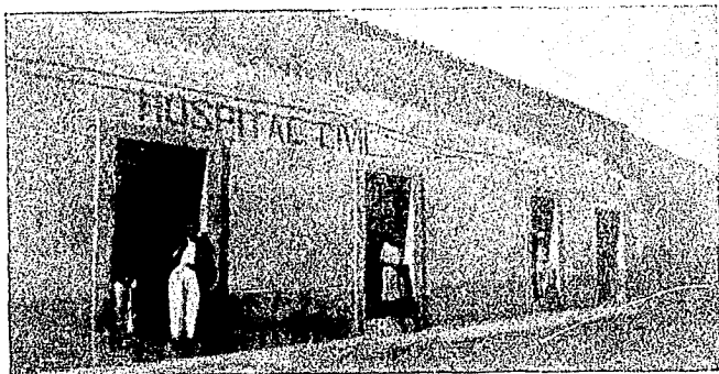
Fotografía del Hospital "Dr. José Bustos" de Jalacingo, Ver.

CONDICIONES DEL EDIFICIO: Consta de dos departamentos contruídos de piedra, con piso de cemento y de techo de teja. El primer departamento es de seis metros por lado, con dos puertas, una que comunica a la otra pieza y la otra da a la calle y es destinado a salita de curaciones y operaciones. El segundo departamento es de diez metros de largo por seis de ancho, con tres puertas a la calle y es destinado a encamar a los enfermos. Los dos están dotados de alumbrado eléctrico. En general, el edificio reúne condiciones aceptables para lo que está destinado. Véase la fotografía respectiva.