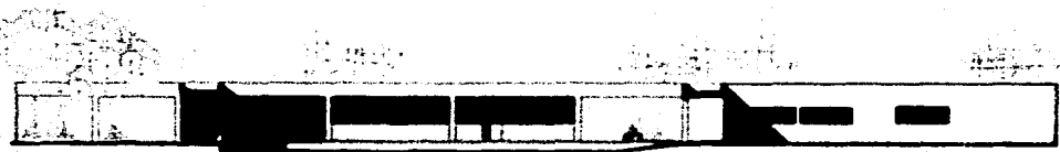
CORTE FACHADA B-B' ESCALA 1:100