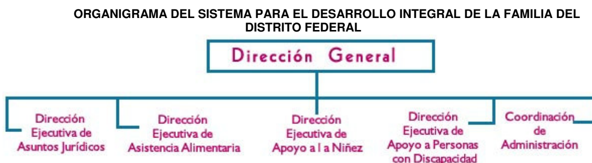
Figura No. 4, extraída de la página de Internet del DIF-DF. 44

El Organismo observará una vinculación sistemática entre sus servicios de rehabilitación, asistencia social y los que proporcionen las dependencias y entidades del sector salud, federal y local. Estará a lo dispuesto por el Sistema Nacional DIF. A continuación se presenta un organigrama de la organización estructural del DIF para el Distrito Federal: