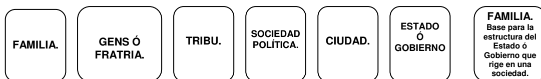
Figura No. 1. Evolución de la familia para dar origen a la sociedad. 7