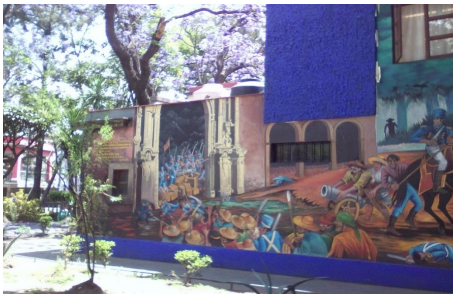
Imagen 3. Mural “La última batalla de la independencia”