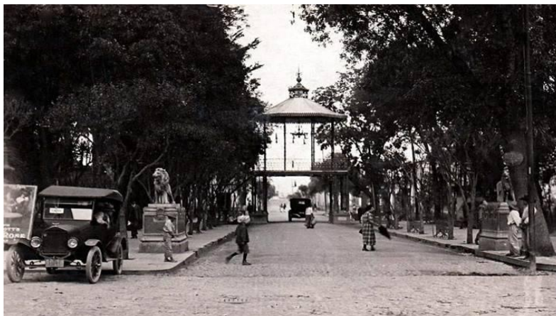
Imagen 12. Jardín Hidalgo en una fotografía a principios del siglo XX