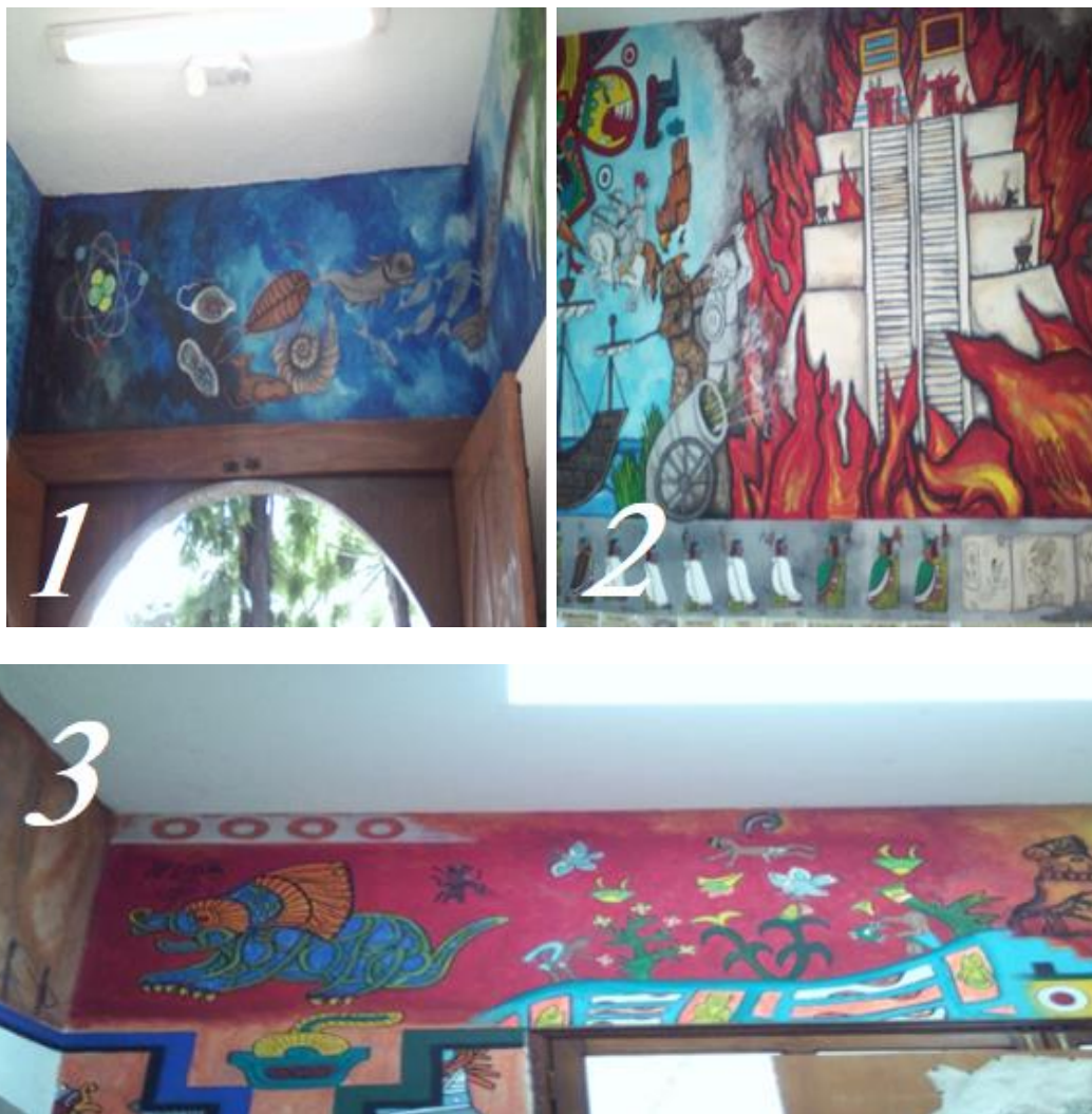
Imagen 2. Las distintas partes del mural