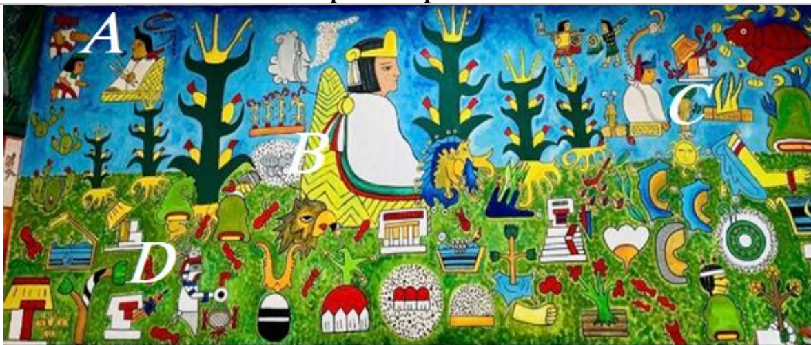
Imagen 1. Fragmento del mural “Origen y trascendencia de Azcapotzalco”, acerca del pueblo Tepaneca

la UNAM, además de elementos que recuerdan el arte prehispánico. El mural adorna todas las paredes interiores del recinto y está dividido en partes que representan distintos períodos y procesos históricos.