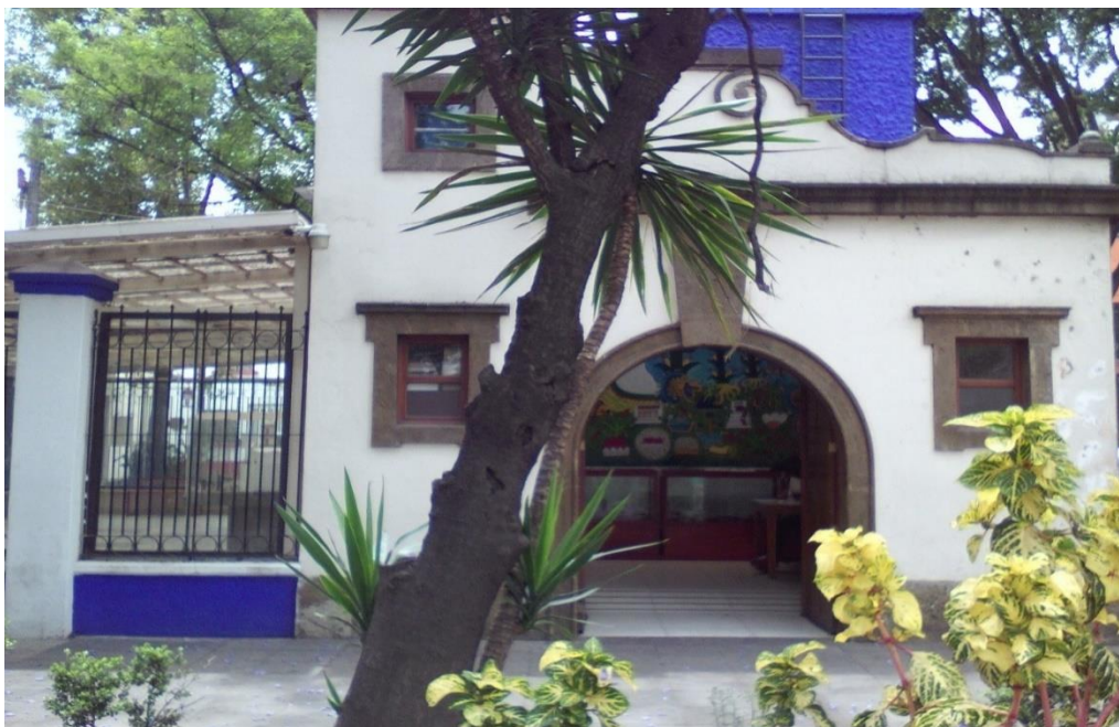
Imagen 5. Exterior de la Casa de Bombas