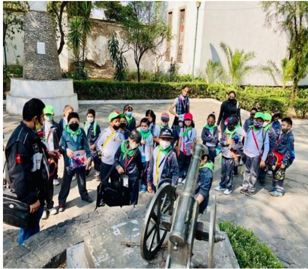
Imagen 4. Monumento a Encarnación Ortiz