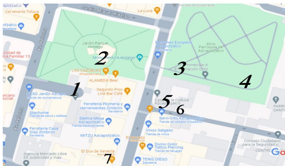
Imagen 6. Mapa del Recorrido