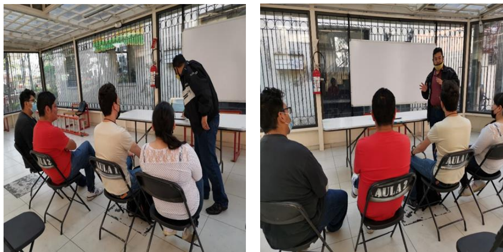
Imagen 13. Explicando las actividades a los nuevos prestadores de servicio social

Descripción: Esta foto se tomó a uno de los libros disponibles en el Archivo Histórico de Azcapotzalco 25 y muestra cómo se veía la zona del actual Jardín Hidalgo a principios del siglo XX.