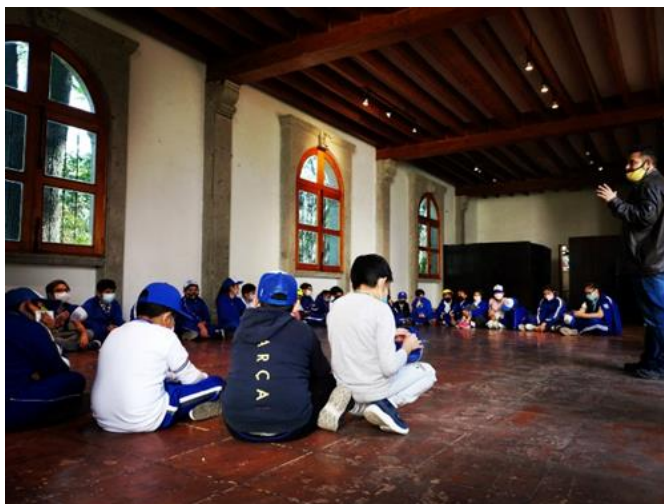
Imagen 5. Interior de la Casa de la Cultura

Finalmente, se abarca el tema de la hormiga que adorna la torre del campanario. Se les cuenta la leyenda de que cuando la hormiga finalmente alcance la cima el mundo acabará. Tras contar esta historia, se mencionan algunas de las hipótesis que se tienen del origen del símbolo. La hormiga era un glifo que estaba en alguna de las piedras utilizadas durante la construcción, más adelante durante la reconstrucción del siglo XVII fue re-descubierta y se decidió conservarla y hacerla visible.