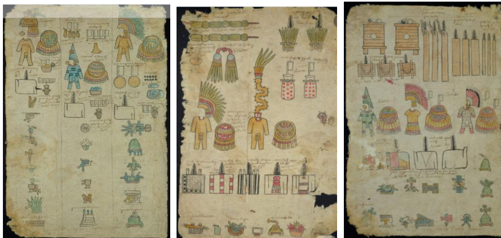
Figura 1. Folios analizados desde la “Matrícula de tributos” para tres regiones: Mixteca Baja (Yahualtepec), Mixteca Alta (Coixtlahuaca) y Cuernavaca

Fuente: Matrícula de tributos Matrícula de tributos | Mediateca INAH . A la izquierda, Yahualpetec, en el centro, Coixtlahuaca y a la derecha, Cuernavaca.