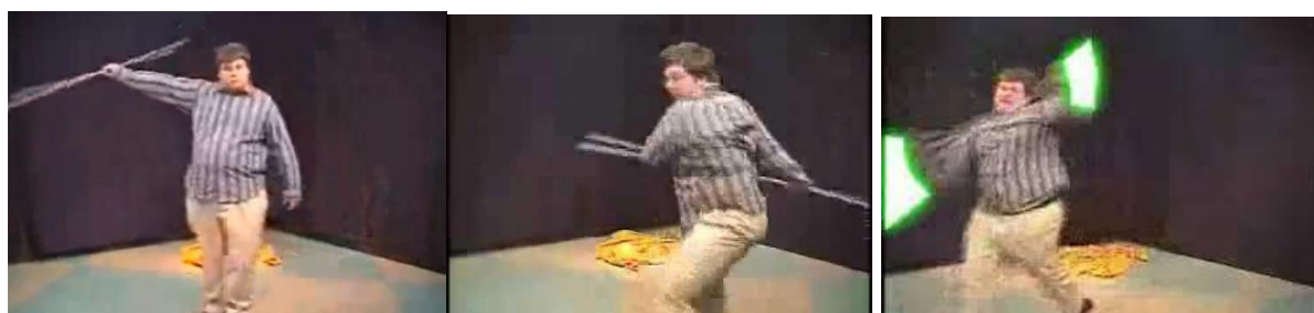
Imagen 1.1 23

Como este caso existen muchos más donde las víctimas principales son menores de edad, los cuales por el temor a sufrir más burla por parte de sus compañeros es que no exteriorizan lo que le pasa a su familia; es por eso que diversos países con esta problemática en mayor proporción se han dedicado a la creación de leyes para prevenir, regular y sancionar.