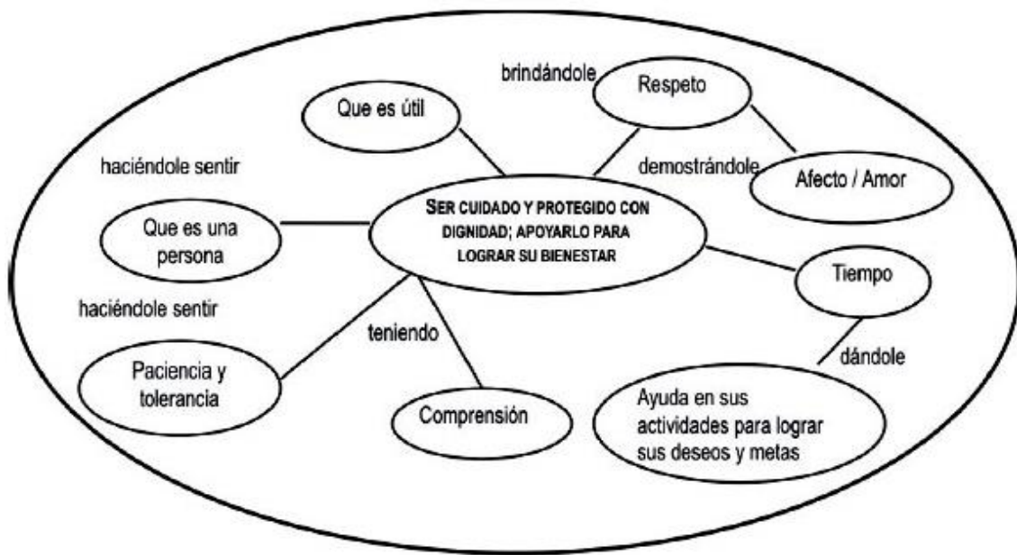
Figura 1. Diagrama de calidad de vida en el adulto mayor (R.S.)

La necesidad de la auto realización no solo implica en el adulto joven; sin embargo, el adulto mayor debe sentirse auto realizado teniendo apoyo y ayuda familiar para el logro de sus metas y perspectivas garantizado con ello la satisfacción de la calidad de vida. Según Abraham Maslow clasifica las necesidades de la persona para satisfacer la seguridad y estabilidad 13 . (Figura 2)