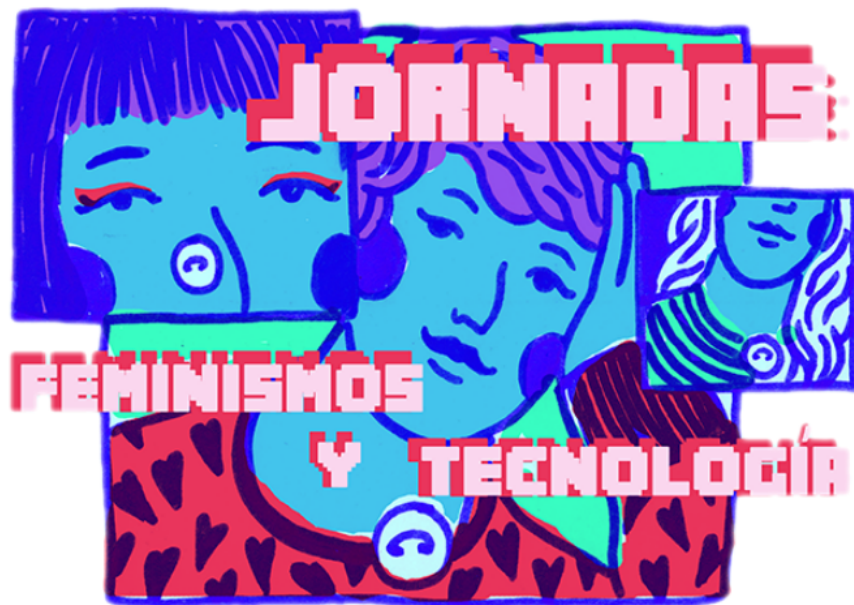
Figura 5. Fuente: Portada de la invitación a las Jornadas: Feminismos y tecnología, realizada por Lilith Emperatriz Placido San Martín, 2019. Obtenida de https://hiperderecho.org/2019/09/jornadas-feminismos-y-tecnologia/

Las metodologías se desarrollaron en dos niveles: Por un lado, fueron pensados de tal forma en que pudieran participar personas interesadas en el tema sin que tuvieran conocimientos previos y; por otro lado, era necesario dejar un registro que fuera de libre acceso. Ese registro se difundiría a través de una publicación o guía que estuviera en internet.