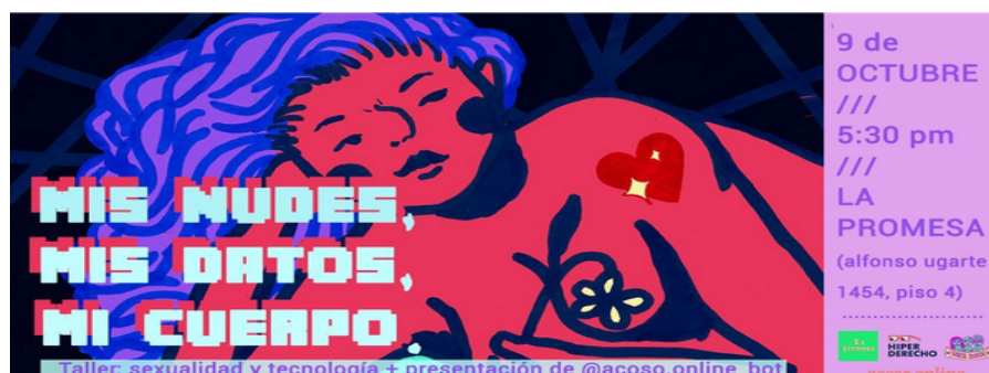
Figura 7. Fuente: Portada de la invitación al taller “Mis nudos, mis datos, mi cuerpo”, realizada por Lilith Emperatriz Placido San Martín, 2019. Obtenida de https://hiperderecho.org/2019/09/jornadas-feminismos-y-tecnologia/

momentos y fue coordinada por Hiperderecho y la Colectiva Serena Morena, específicamente la impartimos Selva N. y yo.