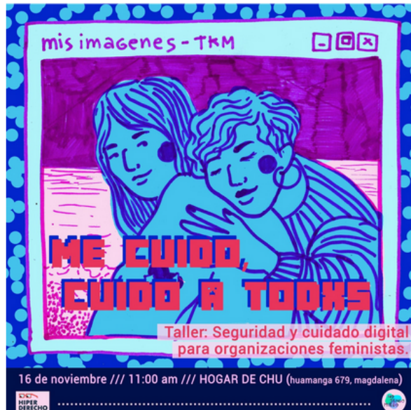
Figura 16. Fuente: Portada de la invitación al taller “Me cuido, cuido a todxs. Taller: Seguridad y cuidado digital para organizaciones feministas”, realizada por Lilith Emperatriz Placido San Martín, 2019.

El objetivo de este taller y la metodología estuvieron pensadas para que las personas que lo tomen tengan un breve acercamiento a la seguridad digital en dispositivos móviles como herramienta de prevención de la violencia de género en línea y en casos los que ya fueron víctimas de casos de distribución de material íntimo sin consentimiento o intromisión a sus cuentas, o, tengan un plan de acción y puedan evitar estos ataques.