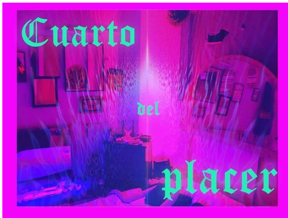
Figura 12. Fuente: Flyer y fotografía del cuarto del placer realizado por Selva N., 2020. Obtenida de https://hiperderecho.org/2019/09/jornadas-feminismos-y-tecnologia/

En la tercera parte del taller Selva N. de Serena Morena organizó una actividad en dónde construyó un espacio performativo en el que las participantes tuvieron la oportunidad de explorar su sexualidad a través de las TIC. El objetivo de este espacio es que las asistentes pudieran hacerse selfies o videos rodeadas de diversos objetos que les ayudarán a explorar su sexualidad de manera individual. Esta habitación se llamó El cuarto del placer . Aquí Selva dejó diversos objetos enfocados en el placer, como juguetes para hacer bondage , espejos, pelucas, plumas, etc., el lugar estaba iluminado con luz roja y estaban corriendo diversos videos que hablaban sobre placer sexual. Esta actividad fue un éxito, todas las chicas que entraron salieron encantadas y nos contaron que muchas no habían tenido oportunidad de fotografiarse de esta forma, de sentirse lindas, deseadas y felices.