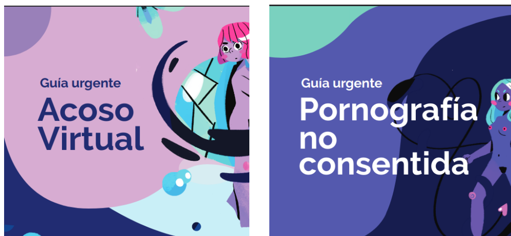
Figura 2 y 3.