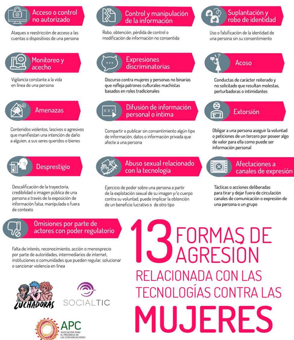
Figura 14.

En la primera parte del taller se presentó la tipología de las formas de violencia de género en línea más comunes y a cuáles estamos más expuestas las mujeres y personas de la diversidad sexual. Esta tipología fue desarrollada en México y en esta se muestran al menos 13 formas de violencia relacionadas con la tecnología por cuestiones de género. En los últimos años se ha visibilizado la importancia de estas para poder identificar cómo operan y de qué manera les podemos hacer frente.