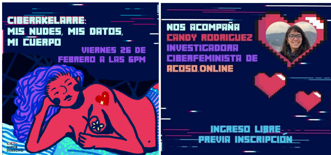
Figura 17. Fuente: Portada de la invitación al “Ciberakelarre: mis nudes, mis datos, mi cuerpo” Ilustración por Lilith Emperatriz Placido San Martín, 2019.

A continuación presento los carteles que se utilizaron para dar difusión en Instagram :