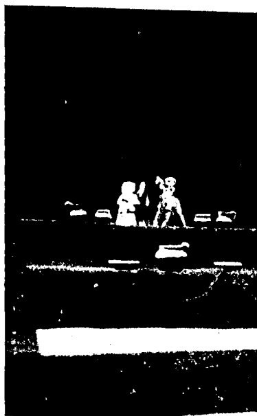
"TANGUYUS" • Muñecos y juguetes de barro. La delicia del niño zapoteca

El comercio se hace con moneda común y corriente, usándose sin embargo todavía, el cambio de mercancías. Se efectúa en géneros, sedas, joyas, vestidos, comestibles, alfarería, flores, etc. El espectáculo