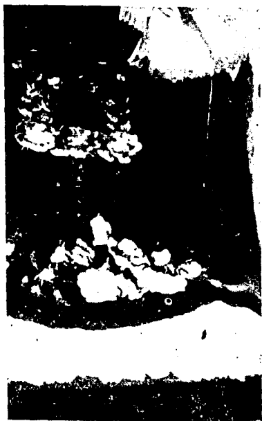
Indumentaria completa: - huipil de cuerpo, falla de olán y huipil de cobeza de blonda.

El vestido de casa, consta de una enagua que baja casi hasta el suelo, aparentemente de una pieza, pero que vista con atención se descompone en dos, una más grande llega hasta cinco a diez centímetros más allá de la rodilla, y otra más pequeña que se llama olán y que en este caso es del mismo color de la tela. Este es frecuentemente de algodón a grandes dibujos y vivos colores. El huipil, a la manera de