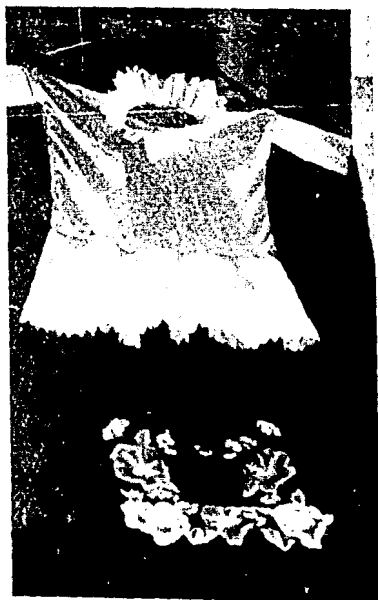
Huipiles de cabeza y de cuerpo.

Ixtaltepec, Espinal, Juchitán y Tehuantepec, lucen actualmente en un 95% sus trajes típicos, que a la mujer le dan un estilo y belleza que admira. Casi todas las personas del centro, conocemos el traje de tehuana, pero en una forma algo distinta, adulterada, su popularidad