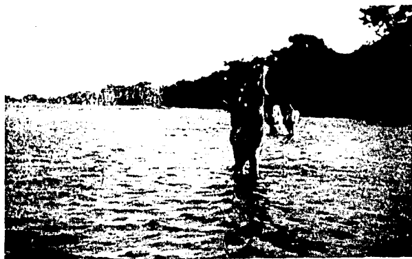
El Río de los Perros

Este Río de los Perros se dirige de Noroeste a Suroeste, tiene su origen en las montañas de Guichisú; al pasar por las de La Ollaga, aumenta su volumen y siguiendo la dirección antes mencionada pasa a un lado de Ciudad Ixtepec, en donde es aprovechado para el riego de hortalizas en su entrada al pueblo, para el alejamiento de inundaciones al terminar y para lavado de ropa y baño de aseo. Atraviesa Ixtaltepec, en donde se aprovecha para tomar agua, lavado, baño y