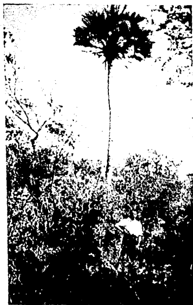
Aspecto que ilustra sobre la Flora del Territorio de Ixtaltepec.

Su altura sobre el nivel del mar es de 27 Mts. aproximadamente, y tiene por límites, Ixtepec por el Noroeste, Juchitán por el Sur, Te-