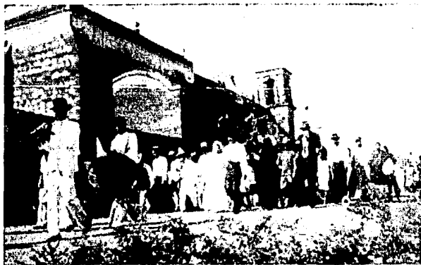
Los novios saliendo de la Iglesia

En el tercer sábado, el novio va por la novia y juntos, en medio de sus amistades y familiares, van a presentarse al Municipio, acompañados por la constante bulla de los coheteros. En las primeras horas de la tarde se efectuará el matrimonio por lo civil, terminado el cual, se dirigen a la casa del novio, en donde serán obsequiados con una cena en la que