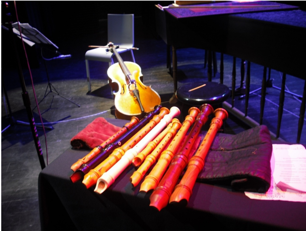
Una parte de la colección de flautas de Horacio Franco, 26 de mayo de 2010.

--Amo mi estilo, soy yo, mi guardarropa está lleno de pantalones ajustados, -me fascinan los Levi's de mujer, debido a que soy muy nalgón y ese corte me sienta perfecto- camisas con texturas de piel y cuero, telas brillantes, ajustadas, de colores vivos y mis botas vaqueras puntiagudas de variados colores. Es lo que me hace sentir cómodo, verme como me siento.