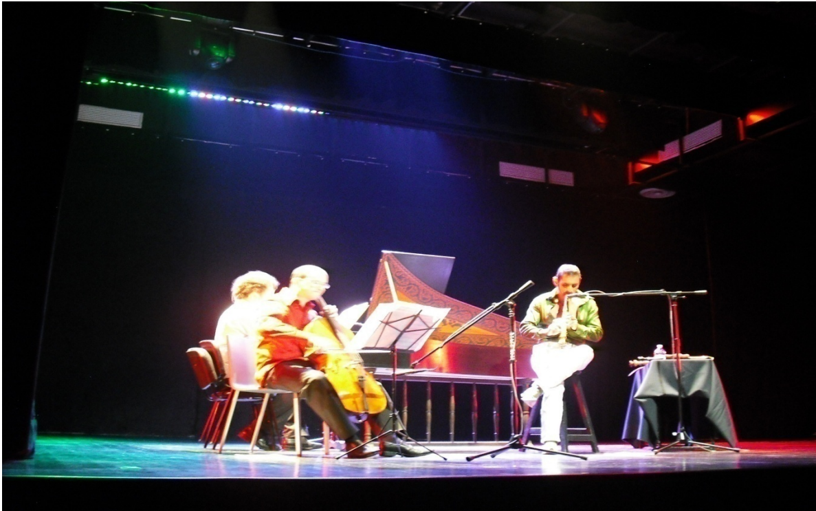
Concierto en la Inauguración del Foro del Dinosaurio, Museo Universitario del Chopo. 26 de mayo del 2010.

--Hoy por hoy, el ser homosexual aparentemente ya no asusta a nadie, pero cuando se trata de manifestar la orientación sexual en círculos sociales en donde imperan las “buenas costumbres” o donde se ponen en riesgo la estabilidad familiar, laboral o escolar, es cuando la situación se complica. Nuestra sociedad debe aprender a ser congruente entre lo que dice que es. Lamentablemente está compuesta por gente manipulada por los medios de comunicación, que genera estereotipos tanto de sacerdotes como de homosexuales.