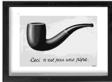
Autor: René Magritte, (1898-1967). Pintor surrealista belga. Título original de la obra: La traición de las imágenes, (1929). Óleo sobre lienzo.

a. La siguiente imagen es una obra del pintor belga René Magritte. El autor incluye en la parte inferior la frase en francés “ Ceci, n’est pas une pipe ”, que quiere decir: “Esto no es una pipa”. Observa el cuadro por un momento.