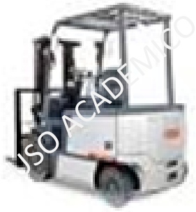
Imagen 2. EJEMPLOS DE EQUIPAMIENTO DE LOGIS

cuando el estado del tiempo pudiera no permitirlo; también cuenta con tractocamiones, portacontenedores, plataformas y cajas secas (ver imagen 2).