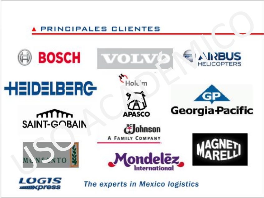
Imagen 1. PRINCIPALES CLIENTES DE LOGIS

La imparcialidad Logis la muestra con quienes ya son sus clientes pero no al escogerlos; es una empresa que tiene bien marcado su nicho de mercado; sus clientes son empresas certificadas y bien constituidas la gran mayoría de renombre internacional (ver Imagen 1).