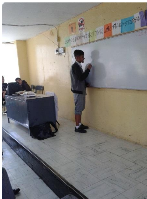
Sesión 14 “Derechos de los adolescentes”.

La dinámica de esta sesión fue en equipos y debían clasificar las carreras que se encontraban escritas en hojas de papel de acuerdo con las diferentes áreas de conocimiento.