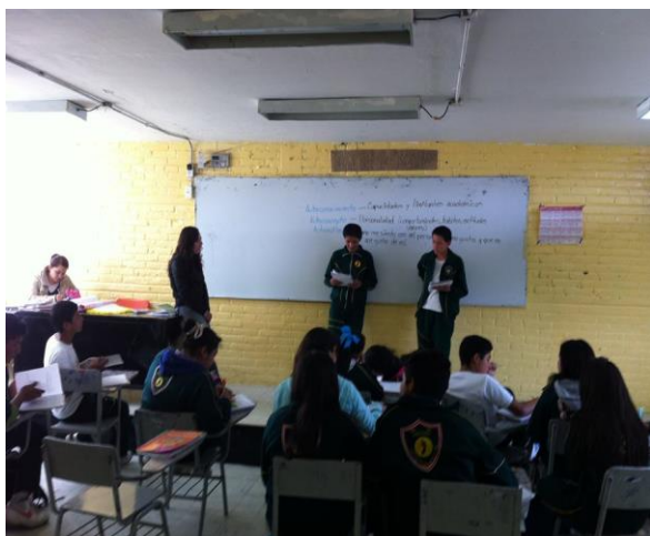
Sesión 4 “Conocimiento de sí mismo”

Utilicé distintos recursos materiales para transmitir la información a los alumnos, por ejemplo, medios audiovisuales y materiales impresos que evitaron cayera en la monotonía.