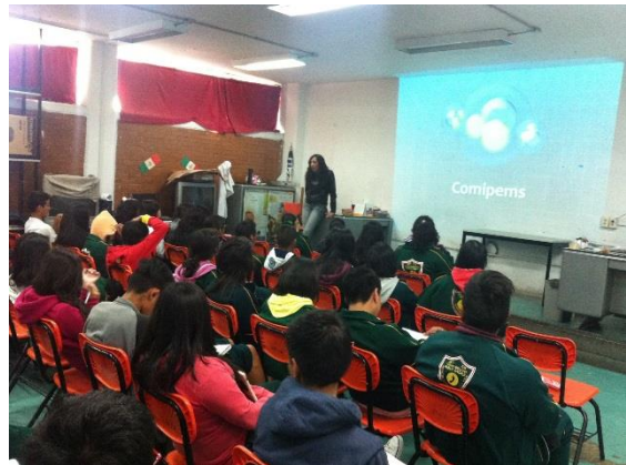
Sesión 9 “Oferta Educativa (proceso COMIPEMS y tipos de bachillerato)”

Debido a que el contenido de esta sesión era bastante, opté por realizar una presentación en power point para ir dosificando la información y les quedará claro a los estudiantes. Con la mayoría de los grupos bajé al aula digital, pero a causa de la indisciplina, con uno tuve que quedarme en el salón de clases.