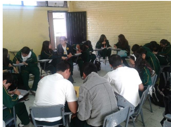
Sesión 14 “Derechos de los adolescente”

A lo largo de las sesiones, mientras les explica el tema a los alumnos, mi compañero supervisaba que no estuvieran distraídos, platicando o jugando.