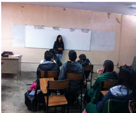
Sesión 12 “Carreras por Áreas de Conocimiento”

En la mayoría de las sesiones, antes de comenzar a explicar el tema, realizaba un sondeo para recuperar los conocimientos previos de los estudiantes. Asimismo, suscitó un ambiente de confianza para que expresarán sus dudas sin pena.