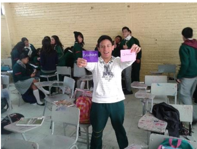
Sesión 12 “Carreras por áreas de conocimiento”.

Hubo algunas sesiones en donde, de acuerdo al tema, adecuó juegos de mesa conocidos, como fue el caso de la lotería para la sesión “Tipos de bachillerato” y el Pictionary para la de “Los derechos de los adolescentes”. Además en algún momento, pude diseñar mi propia técnica grupal cuando di el tema “Factores que influyen en la elección de bachillerato” y “Carreras por áreas de conocimiento”.