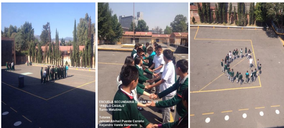
Sesión 15 “Solución creativa de conflictos”.

A lo largo del taller evite repetir las dinámicas, traté de que estas proporcionarán ciertas experiencias a los alumnos y fomentarán una participación activa para que comprendieran mejor, intenté que todo el grupo es viera involucrado en las actividades y que en algunas se aplicará lo enseñado pues “la aplicación de lo visto en clase a situaciones o actividades de la vida diaria, hace que los aprendizajes se asienten de una manera más permanente en la personalidad de los estudiantes” (Zarzar, 1983, p. 5). Las técnicas que ejecuté durante mi estancia en la secundaria se encuentran descritas en las cartas descriptivas anexas al final.