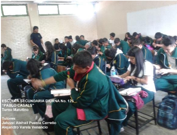
Sesión 3 “Factores que influyen en la elección de bachillerato”

Respecto al manejo de grupo, fue importante coordinarme con mi compañero para tener un mejor control de la disciplina, pues eran bastantes numerosos -de 45 a 50 alumnos- y al ser un taller ajeno a las materias, resultaba fácil que los estudiantes se distrajeran. Desde el principio acordamos que mientras uno explicaba el tema, el otro debía encargarse de que todos prestarán atención, esto cambio conforme transcurrieron las sesiones y en los últimos temas tuvimos que modificar nuestro trabajo, optamos por dividir a los grupos en dos para que cada uno de nosotros se hiciera cargo de un equipo y de esta manera tener un mejor control.