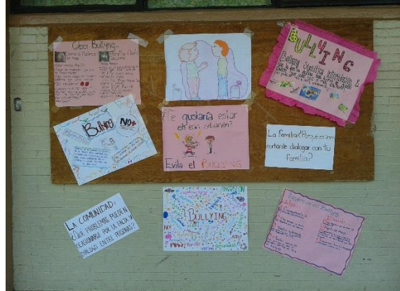
Sesión 7 “Estrategias para enfrentar el bullying y el ciberbullying”

Para presentarles algunas sugerencias de cómo enfrentar la violencia dentro de la escuela y evitar el acoso virtual, recurrí al diseño de láminas y posteriormente, junto con los alumnos realicé carteles que se exhibieron a toda la comunidad estudiantil de a secundaria.