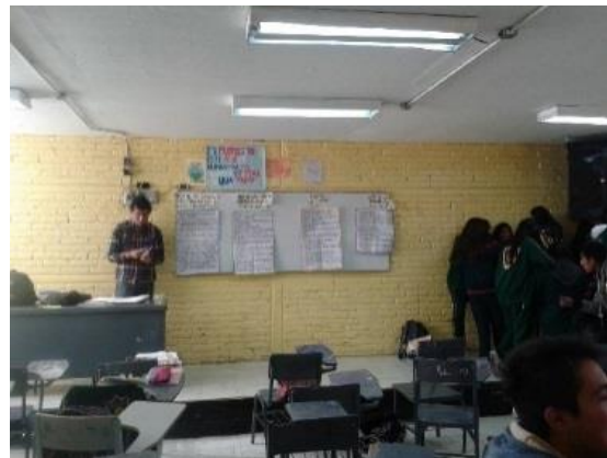
Sesión 12 “Carreras por áreas de conocimiento”