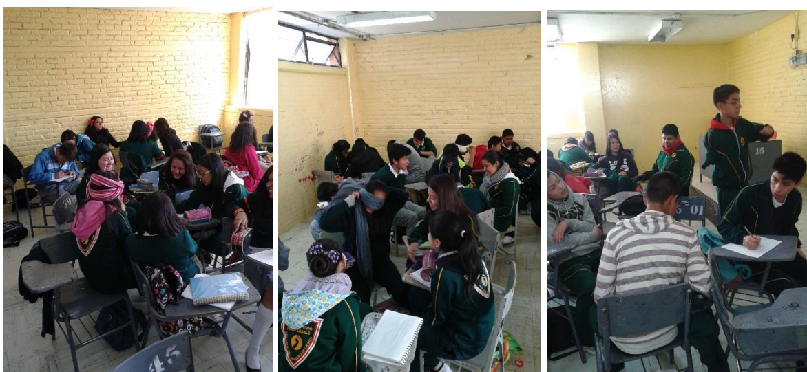
Sesión 8 “Valores”.

Durante esta sesión se me permitió bajar con los estudiantes al patio a realizar la dinámica pues quería evitar la monotonía del salón de clases.