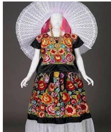
Vestidos De Tehuana. Pinterest.