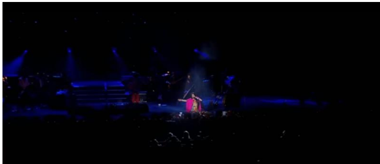
Imagen. Escenario e iluminación de Lila Downs interpretando el son de “La Llorona”