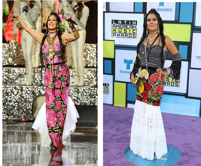
2016 Latin American Music Awards - Show – Arrivals.

En las fotografías es evidente la estilización del traje de tehuana en el marco del performance que construye; de acuerdo con Auslander (2006) el que Lila porte este traje en diversas presentaciones forma parte de su persona musical que va de acuerdo a con su discurso de mantener los elementos que le heredaron las comunidades rurales/indígenas pero adaptándolos a ciertos cánones estéticos que forman parte de su imagen de autor presentada (Ahonen, 2007), mostrando estos trajes en eventos como plataforma para anunciar su persona musical frente a sus seguidores y dentro de la industria.