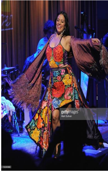
Lila Downs at The GRAMMY September 17, 2012 in Los Angeles, California.