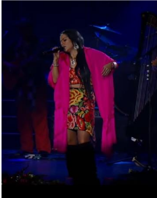
Fig. 2. Lila Downs (2012). Presentación en vivo “La llorona”