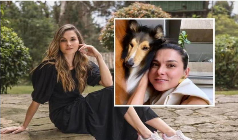
Carolina Gómez, actriz colombiana, con emotivo mensaje confirma la muerte de su “amigo fiel”.