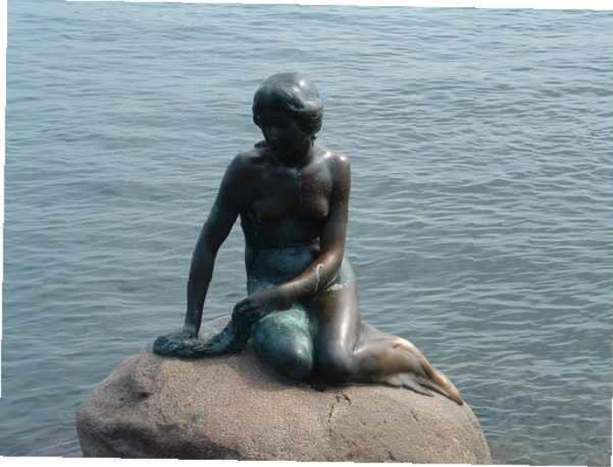
Estatua de la Sirenita en Copenhague. Guarnición de Linda

conduce a la entrada de la mandrágora en el folclore humano. En la leyenda, cuando la planta es desenterrada, sus gritos pueden matar a cualquiera que la escuche.