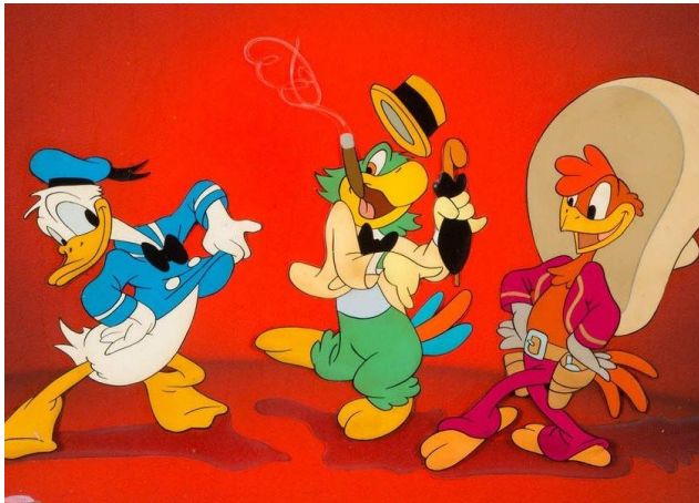
Los tres caballeros (1944)

El Gallo Panchito, el Loro José Carioca y el Pato Donald protagonizan esta comedia musical en la que se combinan personajes reales con dibujos animados. Mucho ritmo, chicas guapas y