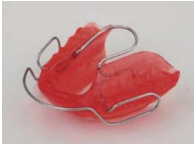
Figura 7: Aparato Bionator

Aparato Bionator: Toma las caras linguales de los dientes inferiores de molar a molar, se prolonga hacia el maxilar y se desplaza hacia los dientes laterales hasta el canino. Se colocaacrílico sobre las caras oclusales desde las cúspides linguales.