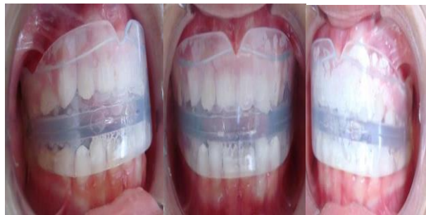
Figura 8: Aparato Myobrace

Fuente: Stephanie Santos Nery, Priscila Xavier de Araujo. Ortodoncia Miofuncional.