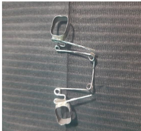
Figura 4: Aparato Quad-helix

Quad-helix: Aparato realizado en laboratorio con alambre de calibre número 32, se realizaron con bandas de primer molar superior derecho e izquierdo, a través de dobleces y soldadura.