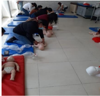
Figura 2: Practica de RCP en simuladores de adulto