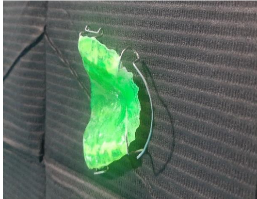
Figura 5: Aparato progenie

Aparato progenie: Ejecución de la placa, con realización de arco vestibular anterior que contacta con los incisivos inferiores. A este arco se le llama arco progenie, sustituye el arco vestibular por el arco progenie.