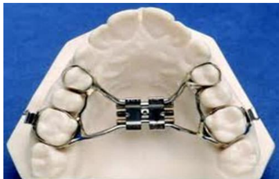
Figura 6: Aparato Hyrax

Aparato Hyrax: Aparato de ortodoncia que realizará la disyunción palatina de forma rápida del hueso maxilar superior en cual tiene que estar activándose dos veces al día durante 3 días seguidos, y dos días de descanso