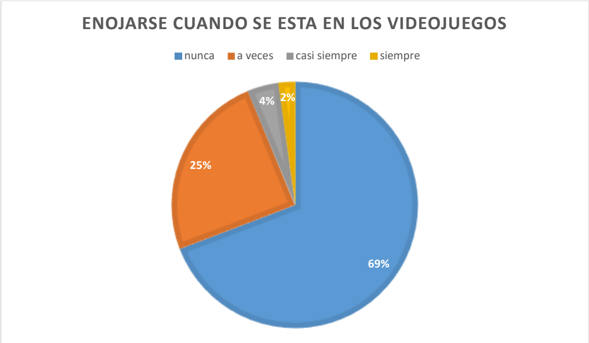
4.5.- Gráfica 4

Aquí se puede observar que la mayoría de los niños encuestados no refieren sentir enojo cuando juegan videojuegos