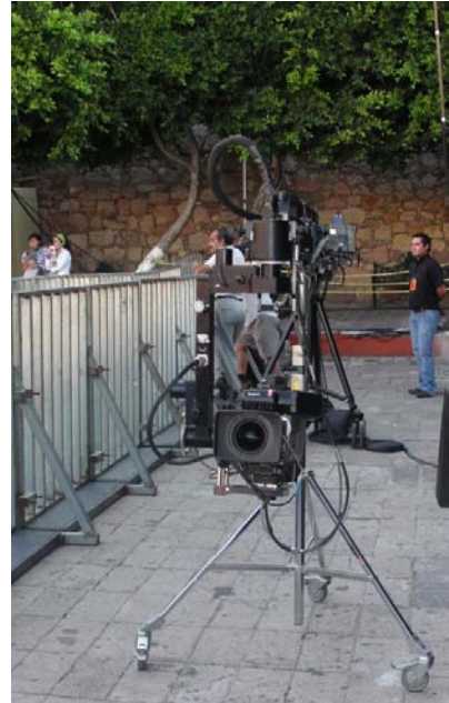
Cam Mate utilizada en la explanada de la Alhóndiga

En esta etapa del montaje se debe corroborar en todo momento con el director de cámaras y que todo el equipo técnico necesario se haya instalado conforme al plan de trabajo, que la Cam Mate (cámara grúa) esté completamente montada y que no obstruya la visibilidad de las demás cámaras y la correcta ubicación de éstas, las luces, visibilidad de escenario, etc.