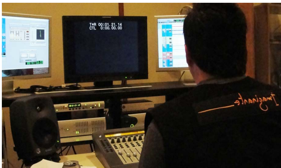
Proceso de Protools de un programa del 35 Festival Internacional Cervantino.

Al Operador del protools se le comentaban las anotaciones realizadas durante la grabación y se le destacaba el time code donde tenía que hacer énfasis en corregirlo por indicación del Director de cámaras, pese a que el trabajo del operador es revisar y corregir todo el audio, es necesario indicarlo.