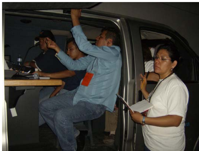
Unidad Móvil de la Dirección General de Televisión Educativa (DGTVE)

Por ejemplo, en la Unidad Móvil de la DGTVE que estaba adaptada en un vehículo de tamaño reducido, tomando en cuenta el numero de personas que deben permanecer en ella durante una grabación, por lo que el asistente de dirección literalmente, quedaba fuera de la Unidad Móvil, pero se tenía que buscar el punto donde el time code fuera visible.