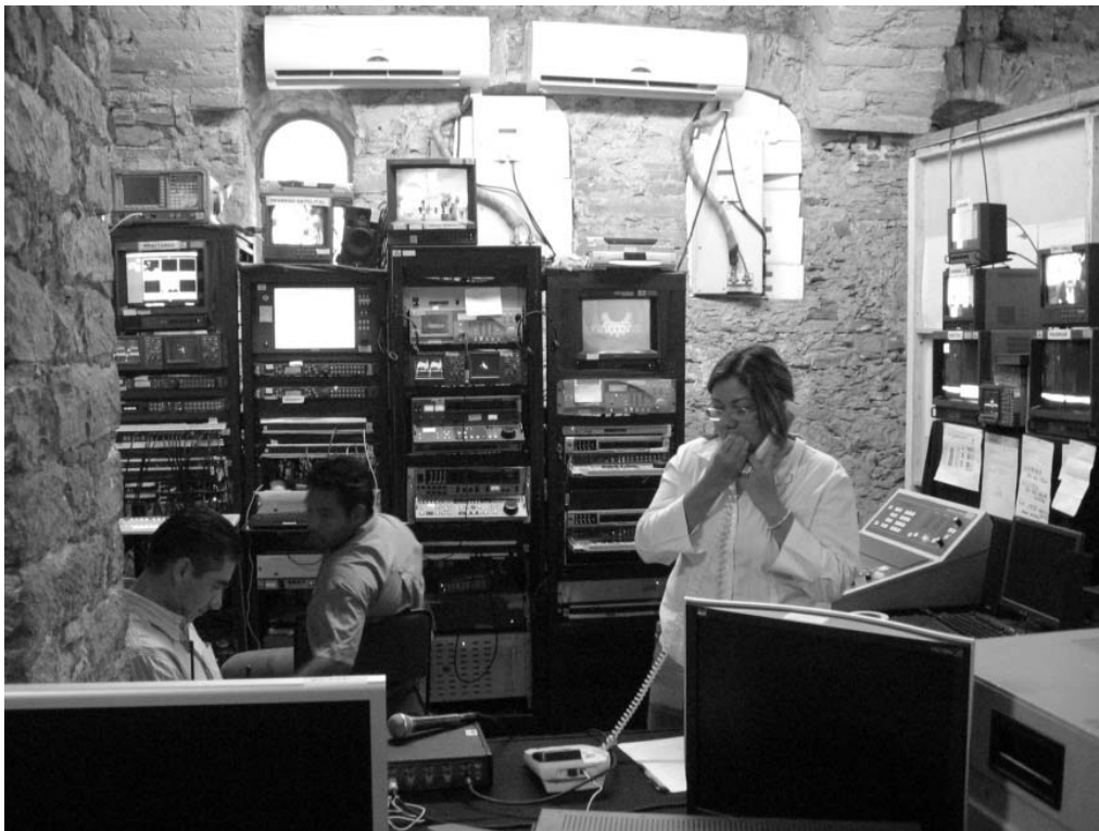
Envío de programa de Guanajuato al DF.

Cuando todo estaba correctamente sincronizado y todo estaba listo se comenzaba con el envío, los ingenieros en el control maestro en el D.F. daban indicación, vía telefónica, de que se estaba grabando en las maquinas en el D.F. para comenzar a grabar, esta indicación se la comunicaba a los ingenieros encargados de las maquinas en Guanajuato y avisaban que darían play a las máquinas en Guanajuato para que estuvieran atentos en el D.F.