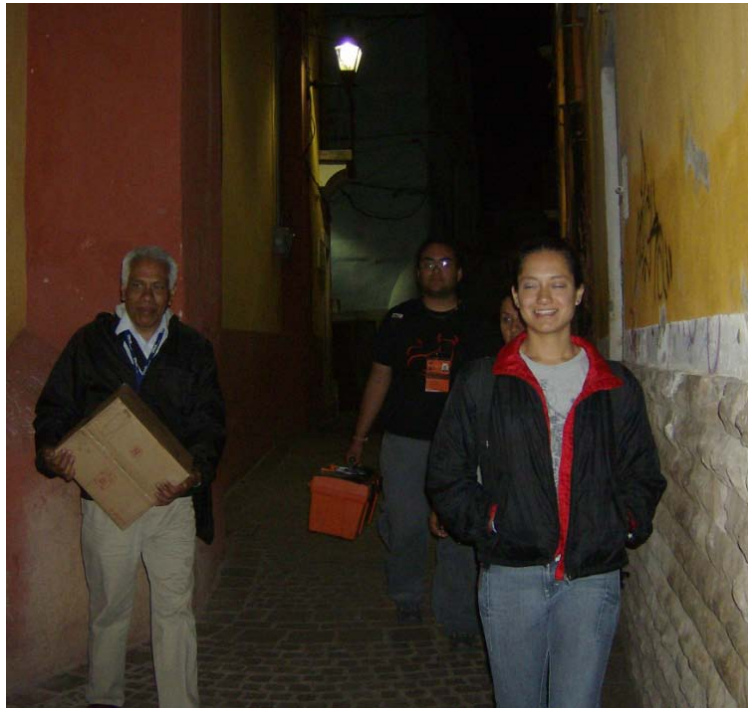
Regreso a la Sala de Prensa por los Callejones de Guanajuato

Una vez que el equipo de ingenieros y técnicos han terminado de desmontar y guardar el equipo que se utiliza, la etapa de la producción ha terminado, aunque el trabajo aun continua, ya que, dependiendo de qué hora del día sea, podemos dirigirnos a la Sala de prensa para comenzar a preparar lo pertinente a la siguiente grabación y atender pendientes ó dirigirnos a la isla de post-producción para la edición de los programas ó a la isla de protocols para continuar con la edición de los programas que se habían grabado y que ya tenían fecha de envío.