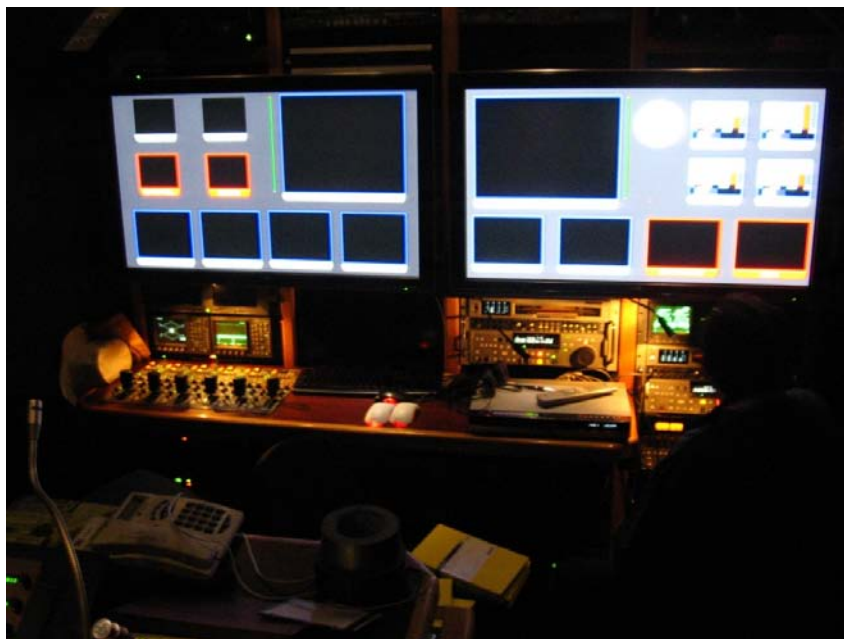
Monitores digitales Interior de la Unidad Móvil Canal 22. Foto: Carlos Reyes

El director de cámaras observa todos los monitores y decide con cuál de las cámaras comienza a realizar la toma, elige la cámara que se encuentra al centro ya que es la que emite una imagen con un full shot 41 que es un encuadre de la cámara donde se ve todo el escenario donde se realiza el evento por lo que se tiene cubierto 42 el escenario.