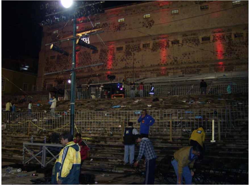
Personal de Canal 22 después de la transmisión de la Inauguración Explanada de la Alhóndiga de Granaditas

Después de la transmisión, solo es cuestión de esperar a que los ingenieros e integrantes del personal técnico desmonten los micrófonos, las luces, las cámaras, los cables, para poder dirigirnos a la Sala de Prensa y comenzar con los preparativos de la grabación del día siguiente.