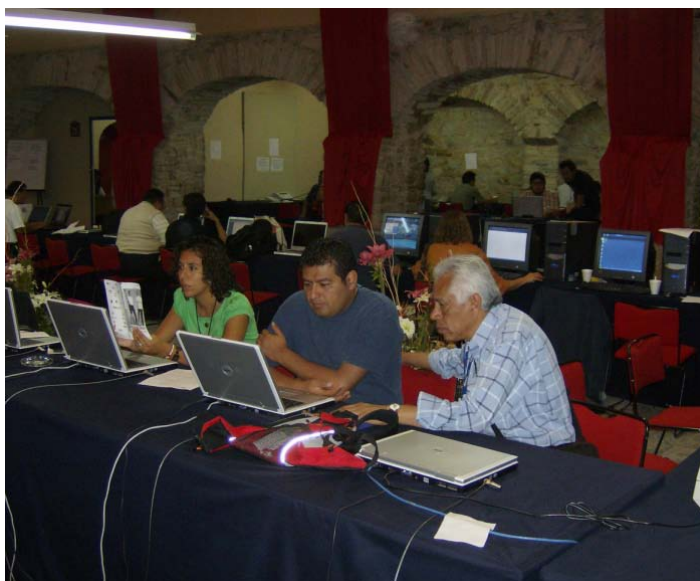
Sala de Prensa del FIC.

Además en esas instalaciones se localizaban la isla de post-producción.