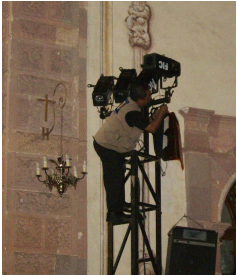
Colocando luces en el Templo de la Valenciana En la foto: Feliciano López

Otro ejemplo de ciertos contratiempos que se pudieron resolver previo a las grabaciones, fue el caso del Templo de la Valenciana debido a que este recinto y no está diseñada para realizarse conciertos en su interior y el problema que se presentó fue la colocación de las luces debido a que en este lugar no existen travesaños para poder colocarlas, por lo que se tuvieron que montar en columnas de hierro pedidas al FIC y realizadas especialmente para eso.