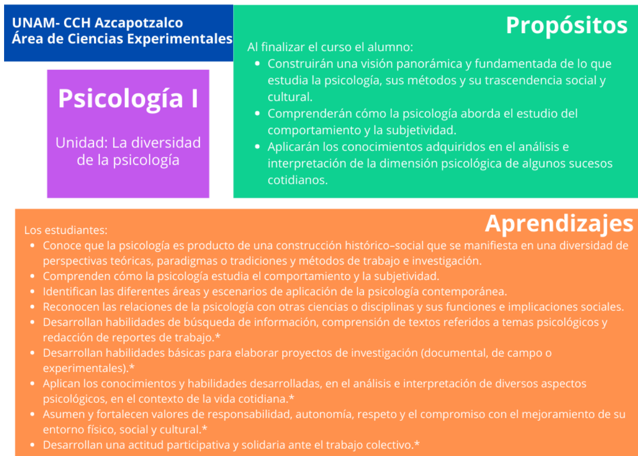
Ilustración 2 Programa de Psicología. Información del programa de ciencias experimentales. Elaboración propia.

Estos aspectos son importantes para que el estudiante pueda construir y darle significado a su aprendizaje, pero para poder llevarse a cabo requiere de un docente que también tenga un papel activo en el desarrollo de estrategias que tomen en cuenta los cambios sociales, la reestructuración de los espacios educativos, así como la experiencia de los estudiantes en su aprendizaje. A continuación, se presenta el programa (ilustración 2).