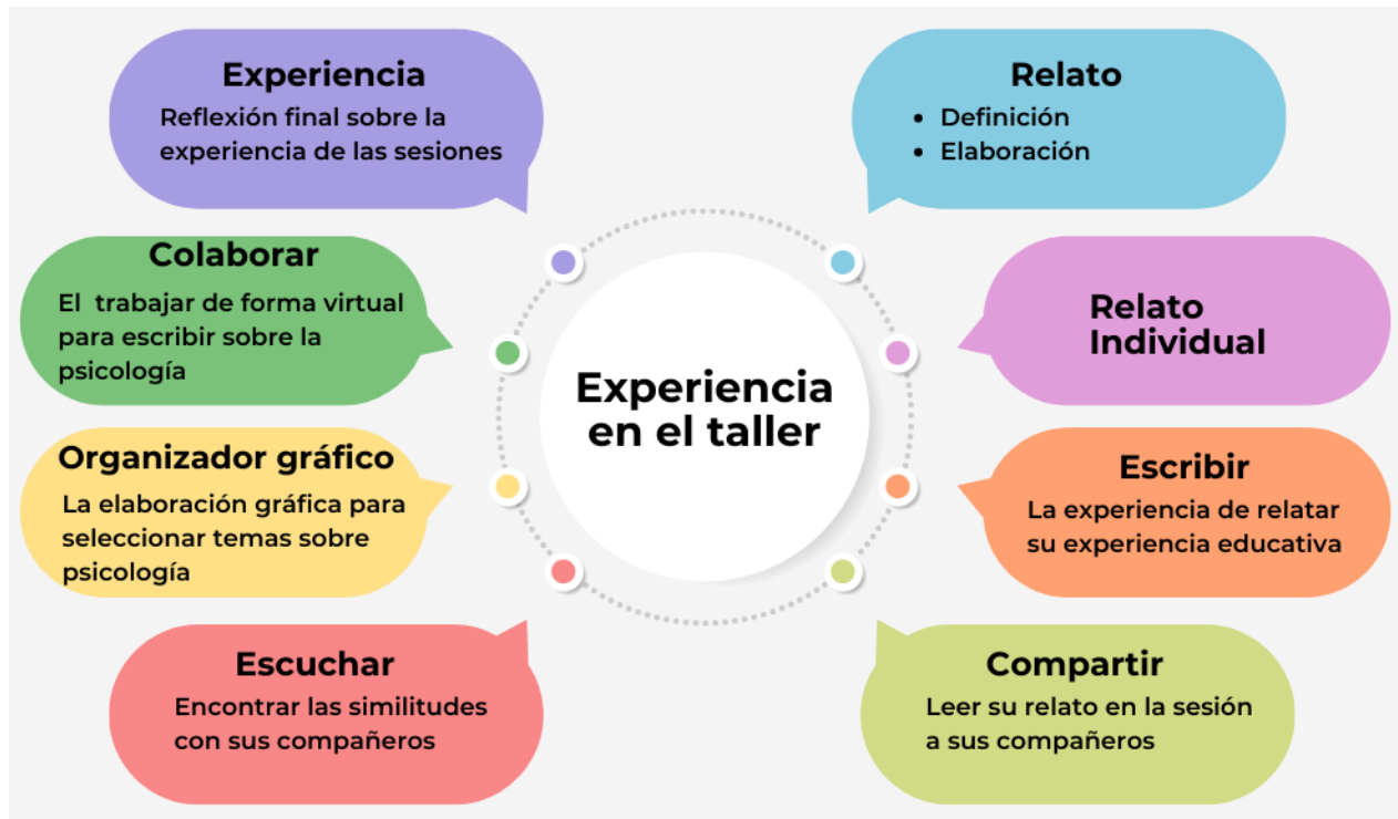
Ilustración 5Ejes de análisis. Elaboración propia.