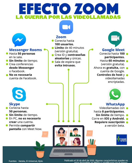
Imagen 1. La competencias en las plataformas

Software and Tech (2020). Efecto Zoom, LA GUERRA POR LAS VIDEO LLAMADAS.