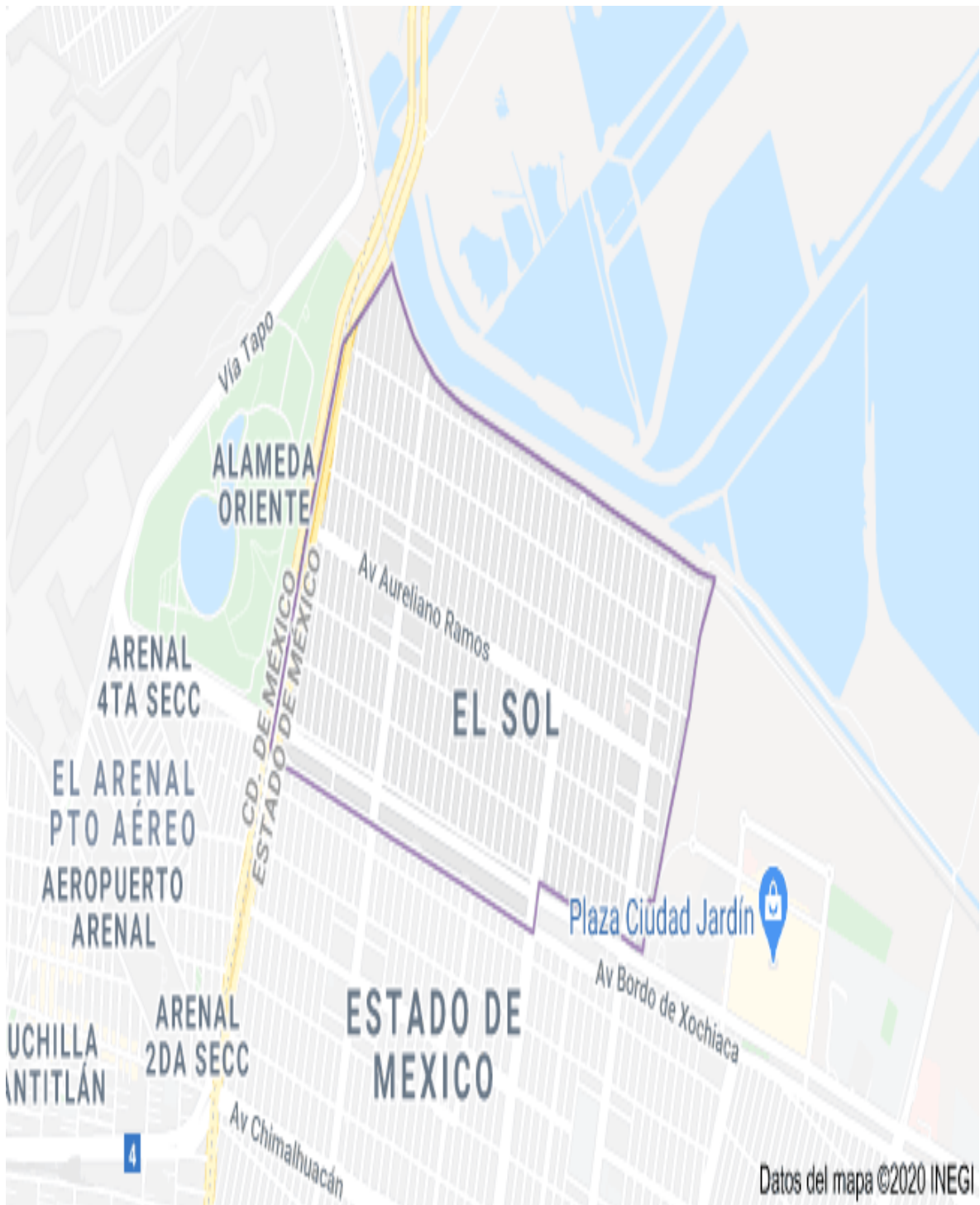
Anexo No 1