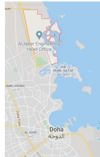
Mapa 1 Ubicación de la ciudad Lusail, disponible en [ https://www.google.com/maps/place/LusailCatar/ ]

En este contexto surgió uno de los proyectos más grandes de la región. La creación de la ciudad Lusail, uno de los proyectos comerciales más grandes de Medio Oriente estará ubicado a 22 km al norte de Doha y se extenderá sobre un área de 38 km 2 frente al mar 137 . Lusail busca dar una imagen futurista, por lo que se volverá una de las ciudades más avanzadas de Qatar y de la región del Golfo. Respecto al Mundial, las sedes estarán en un radio de 50 kilómetros de la ciudad por lo que se prevé que el eje económico será guiado por el turismo; sin embargo, se han planteado como obstáculos para Qatar: las altas temperaturas, el bloqueo económico de sus vecinos del Golfo, la carencia de infraestructura para la recepción de turistas, y las críticas respecto al capital humano que se ha perdido durante la construcción del proyecto.