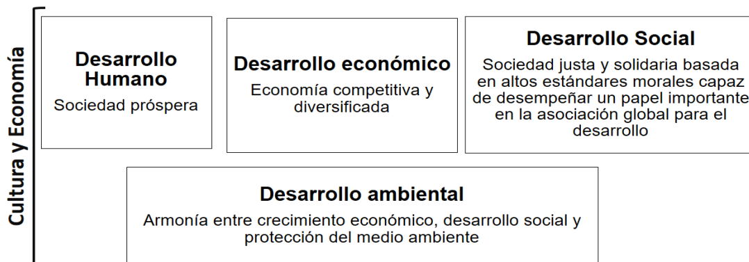
Diagrama 2. Visión 2030 Qatar. Elaboración propia con datos de Oficina de Comunicación del Gobierno de Qatar [ https://www.gco.gov.qa/en/about-qatar/national-vision2030/ ]

Como resultado de la Visión 2030, la diplomacia de Qatar se conformaría de dos pilares esenciales: la economía de paz que se basa en la inversión en la sociedad civil, el capital humano, el desarrollo sostenible e innovación; y la diplomacia cultural 143 que busca crear una conexión con los Estados a través del acercamiento y la promoción de la cultura nacional.