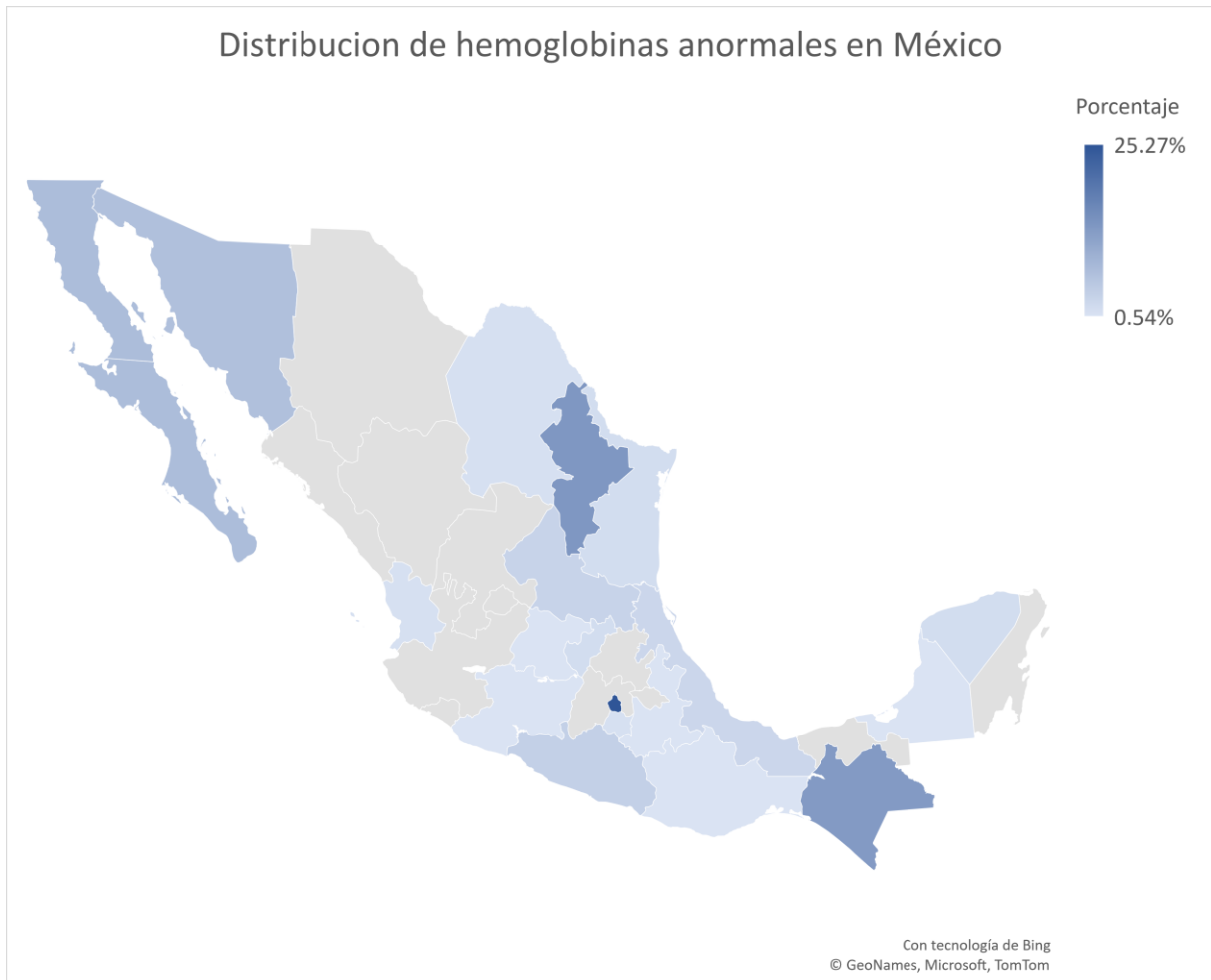
Fig. 3 Distribución de las hemoglobinas anormales por estado. México (2019-2020)

Geográficamente el Estado que presento mayor porcentaje de casos fue la Ciudad de México (25.27 %), seguido por Nuevo León (13.73%), Chiapas (13.18), Guadalajara (8.79%), Baja California (7.14%), Sonora (6.59), Guerrero (3.84%). En una proporción menor podemos encontrar a Chihuahua, Tamaulipas, Culiacán, Querétaro (1.64%) seguido de Coahuila, Morelos, Nayarit, Toluca Edo. Mex. (1.09%) y finalmente a Campeche, Michoacán, Oaxaca, Puebla, Guanajuato (0.54%) Fig. 3.