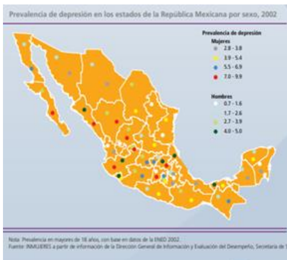
Figura 1. Muestra la prevalencia de la depresión en los estados de la República Mexicana por sexo.

De igual manera, el Instituto Nacional de Mujeres indica que existen 4 padecimientos principales, los cuales son: esquizofrenia, depresión, obsesivo-compulsivo y alcoholismo, (OMS, 2005). Siendo la depresión la primera causa de atención psiquiátrica en México.