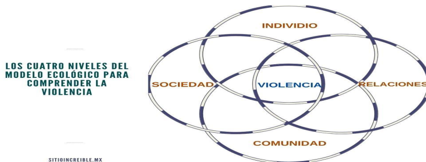
Figura 1 Los cuatro niveles del Modelo ecológico para comprender la violencia.

A continuación, se representan los cuatro niveles antes mencionados que influyen en la violencia con un diagrama de Venn el cual ayuda a la comprensión de esta, relacionando a los cuatro factores dentro de un mismo universo.