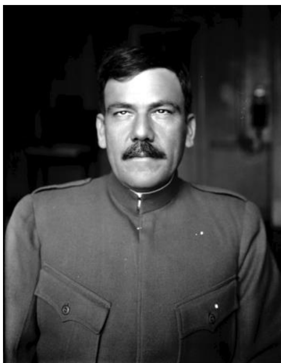
Plutarco Elías Calles, 1920

Carranza, quien poco antes se había enterado de que el general Pablo González había desconocido su gobierno y prácticamente había pactado con Obregón desde principio de abril, 405 abordó el llamado “tren dorado” y abandonó la ciudad de México el cinco de mayo de 1920 acompañado de gran parte de su administración. Antes de partir dio a conocer un manifiesto en el que criticaba la postura belicista de los candidatos presidenciales. 406 Después de un complicado escape rumbo a Veracruz en la que trataba de emular lo realizado a finales de 1914 en el contexto de la lucha de facciones, el todavía presidente constitucional fue asesinado la madrugada del 21 de mayo en una cabaña ubicada en el pueblo de Tlaxcalantongo, Puebla. Tres días después del asesinato, Adolfo de la Huerta, fue designado presidente sustituto de la república por el Congreso de la Unión para cubrir el periodo del 1º de junio al 30 de noviembre del mismo año. 407 En su gabinete, el líder militar de la revuelta, fue nombrado secretario de Guerra y Marina.