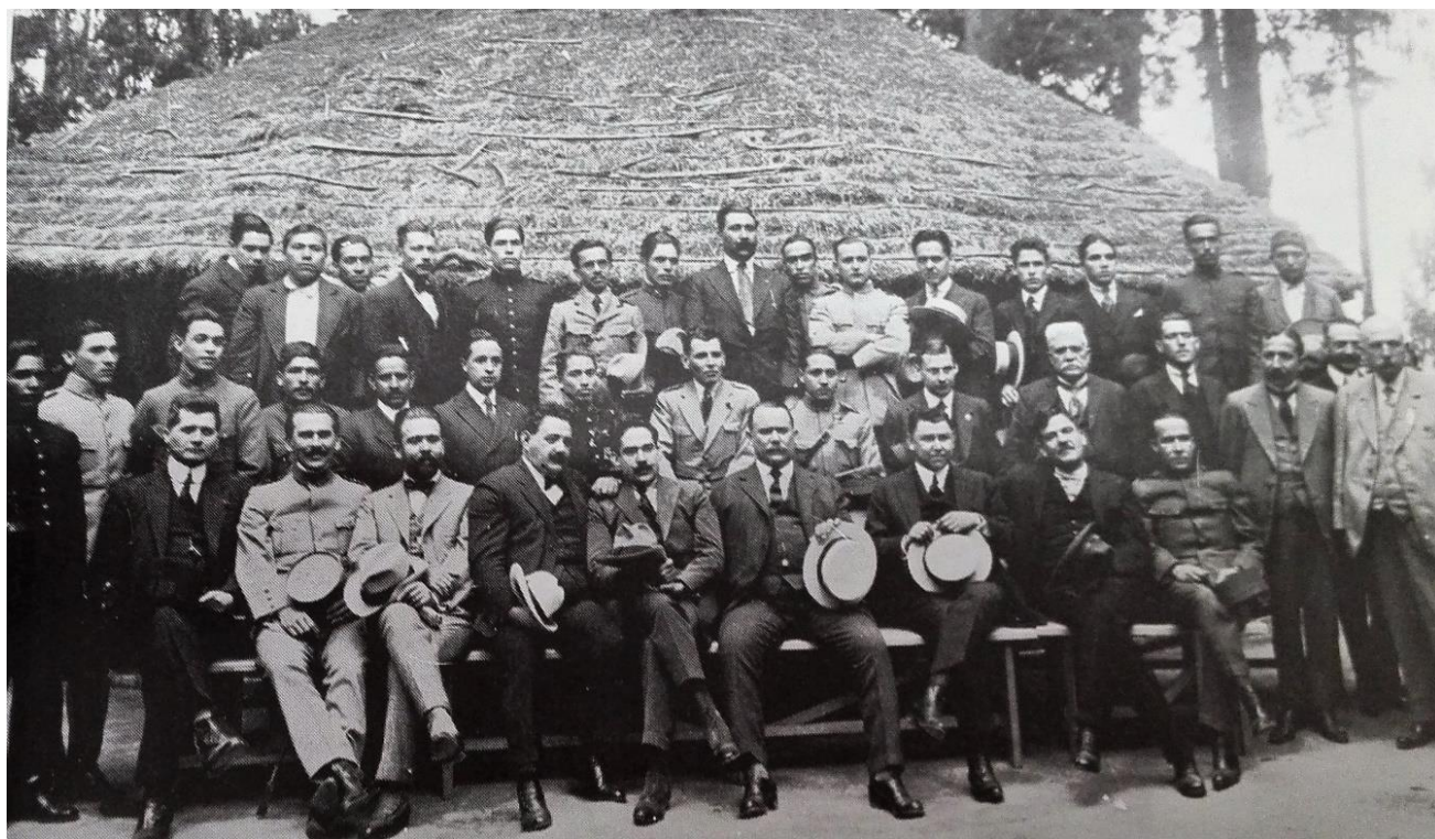
Celebración del aniversario de la huida de Obregón de la capital del país. Febrero de 1921. Calles al lado de Adolfo de la Huerta y el general Francisco R. Serrano. Gustavo Casasola, Historia Gráfica de la Revolución... , v. 5.

Pese a todo, era indudable que dentro del grupo las relaciones existentes eran mucho más complejas, inestables y cambiantes. Dentro del mismo se dieron fracturas entre 1920 y 1922, y el ejemplo más claro fue la de Alvarado, que si bien había apoyado a Obregón en la última fase de su campaña presidencial, sus aspiraciones políticas también tenían como objetivo ocupar la silla presidencial; Alvarado mantenía una buena relación con De la Huerta, no así con los otros dos miembros del dispar triángulo. Otra ruptura se dio a finales de 1923, la más conocida de todas, y fue justamente la del hombre que afirmó que “los tres reunidos” podían considerarse una misma persona, Adolfo de la Huerta.