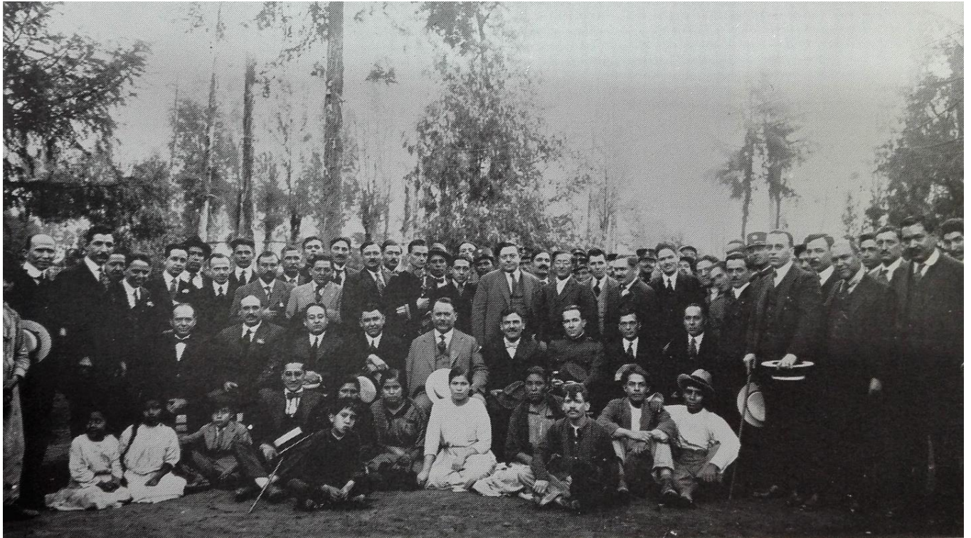
Primer aniversario del plan de Agua Prieta. Plutarco en medio de Obregón y Serrano. Gustavo Casasola, Historia Gráfica de la Revolución... , v. 5.