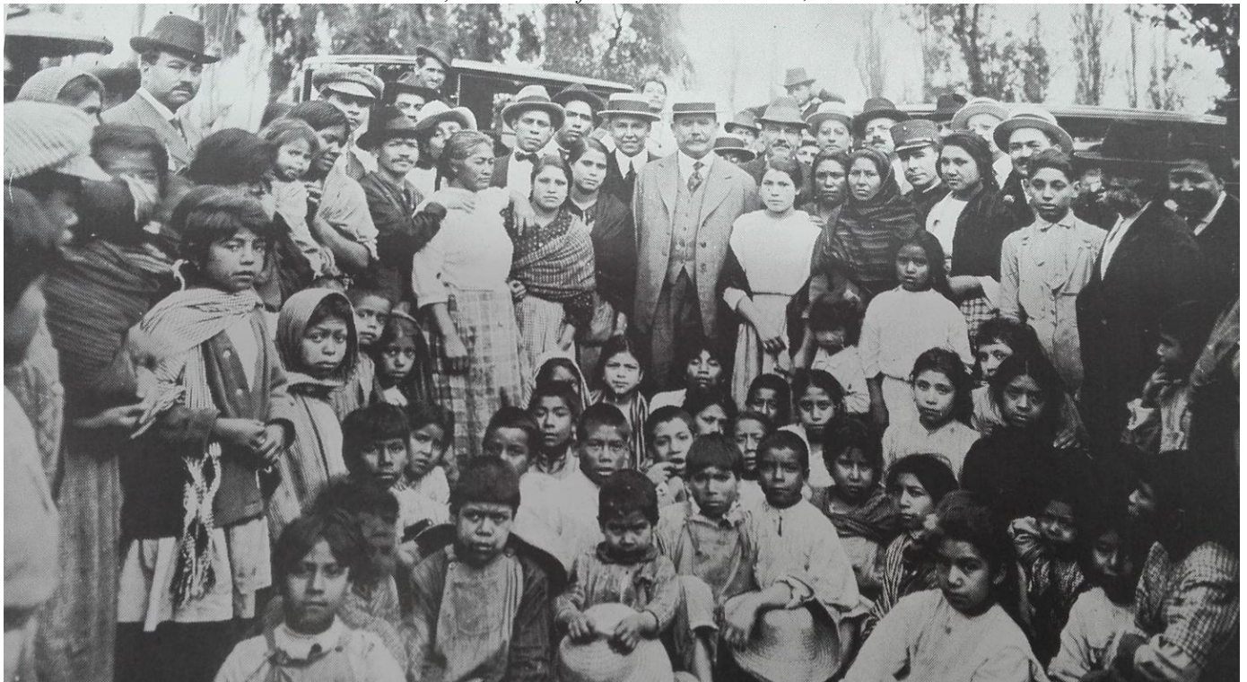
Llegada a Santa Anita, Sonora, para celebrar el primer aniversario del plan de Agua Prieta. Gustavo Casasola, Historia Gráfica de la Revolución... , v. 5.