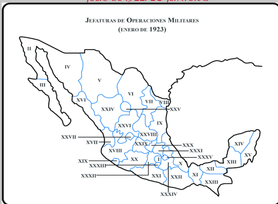
ENERO DE 1923. 35 JEFATURAS