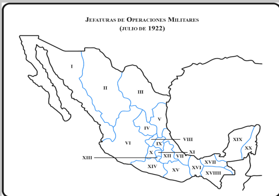
JULIO DE 1922. 20 JEFATURAS