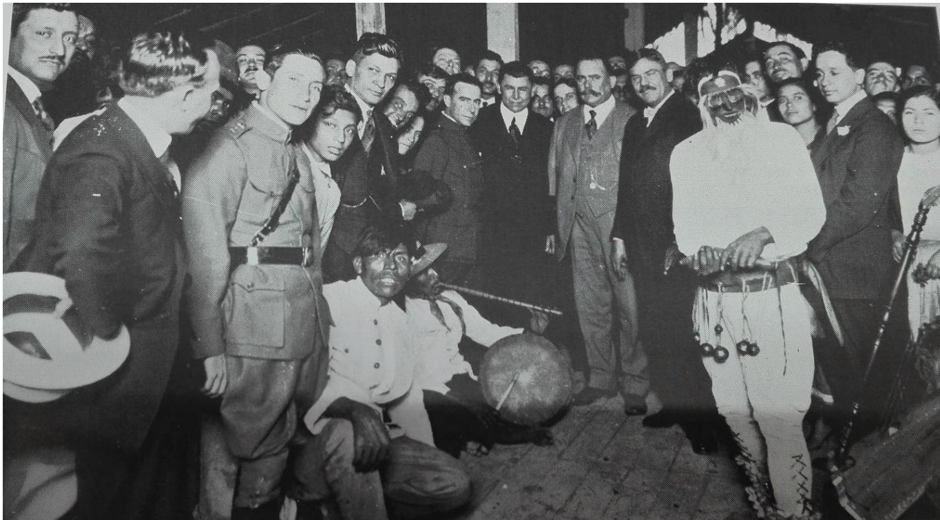
Algunos yaquis llevaron a cabo el baile de “la Pascola” y “el Venadito” durante el festejo del plan de Agua Prieta. Gustavo Casasola, Historia Gráfica de la Revolución... , v. 5.