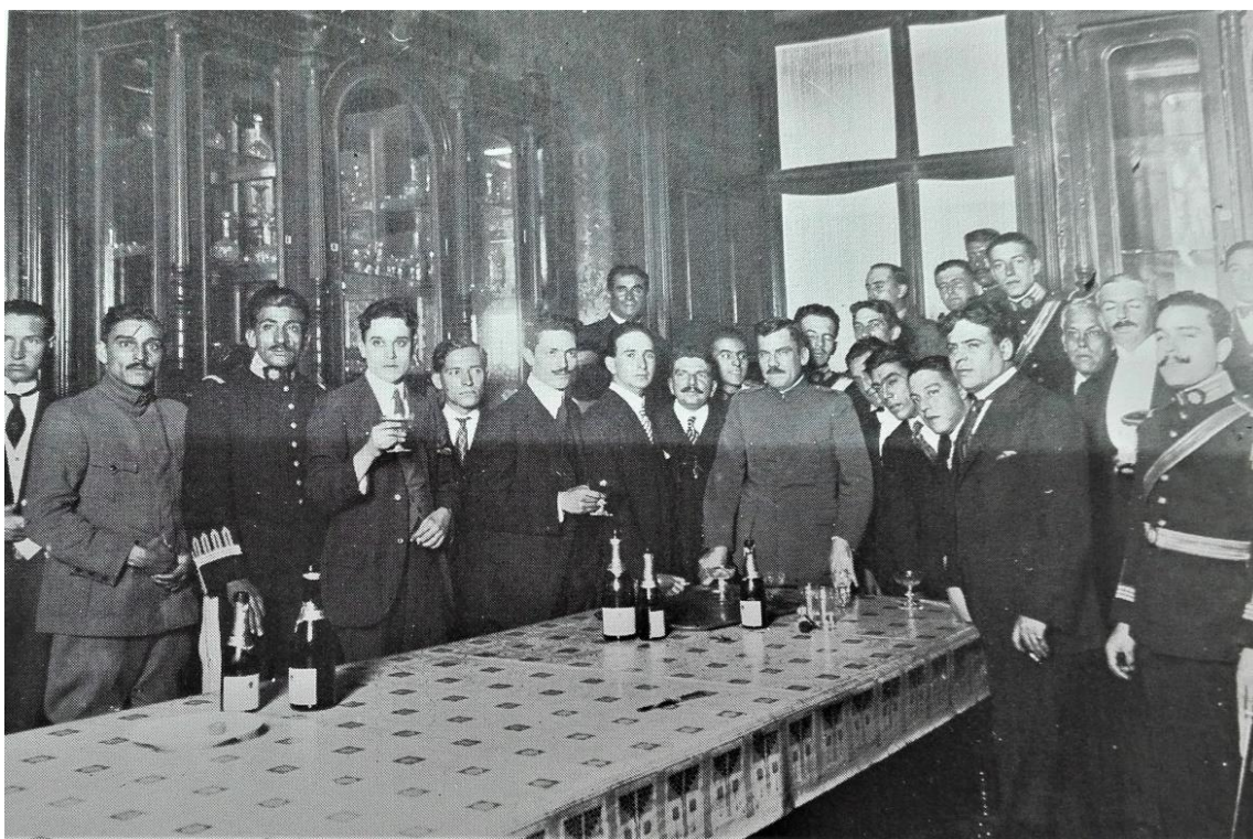
Calles en la celebración del 15 de septiembre de 1920 con varios de sus colaboradores, entre ellos el ingeniero Luis L. León y el coronel Ángel Gaxiola Gustavo Casasola, Historia Gráfica de la Revolución... , v. 4.

Durante la presidencia de Adolfo de la Huerta las labores que desarrolló la Secretaría de Guerra se centraron principalmente en el restablecimiento del orden en el país, la reducción de los efectivos, así como la organización, moralización y administración del ejército que surgió al calor de la lucha armada, 418 todas estas actividades fueron heredadas del gobierno anterior. La transición del ejército carrancista a uno nacional rebasó “los límites de la pura actividad legal. Si bien fueron expedidos numerosos decretos y circulares, ésto no bastó para su definitiva transformación. El principal problema fue el carácter personalista de un ejército formado en una lucha civil, donde los motivos de enrolamiento son distintos a aquellos que se dan para el ingreso a un ejército profesional.” 419 Por ello, la profesionalización del ejército fue lenta.