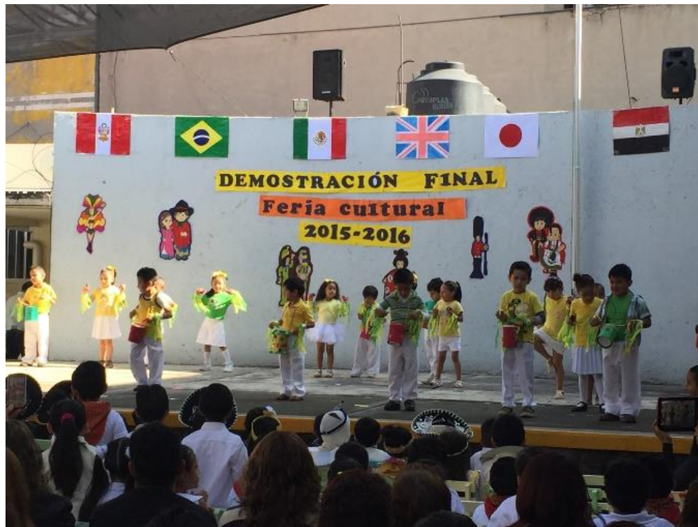
FOTO NO.11, 12,13, y 14: Evento feria cultural. Proyecto Educativo: "Sembrando en mi Jardin",2016