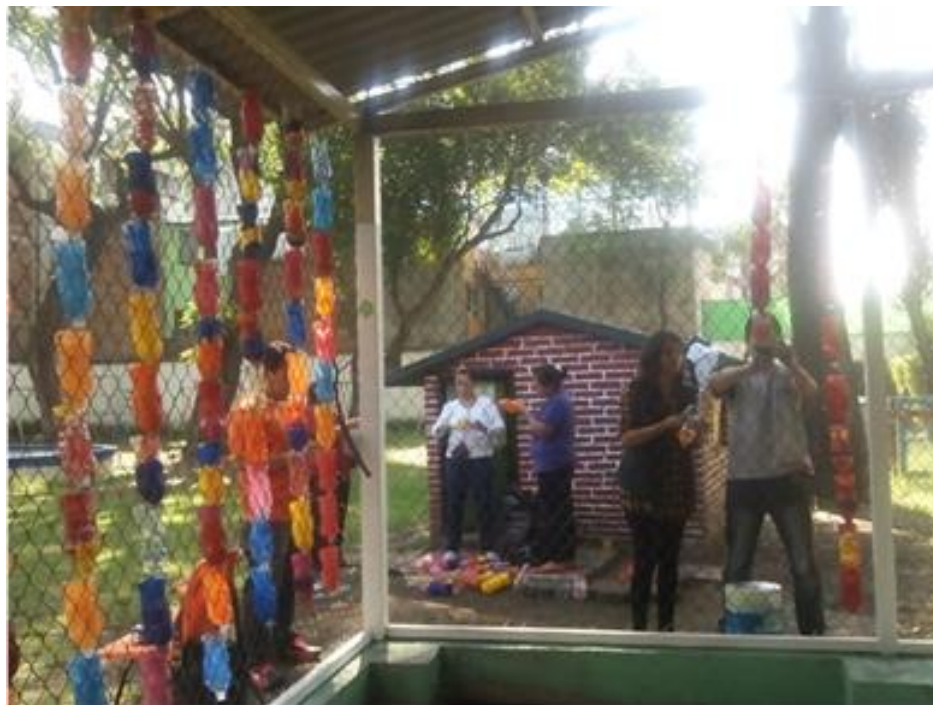
FOTO NO 2: Montaje de las botellas, Proyecto Educativo “Sembrando en mi Jardin”,2016