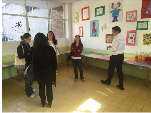
FOTO NO.8: Sistema Solar en sala de ciencias Proyecto Educativo: "Sembrando en mi Jardin",2016