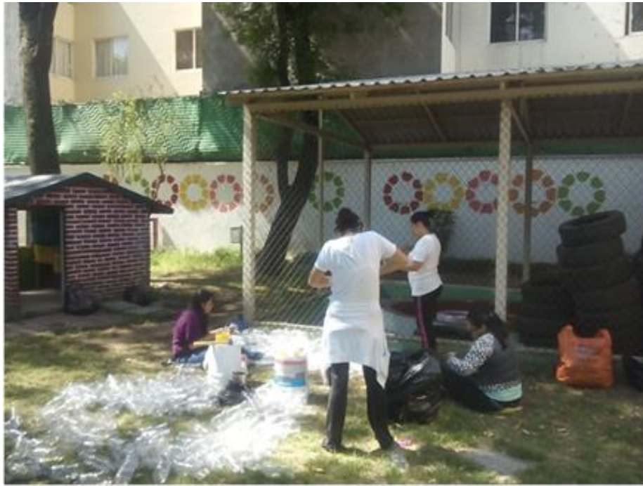
FOTO NO 1: Madres de familia ayudando a cortar botellas, proyecto educativo “Sembrando en mi Jardin”,2016