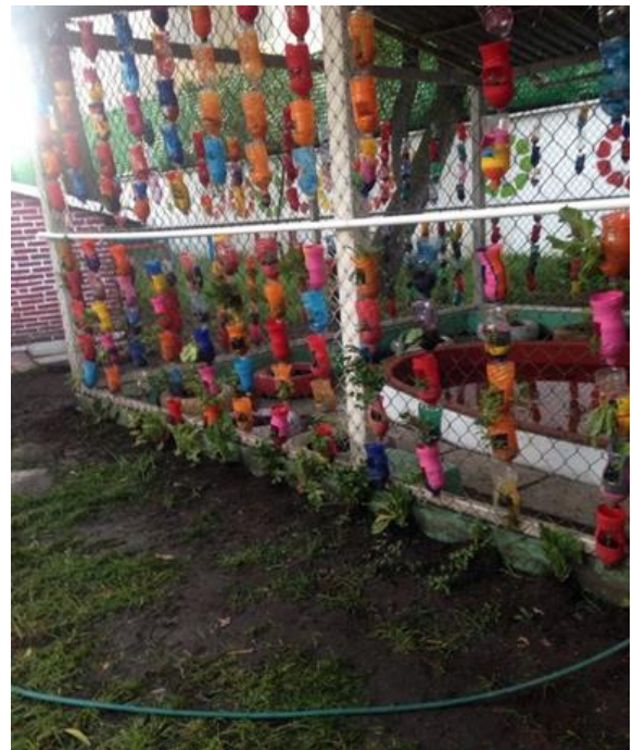
FOTO NO 4: botellas con semillas, Proyecto Educativo “Sembrando en mi