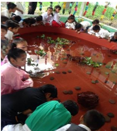
FOTO NO 5: llenado de pecera y colocación de rocas, Proyecto Educativo: “Sembrando en mi Jardín”, 2016