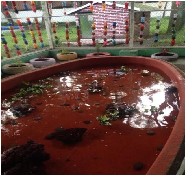
FOTO NO 3: Pecera, Proyecto Educativo “Sembrando en mi Jardín”, 2016