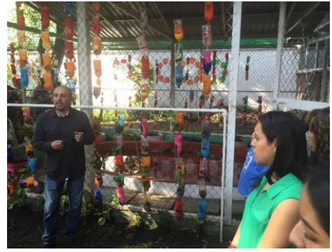
FOTO NO 6: Inauguración del invernadero Proyecto Educativo: "Sembrando en mi Jardin",2016