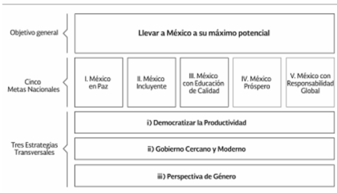
FIGURA 1.1. ESQUEMA DEL PLAN NACIONAL DE DESARROLLO 2013-2018.

Fuente: Plan Nacional De Desarrollo 2013- 2018. Gobierno de La Republica. Recuperado de: http://pnd.gob.mx/