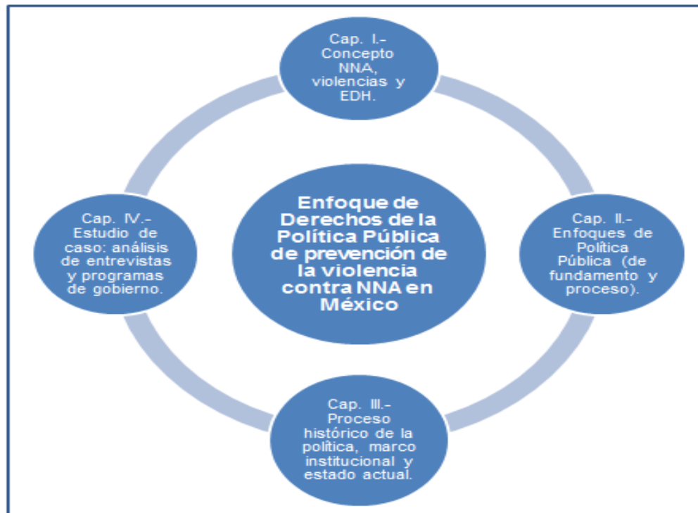
Ilustración 2_Esquema general de análisis de la tesis.

Sin duda el recorrido que se ha hecho desde el Capítulo I con la revisión de la historia del surgimiento del concepto de NNA, las conceptualizaciones de la violencia y el EDH, pasando por sus imbricaciones con las políticas públicas, y luego de éstas con los procesos de cambio, pueden parecer disímbolas y extraviadas, pero no lo son, al menos en el encuadre de esta investigación. Por un lado, la dificultad que se presentó de integrar una investigación novedosa necesitaba de la incorporación de cada una de estas piezas para armar una propuesta de presentación de marco de conocimiento y análisis para comprender las políticas públicas con EDH de prevención de la violencia contra NNA en México , y por la otra el estudio de caso que se presenta a lo largo de los dos últimos capítulos también necesitaba de una reconstrucción histórica, la revisión de su planteamiento y sus resultados preliminares para su análisis (Ilustración 2).