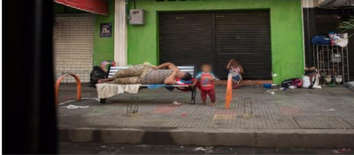
Los menores eran drogados para mantenerlos sedados durante las largas jornadas a las que eran sometidos | POR: CÉSAR GARCÍA

Por otro lado, cuando las mujeres concluyen su embarazo, en lugar de ser felices y volver a comenzar una nueva vida, el rencor recae en el bebé recién nacido, el cual, es expuesto y explotado, tal es el caso de los niños que piden limosna o venden dulces en la vía pública, se ha sabido que a estos niños se les inyecta cocaína u otra sustancia tóxica e ilegal para soportar las pesadas jornadas laborales, es notorio la calidad de vida que llevan; tiene que trabajar mientras que la madre se droga y lucra con ellos, o peor aún, estos son vendidos al mejor postor para adentrarlos a la prostitución, así como también, para extraer sus órganos vitales y posteriormente venderlos en el mercado negro.