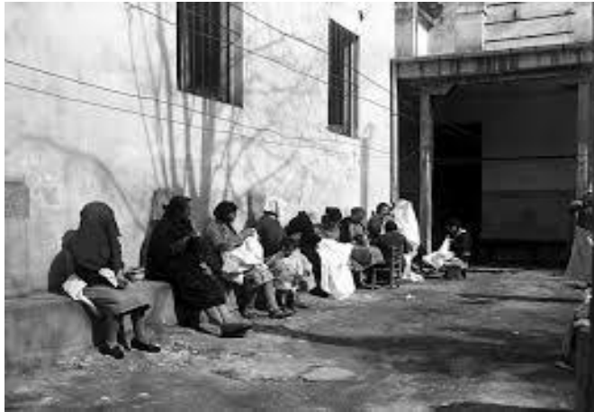
Mujeres en las Islas Marías, Fuente: El Universal.

y cinco años después comenzaría la historia de las Islas Marías donde con solo nombrar las famosas “ cuerdas ”, equivalía al exterminio, se entiende por “ cuerdas ”, a la salida de un conjunto de presos, en forma de tren, de una cárcel a otra.