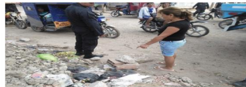
El pequeño cuerpo de unos 20 centímetros fue hallado al interior de una bolsa plástica por un reciclador que pasaba por el lugar.