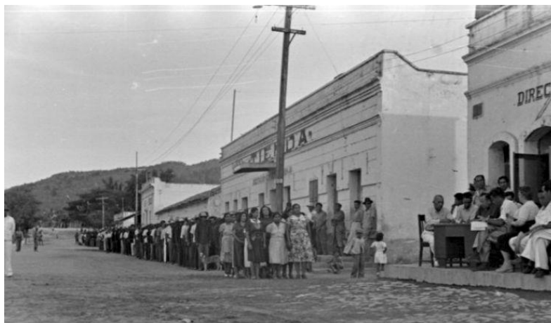
Las “ cuerdas ” 1908

Continuó el Porfiriato, y llegó el siglo XX y la materia penal, las leyes, instituciones y procedimientos, estaban ajustados a la vieja dictadura, el Código Juárez aún estaba en vigor, pero