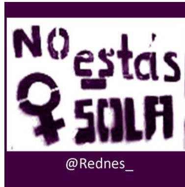
Figura 1. Fotografía de perfil de la página de Facebook de la Red No Están Solas .