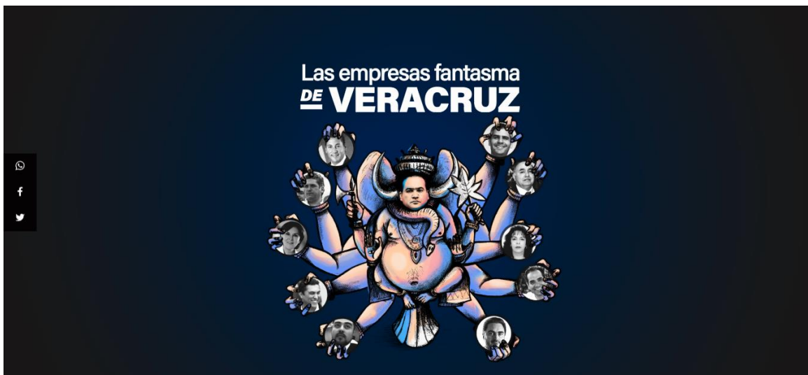
Ilustración 3: "Las empresas fantasma de Veracruz"