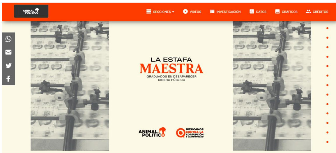
Ilustración 5: La Estafa Maestra