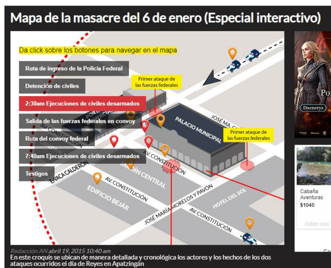
Ilustración 2: Mapa interactivo de la Masacre de Apatzingán