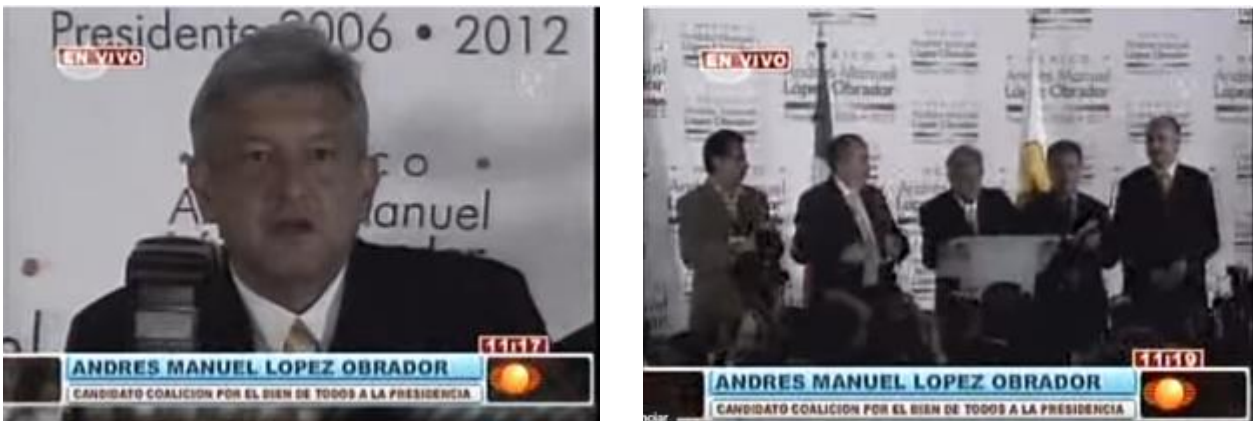
Fig. 8. Conferencia de prensa de López Obrador después del anuncio del Consejero presidente del IFE y del Presidente de la República. Mensaje de AMLO 2006 11:17 pm en https://www.youtube.com/watch?v=UUQ1j-24x1w consultado el 22/11/2016

Quiero expresar que a partir de mañana y de los días que vengan cuando se vaya confirmando este resultado voy a iniciar la convocatoria para la construcción de un acuerdo nacional, para la construcción de un pacto nacional incluyente donde estén representados los empresarios, las iglesias, integrantes de la sociedad civil, representantes de la sociedad civil, indígenas, obreros, de intelectuales, de artistas, profesionistas en general. Quiero también extender mi mano franca, siempre dije que yo no odio, soy un hombre feliz, extendiendo mi mano franca para los que considero mis adversarios nunca los he visto como enemigos voy a establecer con ellos comunicación cuando sea pertinente y vamos a poner por encima del interés particular, del interés de los partidos, el interés general, el interés del pueblo de México. Muchas gracias.