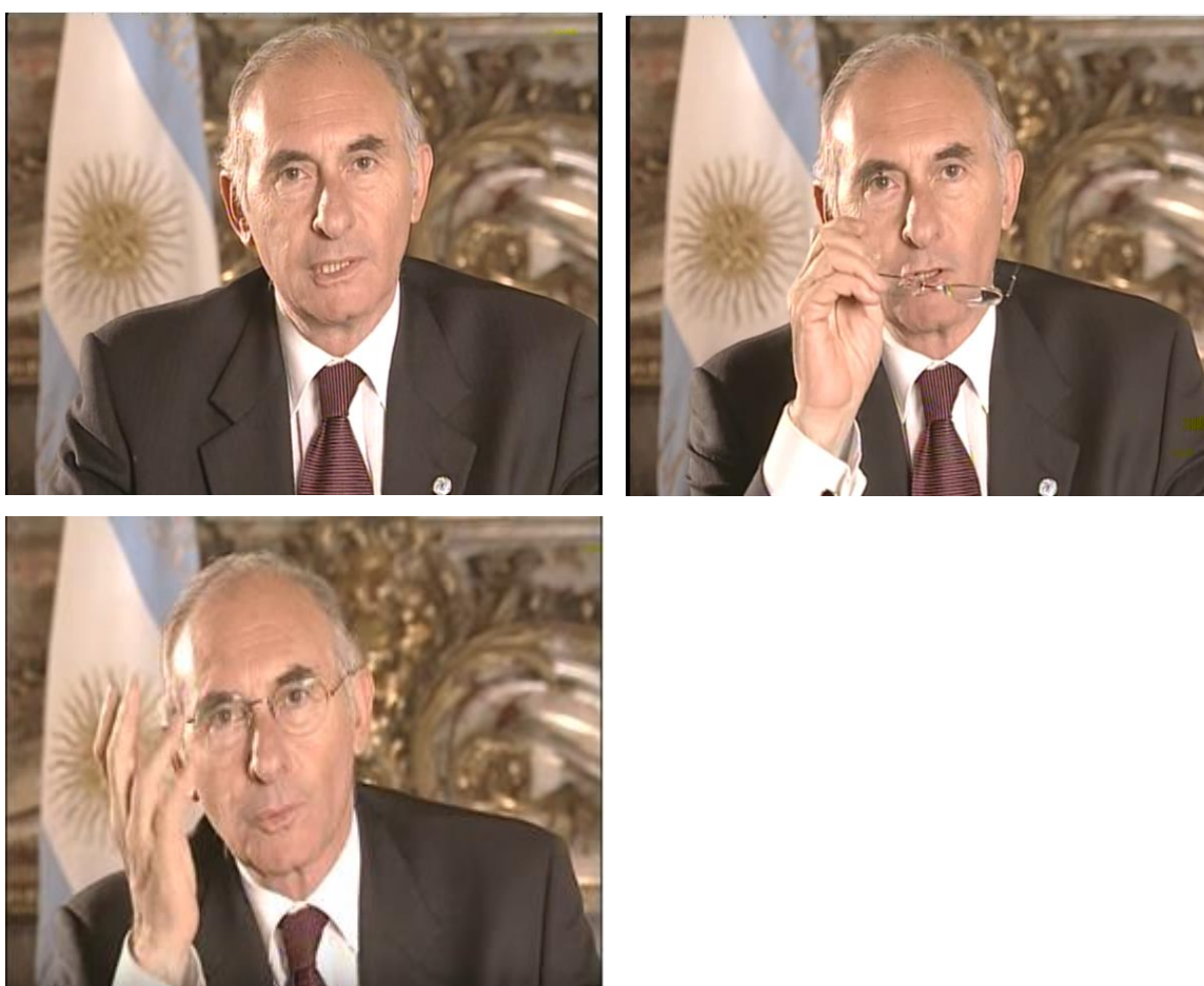
Fig 1. Declaración de Fernando De la Rúa, declaración del sitio 19/12/2001 en https://www.youtube.com/watch?v=h67HpxqQ7Hg consultado el 2/01/2016.

Cuando De la Rúa identifica en el mismo nivel a las organizaciones sociales y a los medios, da cuenta de la influencia de estos últimos en torno a la narrativa de los acontecimientos durante el “Argentinazo” y además los concibe como el canal para lograr la pacificación de las principales ciudades argentinas. Es decir, desde el poder Ejecutivo hay un reconocimiento y legitimación de la influencia de los medios de comunicación para entre otras cosas lograr el cese a los enfrentamientos entre ciudadanos y cuerpos policiales.