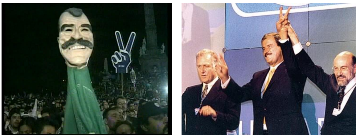
Fig 4. Imágenes del 2 de julio de 2000. Obtenida en http://footage.framepool.com/es/shot/106432463-vicente-fox-bandera-mejicana-victoria-electoral-v-sena consultado el 14/05/2017 y http://b15noticias.com.mx/la-alternancia-llego-al-pais-hace-15-anos-zedillo-admitio-la-derrota-esa-noche/ consultado el 14/05/2017.

Cabe destacar que el entonces candidato Vicente Fox se caracterizó por su uso de la comunicación política, así como de los medios de comunicación a través de spots electorales. A tal punto que el símbolo de la “v” de la victoria utilizado en la época de los sesenta y setenta por la izquierda mexicana fue convertida en el sello de la campaña política de Fox Quesada.