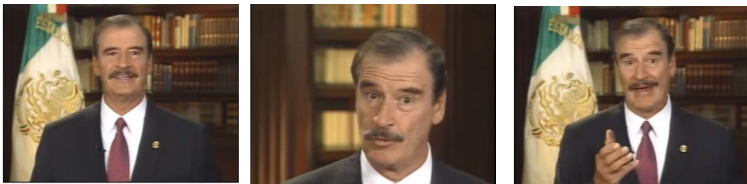
Fig 7. Imágenes del mensaje a medios del Presidente Vicente Fox Quesada. Mensaje del Presidente Fox 2 de julio (2006) en https://www.youtube.com/watch?v=beOtJDKQAV0 consultado el 18/11/2016.

El mensaje de Vicente Fox se puede dividir en cuatro partes. Estas se encuentran acentuadas en el cambio de encuadre en donde se aprecia al ahora ex presidente primero rodeado de libros, imagen que empata con las del discurso de legalidad, respeto a las instituciones y lección de civildad. Cuando llama a la espera y al respeto a los tiempos que el IFE ha fijado, se cierra la toma, para sólo concentrarse en su rostro. Nuevamente cuando habla de respeto y ciudadanía se abre el cuadro dejando entrever una bandera y una parte de la oficina presidencial