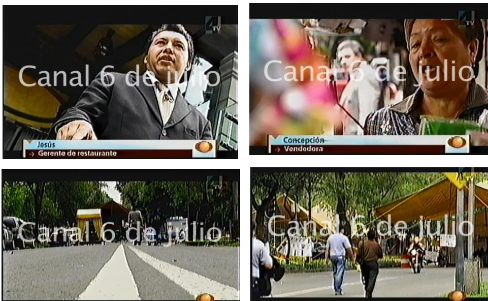
Fig 17. Imágenes de la crónica sobre los afectados por el plantón realizado en el programa Punto de Partida.

En el reportaje se habla de la invasión del espacio público. Sin embargo las afectaciones que se desarrollan son a nivel privado y en pequeñas o medianas empresas. Después de ver el reportaje da la impresión de que la Ciudad de México estaba colapsada en ese momento y que no había ninguna razón como para realizar el plantón. El problema del bloqueo se personaliza y se responsabiliza a la figura de López Obrador de las afectaciones de ese momento y además de las que pudiesen haber existido en un futuro a causa de la medida.