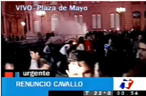
Fig. 3 Cobertura TN la noche del 19 de diciembre de 2001.

Al día siguiente, las protestas continuaron y con ellas la cobertura mediática. El 20 de diciembre de 2001, los manifestantes seguían en la Plaza de Mayo y la policía continuaba con una férrea represión que causó la muerte de 5 personas. Al respecto, el espacio noticioso que presuntamente no paró en toda la noche, comentaba lo siguiente en la tarde del 20 de diciembre 104 :