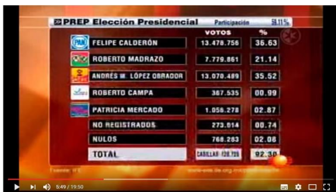
Fig. 11. Imagen obtenida de la entrevista entre Carlos Loret de Mola y Andrés Manuel López Obrador.

Igualmente en las imágenes podemos encontrar que a la hora de analizar los resultados que hasta ese momento habían sido cuantificados en el PREP, el orden en la presentación de los candidatos sitúa al aspirante presidencial de la Coalición por el bien de todos cómo si llevaría un porcentaje inferior que el de Roberto Madrazo, representante del PRI. Siendo que el candidato priísta numéricamente iba en tercer lugar y en la imagen se percibe cómo si estuviera en segundo 138 .