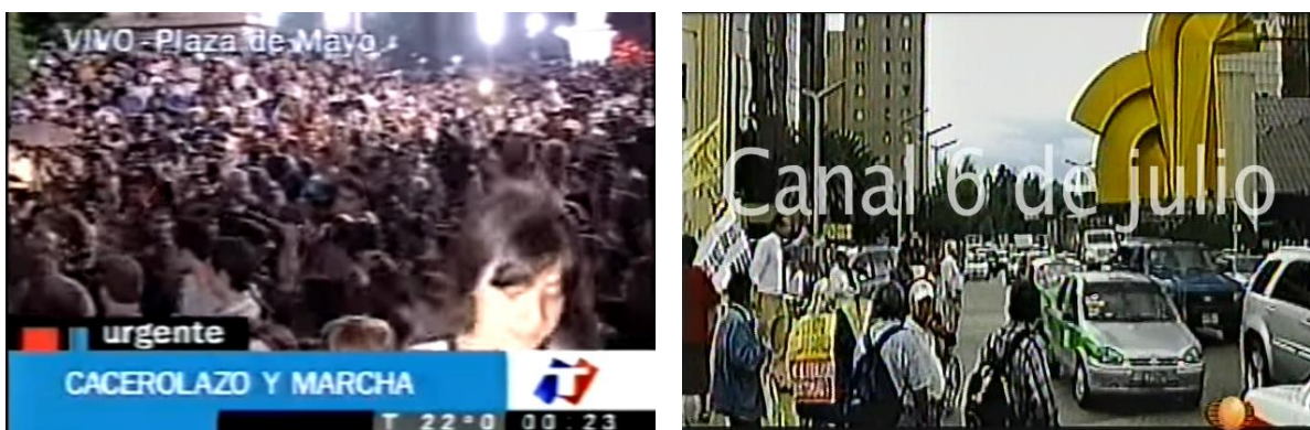
Fig. 18 Comparativo de imágenes de la toma del espacio público en el caso de Buenos Aires (izquierda) y Ciudad de México (derecha) 151 .

Sin ser definitorias, las coberturas mediáticas merman o coadyuvan a la legitimidad social que puede llegar a tener la toma del espacio público en forma de protesta. La narrativa, los encuadres y los comentarios a propósito de las imágenes, van construyendo una realidad que para quién no tiene la posibilidad de experimentar el hecho desde su perspectiva, es una verdad casi absoluta.