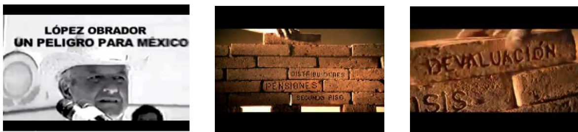
Fig 5. Imágenes del spot “peligro para México” del Partido Acción Nacional. Obtenidas en http://www.desdeabajo.org.mx/wordpress/locutor-de-un-peligro-para-mexico-ahora-apoya-a-amlo/ y https://www.youtube.com/watch?v=zXCU0HDJ7Wk consultado el 14/05/2017.

En el caso de 2006, la relación entre grupos empresariales y el Grupo Televisa se hizo evidente cuando Televisa le vendió espacios televisivos a dichos grupos empresariales para iniciar lo que muchos politólogos caracterizan como la “guerra sucia” 131 en contra de López Obrador a través de su espacio televisivo.