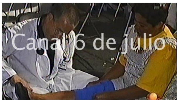
Fig. 16 Imágenes del reportaje sobre el plantón transmitido en el programa punto de partida.

Programa Punto de Partida, Reportaje crónicas del plantón, en Archivo Canal Seis de Julio, consultado el 13/12/2016