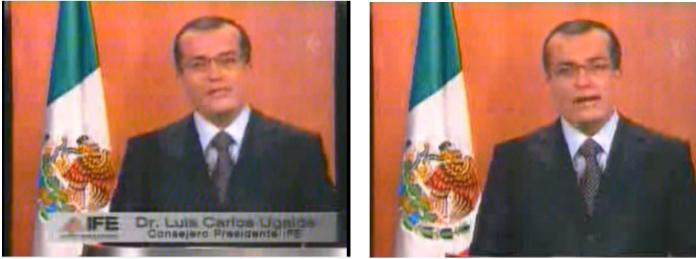
Fig. 6 Imágenes del mensaje del Dr. Luis Carlos Ugalde. Mensaje de Luis Carlos Ugalde (2 de julio 2006) en https://www.youtube.com/watch?v=l8nn1vmaBiQ consultado el 18/11/2016 .

Inmediatamente después, el residente de la República, Vicente Fox Quesada también emitió un mensaje a la nación: