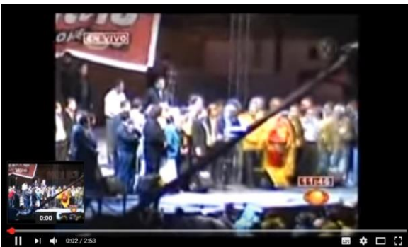
Fig. 9. Inicio del mensaje, único encuadre abierto del mensaje. Sólo se enfoca al templete no se incluye en la toma a la gente que estaba en el zócalo.

Mensaje de AMLO en el Zócalo en https://www.youtube.com/watch?v=jPtKiq5yTMQ Consultado el 21/11/2016