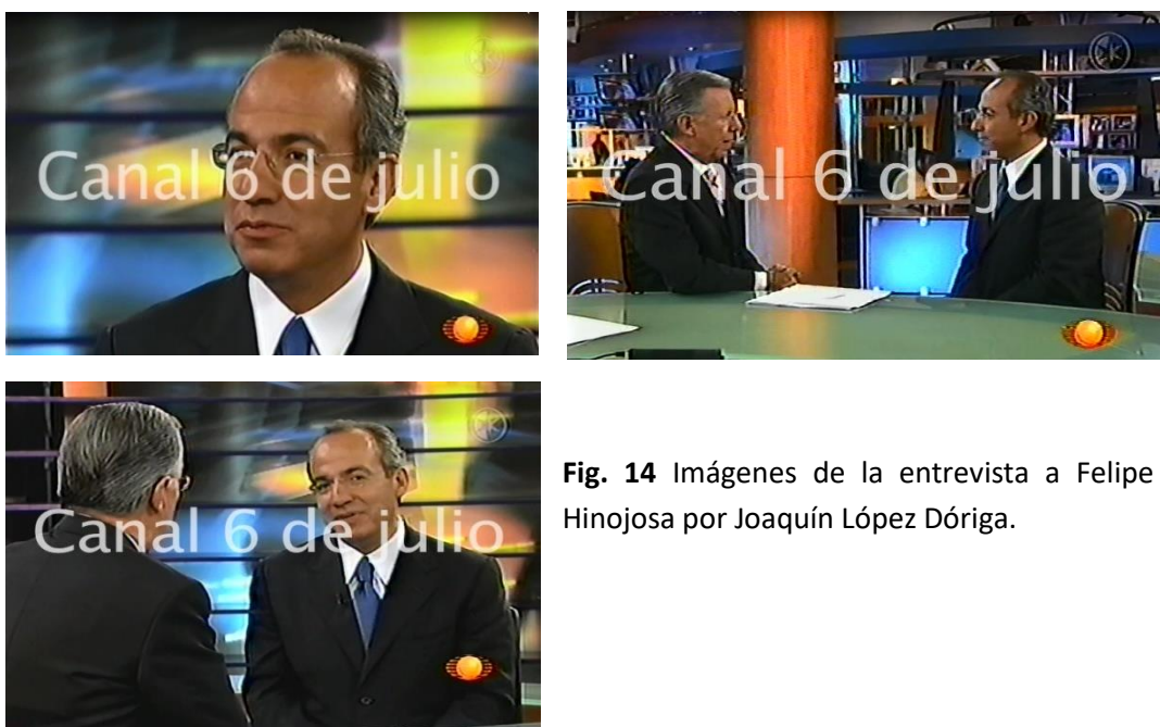
Fig. 14 Imágenes de la entrevista a Felipe Calderón Hinojosa por Joaquín López Dóriga.

Archivo 6 de julio, Fragmento Entrevista Joaquín López Dóriga a Felipe Calderón Hinojosa, consultado el 13/12/2016.