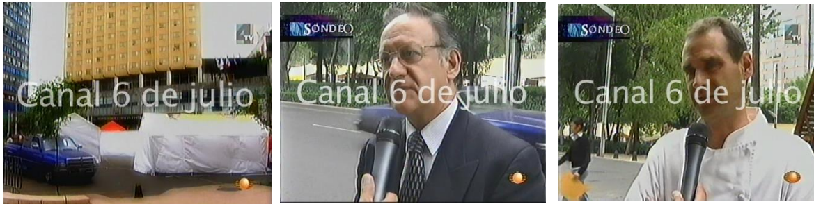
Fig. 15 Personas entrevistadas durante reportaje de “Alebrijes águila o Sol”

Cómo se puede apreciar, el reportaje está enfocado a hablar de las afectaciones económicas y, sobre todo, a generar escenarios de catástrofe económica para la ciudad y lo trascienden hasta un terreno nacional. Es innegable que por el plantón hubo afectaciones principalmente de movilidad y económicas. Sin embargo, el reportaje presenta un escenario desproporcionado y la información que da a conocer es a partir de proyecciones. El uso constante de la expresión “de continuar así” hace evidente la presión por parte de los periodistas por obligar a una acción en contra del plantón.