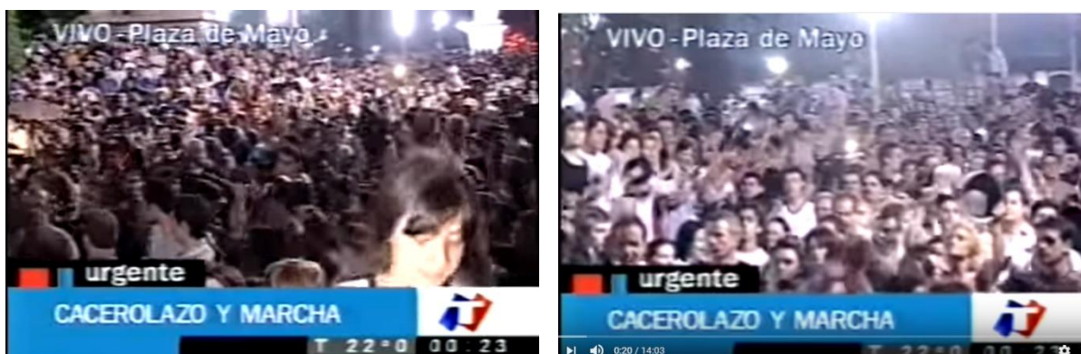
Fig 2. Imágenes de la cobertura realizada por Todo Noticias de la manifestación en Plaza de Mayo, en https://www.youtube.com/watch?v=kR0QpTZ6W34&t=602s consultado el 2/01/2016.

La toma del espacio público durante el “argentinazo” constituyó un reclamo focalizado contra el modelo económico que hasta ese momento se había llevado. Pero el debate sobre qué hacer, qué rumbo seguir y, sobre todo, a quién culpar se dio en los foros de televisión del noticiero perteneciente al Grupo de Medios más importante de Argentina. El cuál se había beneficiado enormemente del modelo implantado por Carlos Saúl Menem en la década anterior.