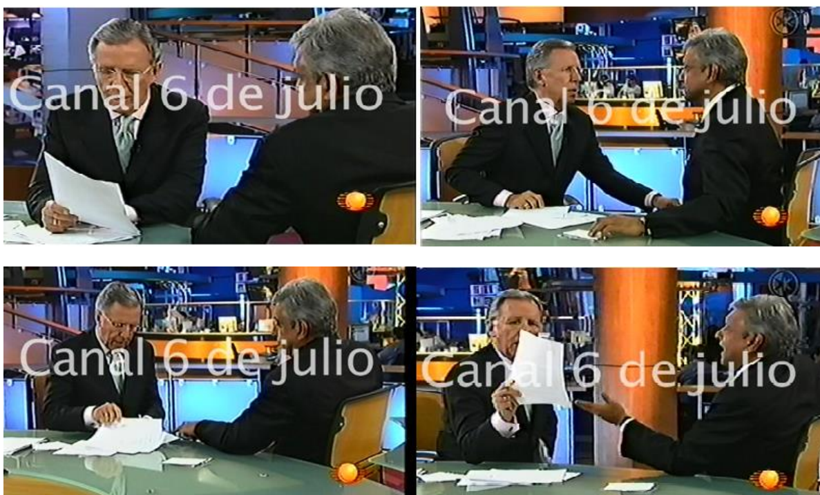
Fig. 13 Entrevista a Andrés Manuel López Obrador por Joaquín López Dóriga.

Archivo 6 de Julio, Entrevista Joaquín López Dóriga a Andrés Manuel López Obrador, Transmitida el 11 de julio de 2006, Consultada el 13/12/2016.