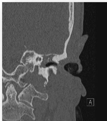
Fig. 2: Dehiscencia de canal de Falopio a nivel de ganglio geniculado