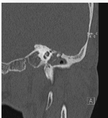
Fig. 3: Dehiscencia de canal de Falopio a nivel de porción timpánica