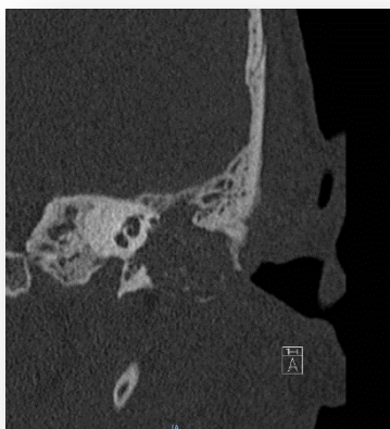
Fig. 1: Tumoración de oído medio y Dehiscencia de canal de Falopio