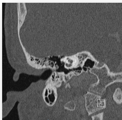
Fig. 4: Dehiscencia de canal de Falopio a nivel de región perigenicular