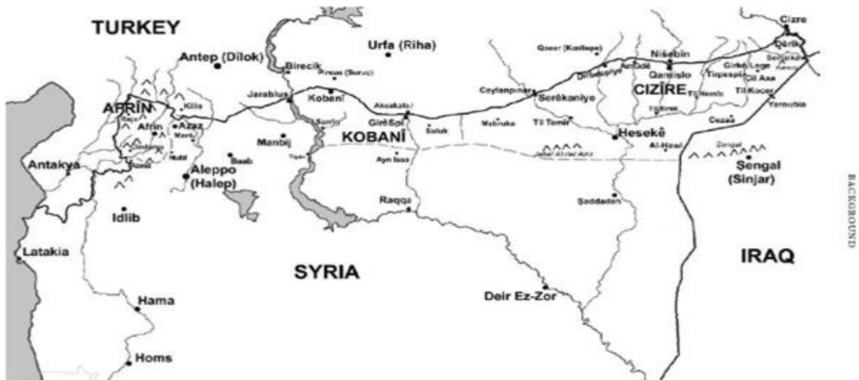
Figure 1.1 Rojava's three cantons: Afrin, Kobani, and Cizirê

llega hasta el río Tigris en frontera con Iraq, el cantón de en medio es Kobani y el de la extrema izquierda, en la frontera con Turquía es Afrîn.