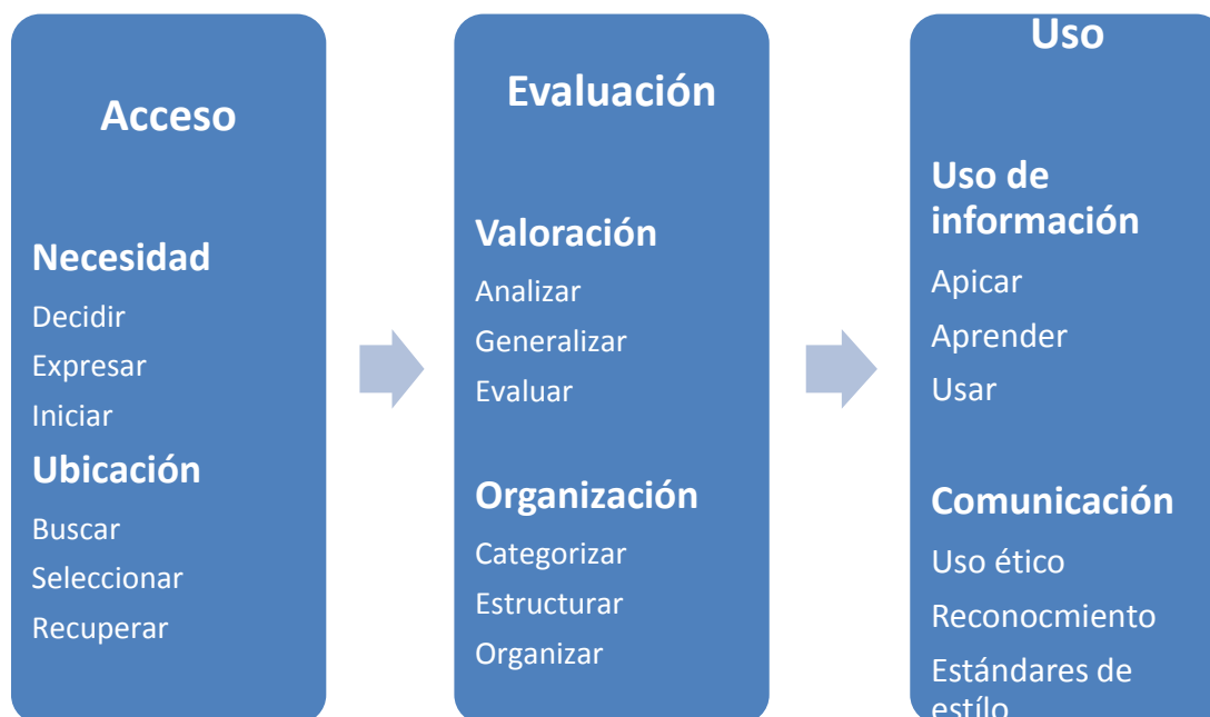
Fig. 2. "Pilares de la AI"

Los indicadores, de igual manera se mantienen bastante generales.