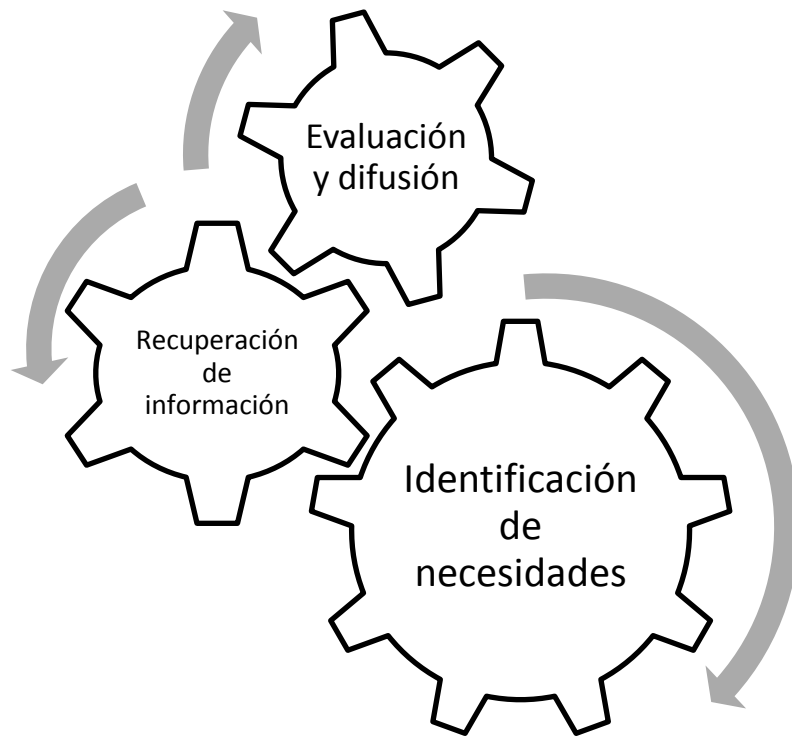
Fig. 4.- Relación entre los ejes de la AI