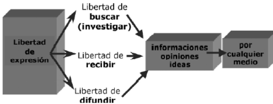
Fig 1. "Dimensiones de la libertad de expresión" Fuente: López S. El acceso a la información como un derecho fundamental: la reforma al artículo 6° de la Constitución mexicana.

Así, el derecho a la información queda consagrado entre los derechos fundamentales del hombre, sin embargo, aún queda un tramo que analizar para poder insertar a la alfabetización informacional dentro del esquema de los derechos humanos.