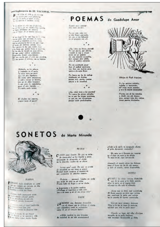
Imagen 6. Ejemplo de imágenes como ilustración de textos en la Revista Mexicana de Cultura .