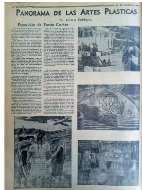
Imagen 5. Ejemplo de una imagen como muestra de obra artística en la Revista Mexicana de Cultura .