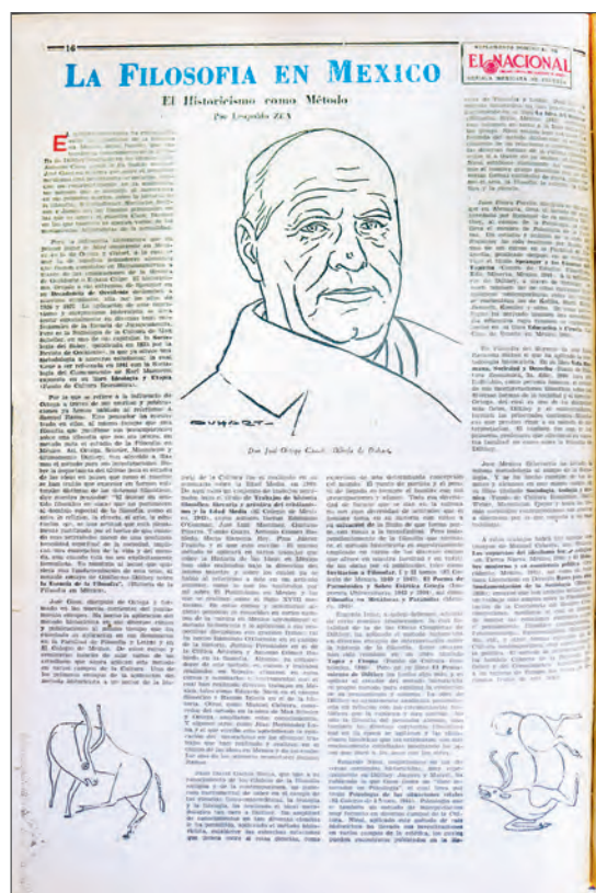
Imagen 7. Ejemplos de imágenes como ornamentos en la Revista Mexicana de Cultura .

las de inspiración europea, lo que es una muestra más de la colaboración de mexicanos y españoles en el suplemento.