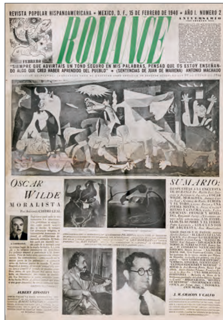
Imagen 2. Comparación de una página de Romance y una de la Revista Mexicana de Cultura .