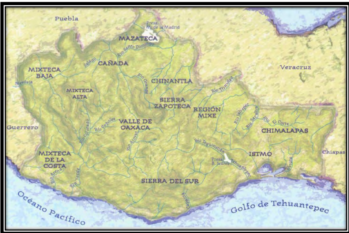
MAPA 1: Ubicación de la Región Mixe en el Estado de Oaxaca. Fuente: (Barabas, Bartolomé, Maldonado, 2004)

La región está constituida por 19 municipios de los 570 que tiene el estado de Oaxaca, el distrito Mixe tiene 17 de ellos, los dos municipios restantes son: San Juan Guichicovi que pertenece al distrito de Juchitán y San Juan Juquila perteneciente al distrito de Yautepec. El distrito Mixe, con sus 17 municipios tiene una superficie de 4,928.49 km 2 ; sin embargo, a pesar de que el Estado ha sabido fragmentar a los pueblos convirtiendo a sus comunidades en municipios e incorporando algunos municipios a otros distritos, ha sido imposible desarticular el sentido de pertenencia a un territorio por parte de sus habitantes y a una cultura compartida que se organiza bajo usos y costumbres, teniendo como autoridad a la asamblea comunitaria que es la que decide el rumbo de la comunidad.