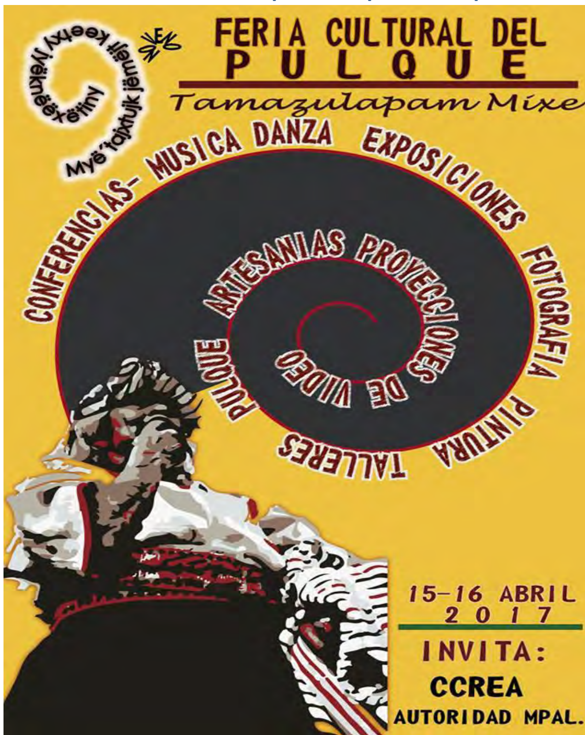
Imagen: Cartel de la última feria realizada, en la parte inferior, una abuelita vestida con el traje de Tamazulápam.