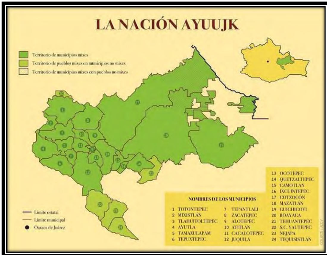
MAPA 2: Ubicación de la región Ayuuik en el Estado de Oaxaca, 2010.

La región mixe está dividida a grosso modo en tres zonas climáticas: zona alta, zona media y zona baja, uno de los municipios perteneciente a la parte alta es: Tamazulápam del Espíritu Santo Mixe, ubicado al noroeste de Oaxaca, colindando al norte con Santa María Tlahuitoltepec, al sur y oeste con San Pedro y San Pablo Ayutla, al este con Asunción Cacalotepec; todos estos municipios mixes.