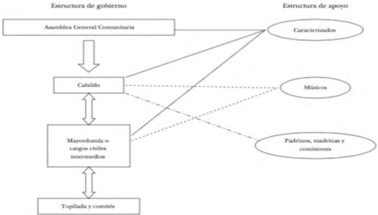
Imagen 2: Ámbitos que dan forma a la estructura de los cargos. Fuente (Valdivia, 2010).