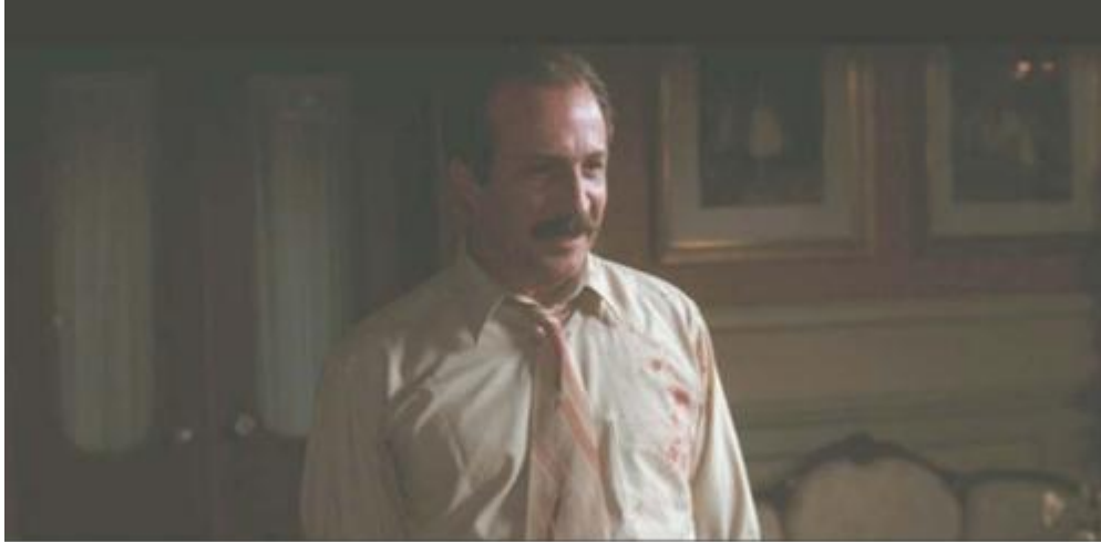
“Tan lista que pareces a veces y luego te sale lo mujer” (45’28”)

El filme posee muchos ejemplos de diálogos que contienen frases machistas que violentan la condición femenina solo por el hecho de ser mujer.