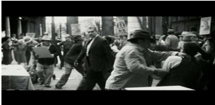
“El robo de las urnas donde perdía Fito”. 49’:35”

Una muestra de estas escenas es la que describe el robo de urnas electorales en el que el personaje de Andrés es partícipe, colaborando con la corrupción política que se relata en el filme.