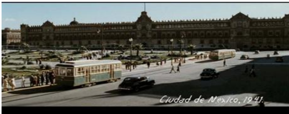
El Zócalo de la Cd. de México transformado para la recreación del filme. (49’:41”)

En la Cd. de México, se invirtió en transformar la plancha del zócalo y se filmó en el emblemático Palacio de Bellas Artes.