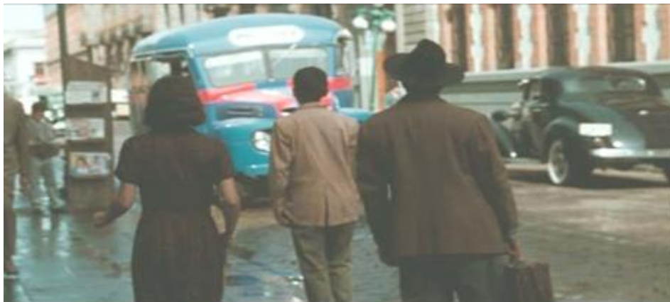
Las calles de Puebla en 1936. (42'05")

Otro recurso cinematográfico para la construcción de la identidad del personaje de Catalina es el espacio físico en el que se desarrolla la trama, si bien ya en capítulos anteriores se ha descrito al importancia del contexto socio-histórico, la representación en la pantalla de los lugares completan la visión de las transformaciones del personaje.