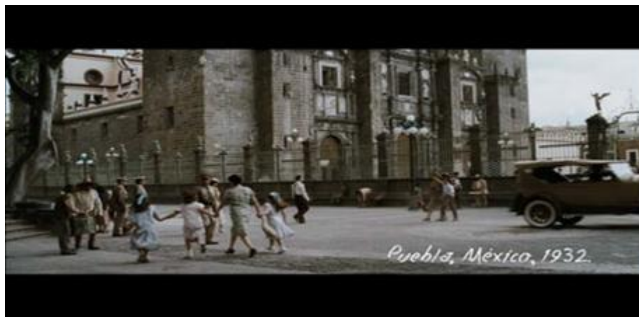
Ambientación de la catedral de Puebla, en 1932 (45”)

En el filme, se recrean los años treinta y cuarenta del siglo XX, se aprecia la ambientación de la época de 1934 a 1945 no solo con vestuario, maquillaje, utilería, si no que la escenografía y las locaciones presentan lugares como las calles de Puebla, su plaza principal, las casonas y edificios de provincia, además de sitios emblemáticos de la ciudad de México como lo son el Palacio de Bellas Artes y la Plaza de la Constitución.