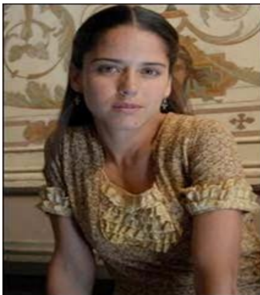
Catalina Guzmán representada por la actriz Ana Claudia Talancón

Mediante la observación de este contexto socio-histórico, y la visión de los autores se pretende enriquecer la investigación acerca de la construcción de la identidad de Catalina Guzmán, personaje principal femenino del filme Arráncame la vida , además de considerar en hacer un breve recorrido por la historia de la emancipación femenina en México y la importancia que significa esto, cimiento de las condiciones actuales de las mujeres mexicanas de hoy.