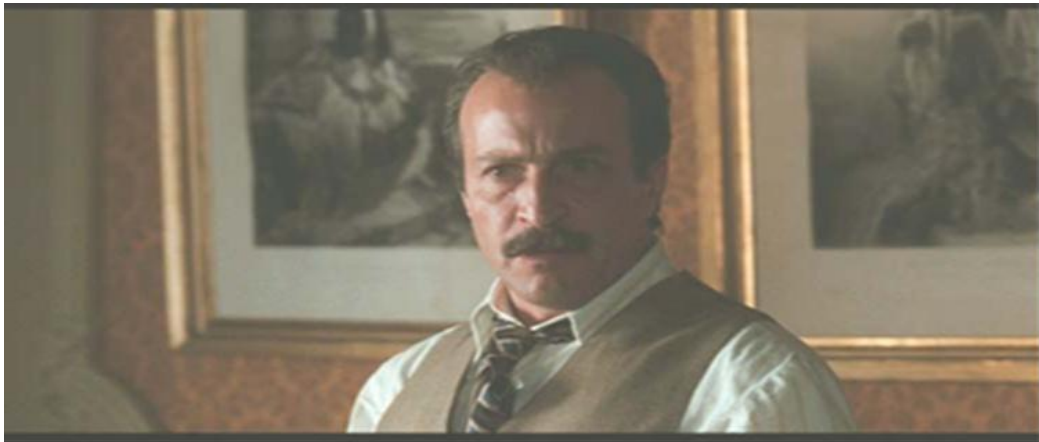
“Dame ideas que para eso te tengo” (40’47”)

Siguiendo con la descripción de personaje erótico, Catalina es fuerte, es capaz de tomar decisiones que la afectan a ella y a otros, aprende a hacer política y usar a los demás se hace necesaria para Andrés y logra que este le dé mayor valor a su opinión.