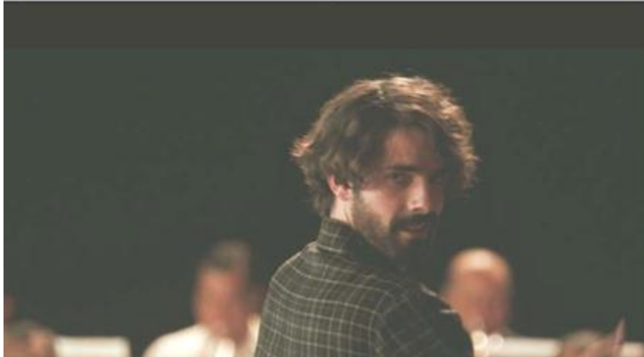
“Me volví infiel, mucho antes de tocar a Carlos Vives” (54’59”)

En el contexto histórico del país, México como país moderno, vio reflejado en la cultura, la sociedad, la economía, la política y en todos los estratos del país, el interés por el individuo y no en la sociedad, se buscaban los beneficios particulares, sobre todo de la clase burguesa, en la que, en algunos casos, la mujer era un “adorno educado” de los hombres, de su familia, de su casa. Es posible visualizar que estos elementos se transfieren del siglo XIX al XX debido al modelo económico que se sigue y que renueva sus formas de convivencia social, cultural, de roles, estereotipos e identidad