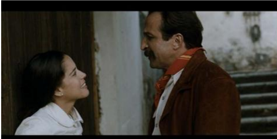
“Todo se aprende, ya verás” (16’12”)

Ya para la mitad del siglo XX la situación de la mujer se vuelve crítica en un contexto social y político que al mismo tiempo la impulsa para buscar y reclamar sus derechos naturales, también la sigue conservando bajo la sombra del varón. Además, la mujer es enjuiciada cuando buscaba hacer alguna actividad diferente al ámbito hogareño y “descuidar” las labores “propias de una mujer”.