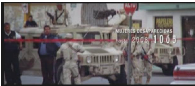
El ejército en las Calles de Ciudad Juárez.

ejemplo, los asesinatos de mujeres, ha extendido la criminalización a otros círculos de la población.