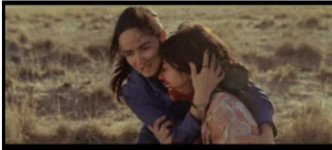
Blanca persigue a los violadores y conforta a la víctima.

Las injusticias que Blanca observa la obligan a cambiar su actitud de total rectitud y a usar la misma ley contra quienes desean eliminarla. Por ejemplo, cuando Blanca va a patrullar el desierto y nota que un auto sospechoso está a medio camino, y con sus binoculares observa que dos hombres están violando a una joven, ella no espera la llegada de otro compañero para llegar a la escena, sino que toma la iniciativa y rescata a la víctima. Ella decide sacar su pistola y empieza a disparar. Esta acción refleja que Blanca se da cuenta de que para enfrentarse contra esta sociedad tan agresiva, necesitará tomar sus propias decisiones y no esperar las órdenes de sus superiores.