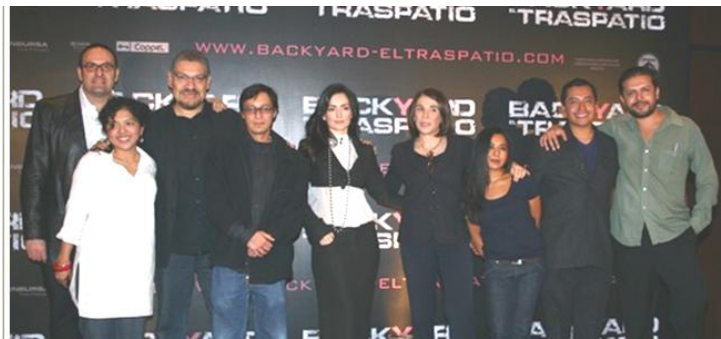
Elenco de la película El traspatio .

Por su parte, Sabina Berman quería que este film se realizara porque da la impresión de que las autoridades tratan de ocultar o disminuir la gravedad del problema. Así lo explica en una entrevista con CIO Noticias: —El gobierno no hace nada. Y si la sociedad no hace nada, la sociedad se acostumbra a que sucesos tan atroces se puedan distraer en otras cosas, y se puedan guardar debajo del tapete. 14