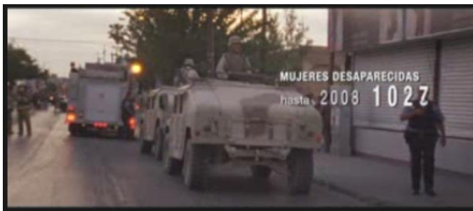
El ejército recorriendo las calles de Ciudad Juárez.

La declaración de guerra a los cárteles del narcotráfico hecha por Felipe Calderón a principios de su sexenio está dejando huellas imborrables en la sociedad juarense. Con una economía debilitada, un éxodo interminable de expulsados y miles de víctimas de la violencia, la inseguridad no es una mera percepción social, sino una realidad, como reflejan los miles de asesinatos que se han presentado en estos años de guerra contra el narco.