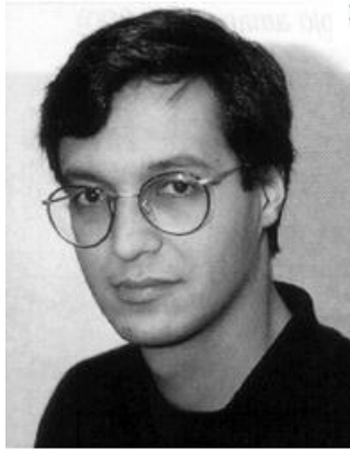
Carlos Carrera Director.

Había leído sobre las mujeres asesinadas. Entonces me llamaron la atención los mecanismos que rodeaban el fenómeno: de indiferencia e impunidad, contando a la sociedad volteando hacia otra parte, hartos de la tensión de afuera hacia eso. Hablé con las chicas de las maquilas, policías, con activistas de derechos humanos. 2