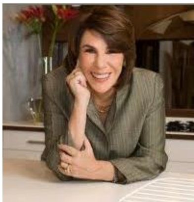
Sabina Berman Escritora

El guión de la película fue escrito por Sabina Berman Goldberg, quien nació en 1955 en la Ciudad de México, donde actualmente reside. Escritora, periodista, ensayista, dramaturga, narradora, poeta, cuentista, directora de teatro y cine. Mexicana de origen judío. Estudió psicología y letras mexicanas en la Universidad Iberoamericana. Su obra es muy extensa y se caracteriza por un profundo sentido crítico de la sociedad, que en ocasiones llega a ser ácido y transgresor. Aborda principalmente el tema de la inclinación del hombre por la dominación y el abuso, en sus diferentes formas: el autoritarismo, la violencia, la discriminación y la falta de armonía humana. En su estilo se destacan como constantes el humor negro, la ironía, la desconfianza ante todo discurso oficial, la subversión y la necesidad de rebasar los límites sexuales, teatrales e incluso verbales.