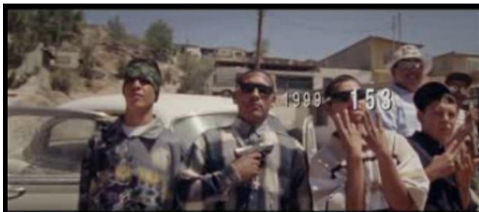
Jóvenes armados en Ciudad Juárez.

La declaración de guerra a los cárteles del narcotráfico hecha por Felipe Calderón a principios de su sexenio está dejando huellas imborrables en la sociedad juarense. Con una economía debilitada, un éxodo interminable de expulsados y miles de víctimas de la violencia, la inseguridad no es una mera percepción social, sino una realidad, como reflejan los miles de asesinatos que se han presentado en estos años de guerra contra el narco.