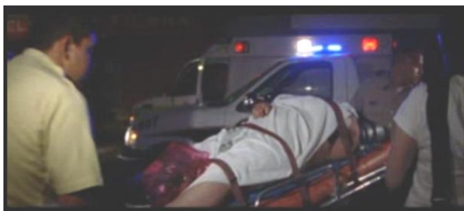
Ciudad Juárez reflejo constante de violencia.

la tragedia humana de años recientes. Sumergida en el embate doble del combate al narcotráfico y la recesión económica mundial, la ciudad cambia radicalmente su forma de vida. Hoy Juárez exuda miedo y una prueba de ello es el abandono de la vida pública, sobre todo en las noches.