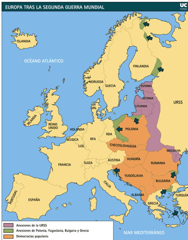
Figura 2.1 Europa tras la Segunda Guerra Mundial. Consultado el 24 de junio de 2015 en http://ocw.unican.es/ciencias-sociales-y-juridicas/integracion-economica-europea/material-de-clase-1/modulo-2/europa-despues-de-la-segunda-guerra-mundial

Posterior a este acontecimiento, los países europeos estaban muy distanciados unos de otros dados los resentimientos y la desconfianza que nacieron como consecuencia natural al conflicto en el que habían sido partícipes, esto dificultaba muchísimo la reconciliación de las naciones. Por tal motivo el ministro de asuntos exteriores de la República Francesa Robert Schuman apoyó con determinación la creación de la República Federal de Alemania o mejor conocida como