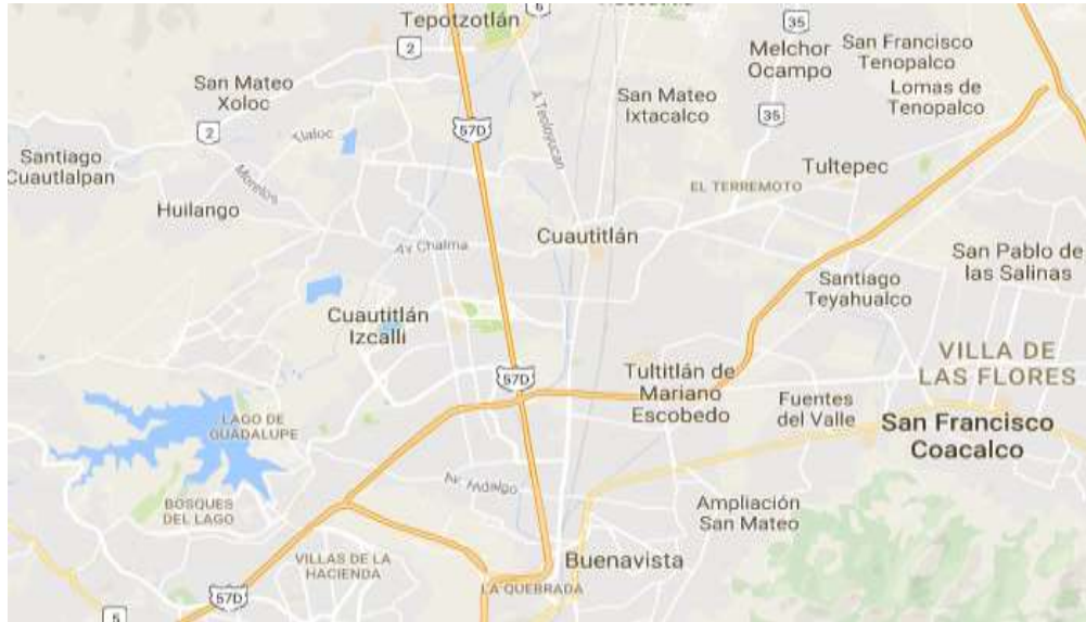
Fig. 1. Ubicación del lugar de residencia de la participante