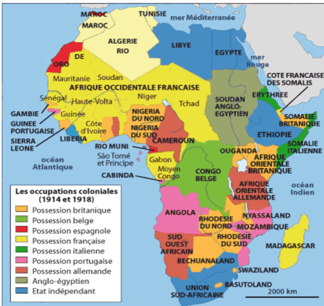
Mapa 1: La Federación del África Occidental Francesa (AOF)