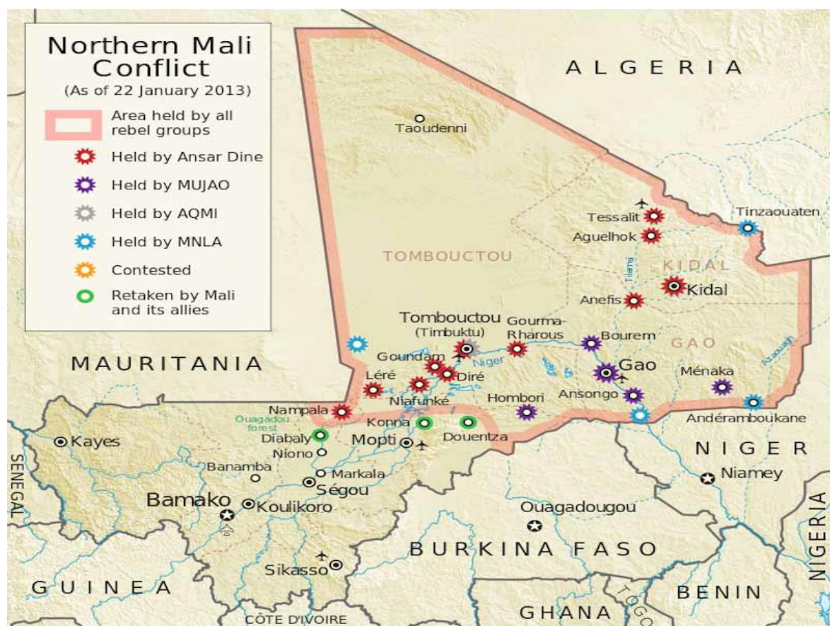
Mapa 4: Principales puntos de conflicto en Malí