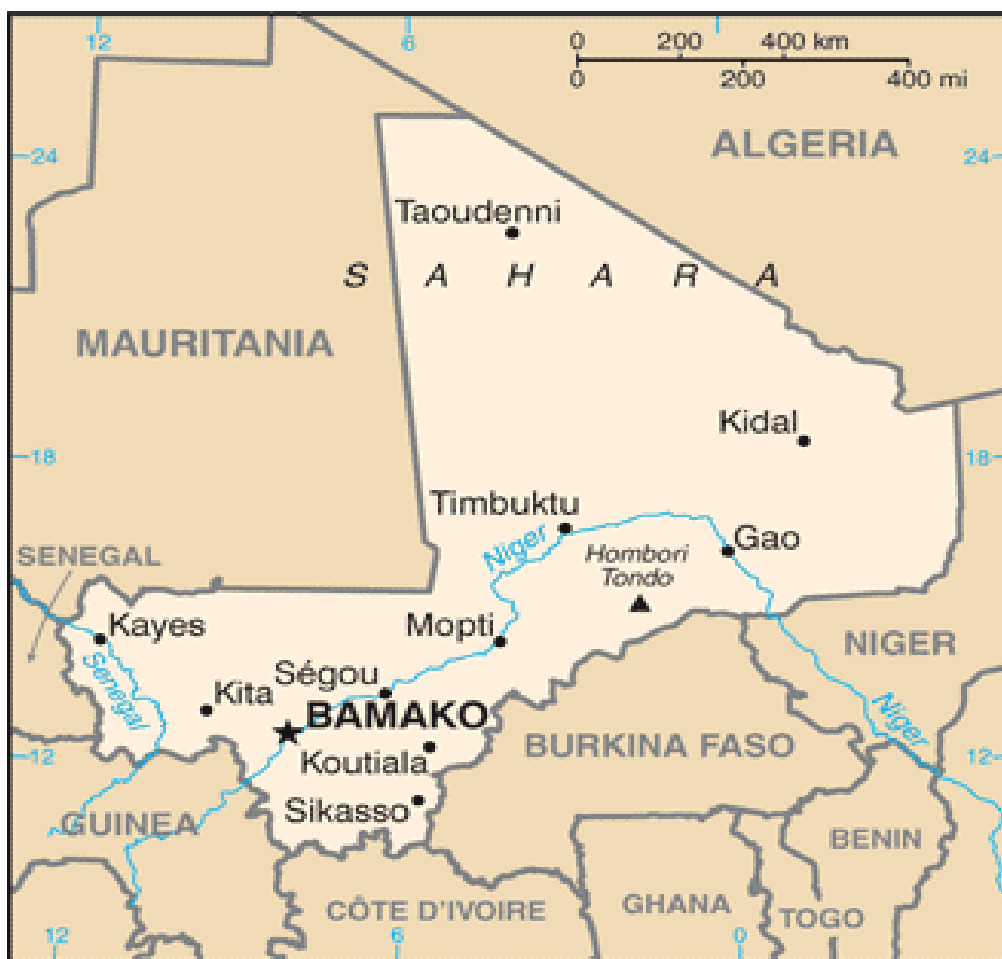
Mapa 2: Malí

Fuente: The World Factbook, Mali. En: https://www.cia.gov/library/publications/the-world-factbook/geos/ml.html .