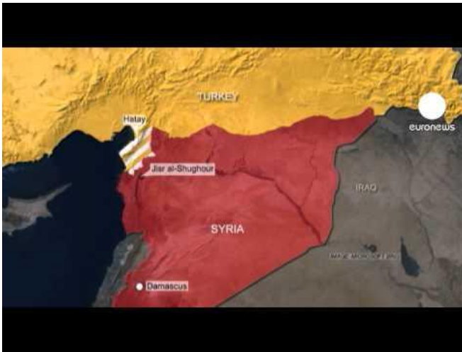
Mapa 2 Turquía con la Provincia de Antalya señalada. A 1,193.5 Km de Damasco. [en línea] Dirección url de la imagen: https://goo.gl/o9CrcC Dirección url del artículo donde se encuentra alojado: https://goo.gl/wwh4Vn Consultado: 28 de abril del 2016

un diálogo nacional, de determinar su mecanismo y su programa. Sin embargo la represión siguió 40 .