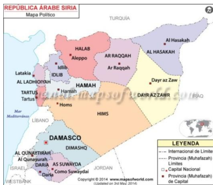
Mapa 1 Mapas del mundo. Siria mapa. [En línea] Dirección url: http://goo.gl/vnTACI [consulta: 12 de abril de 2016]

Nombre oficial: AL Yumhiriya al Arabiya as Suriya (República Árabe Siria) Límites: al norte con Turquía, al este con Iraq, al sur con Jordania y al oeste con Líbano, Estado de Israel y el mar Mediterráneo.