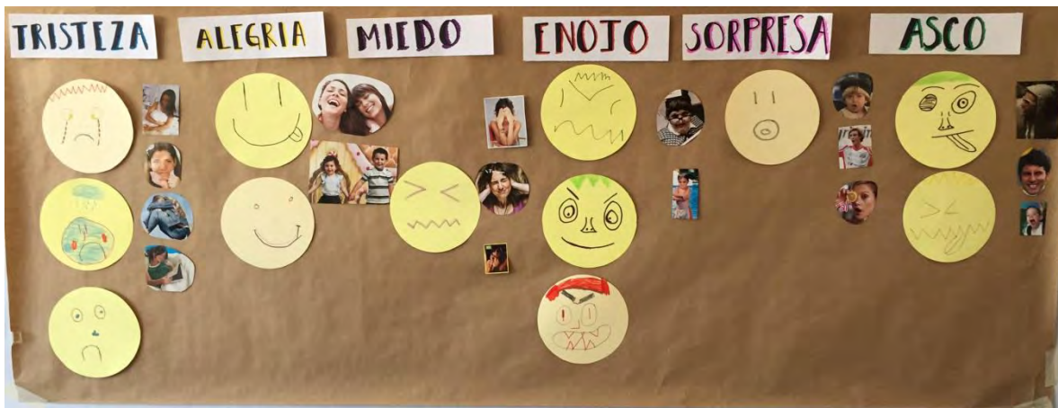
Figura 3 Panel de las emociones del grupo experimental 2

Todo esto, trayendo como resultado un aumento en su capacidad para responder de manera empática, puesto que cuando alguien compartía y/o dejaba ver alguna experiencia desagradable por la que hubiera pasado, los demás respondían en función de ella; haciéndole ver al otro que lo comprendían y que no era el único que había experimentado esta situación y/o emoción. Como ejemplo de ello, se tiene la acción que una de las niñas realizó cuando uno de sus compañeros estaba llorando, ya que ésta se acercó para regalarle un chocolate; de tal manera que esto pudiera hacerlo sentir mejor.