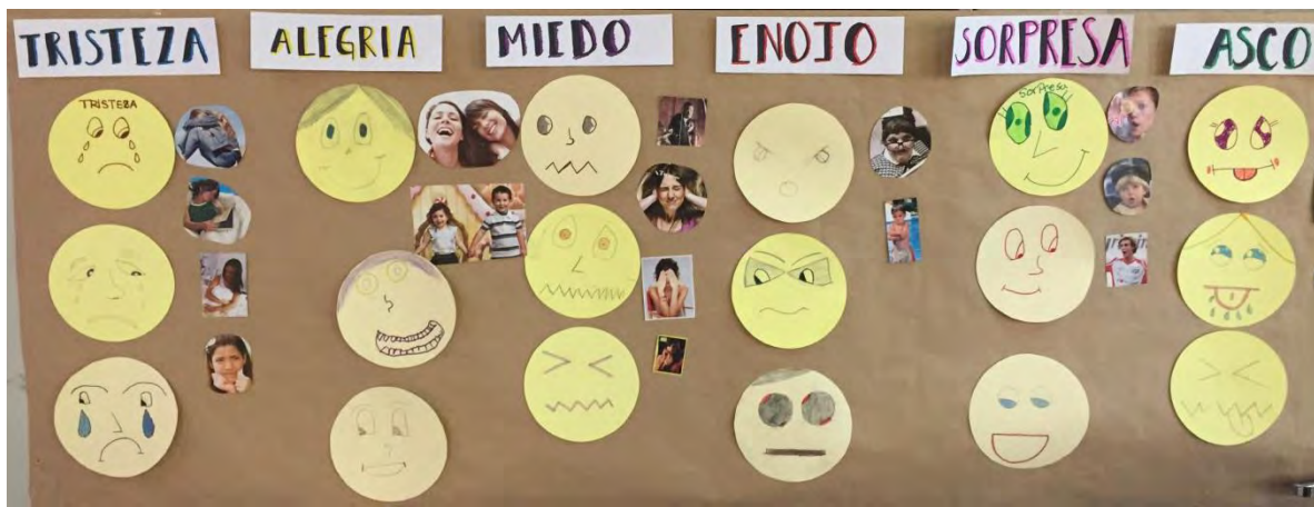
Figura 2 Panel de las emociones del grupo experimental 1

Todo esto, no solo le permitió al grupo que cada uno de ellos pudiera mostrarse empáticos con sus compañeros y con los demás, al momento de comprender y verbalizar que todos ellos experimentaban situaciones y emociones similares; sino que también se observó una mayor apertura por parte de cada uno para expresar cómo los hacía sentir cierto comportamiento inadecuado, ejecutado por alguno de sus compañeros; es decir, a partir de ello, les resultó más fácil expresar inconformidades. No obstante, cabe señalar, que dicha expresión en ocasiones se daba de forma asertiva, pero otras veces no.