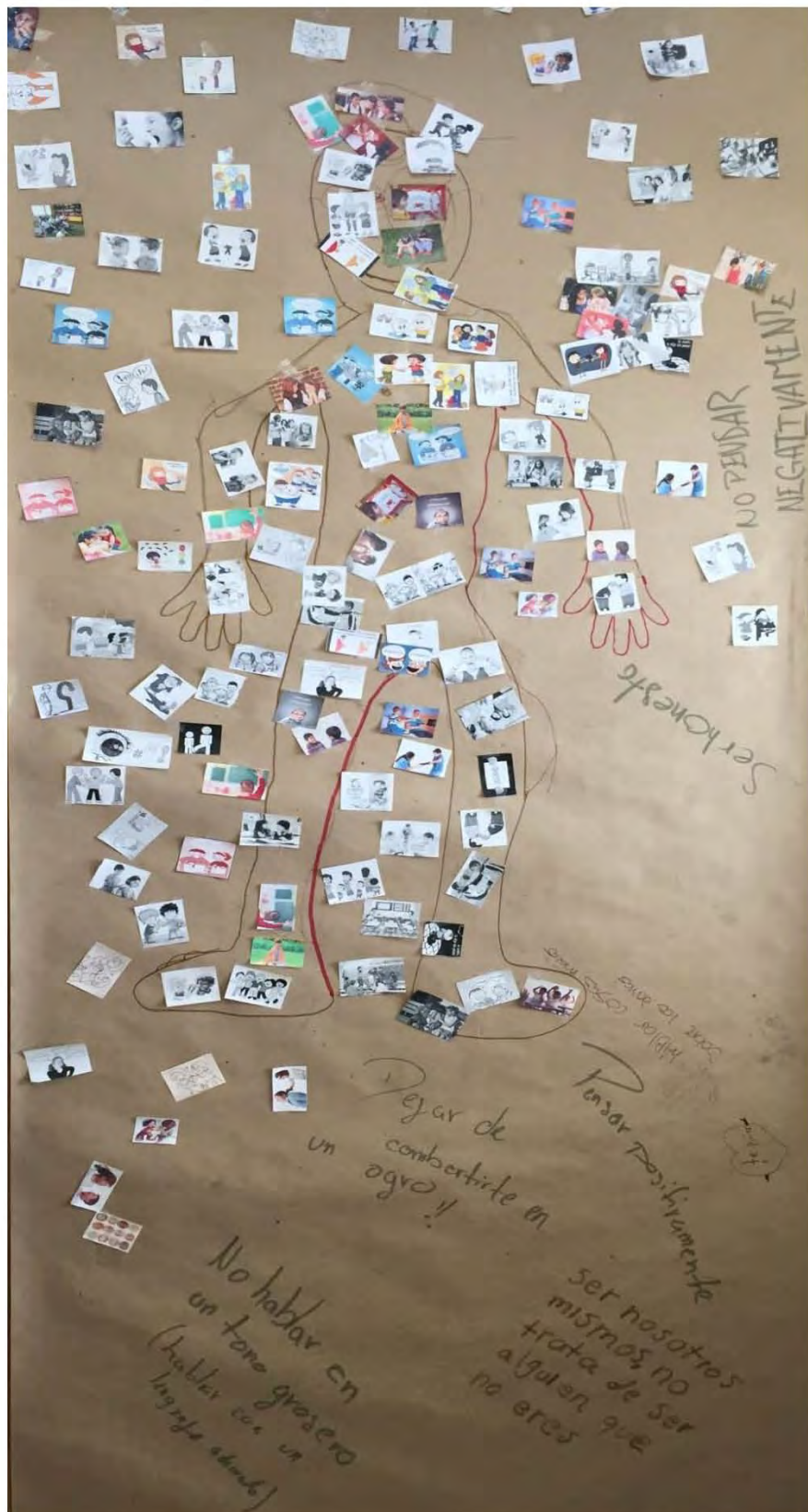
Figura 5 Silueta del grupo experimental 2