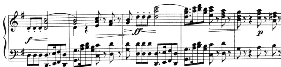
Figura 6 (cc. 52 – 56)

La orquesta vuelve a enunciar un pequeño puente (v7/V) con una cadencia compuesta al relativo ( mi menor ) para dar comienzo al tema C (Figura 6).