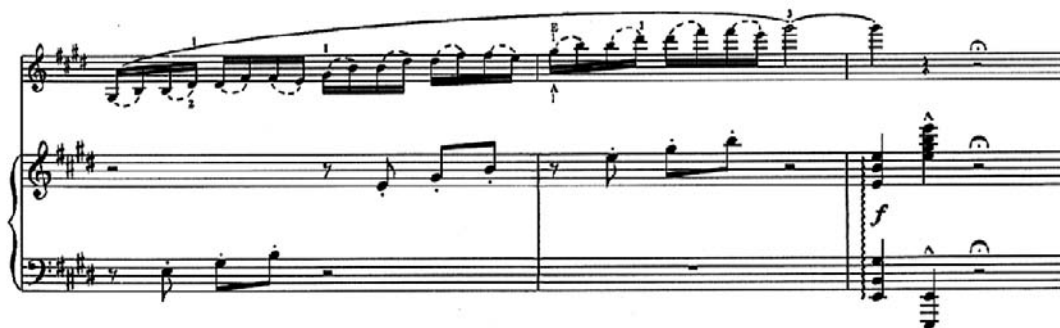
Figura 6 (cc. 62-64)

La obra termina con una Coda de tres compases, con material rítmico y melódico del compás 15, escrito para la parte de violín y el piano acompaña con el arpeggio del acorde de tónica. (Figura 6)