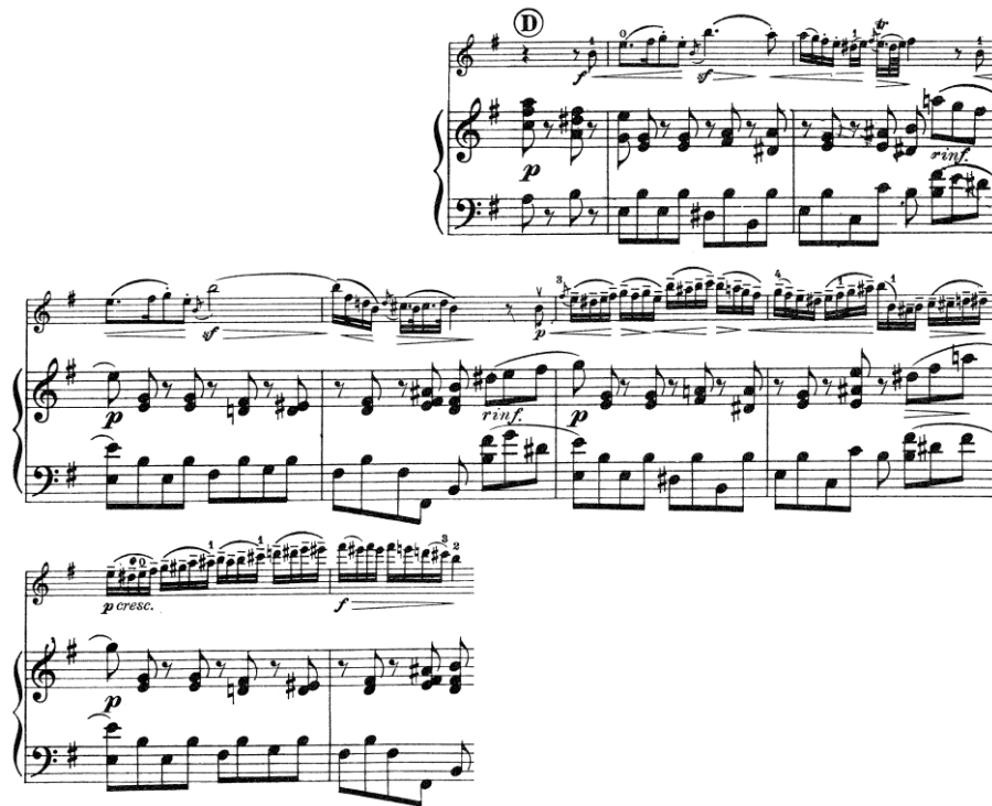
Figura 7 (cc. 56 – 64)

El violín hace una nueva escala cromática ascendente que da paso a la A” (Figura 8).