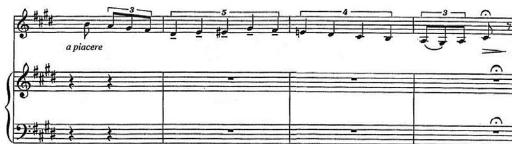
Figura 5 (cc. 34-37)

El violín hace una cadencia (cc. 34-37) donde la melodía se mueve por cromatismo (compás 35) y la escritura rítmica refleja cambios en la agógica (Figura 5).