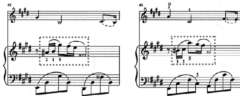
Figura 5 (cc. 42 y 46)

La parte A' se desarrolla de los compases 41 al 64. Esta parte contiene dos variantes significativas. Los compases 42 y 46 en donde, la voz aguda del piano utiliza el motivo rítmico y melódico del compás 28 (Figura 5); y del compás 54 hasta el final. Los cambios son armónicos y vuelve a utilizar el material del compás 28, anteriormente mencionado.