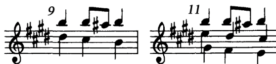
Figura 2 (cc. 9 y 11)

La parte B se encuentra en la tonalidad de la dominante ( Si mayor). En el inicio de la segunda semifrase, el compositor agrega más voces a los acordes cambiando también su función: para el compás 9 ( I_6-V_64-I ) y para el compás 11 ( IV_6-I_64-ii_65 ) (Figura 2).