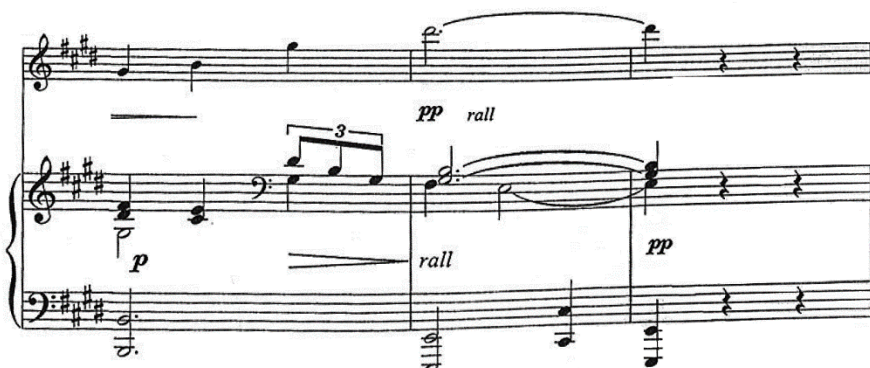
Figura 6 (cc. 41-43)

La Coda (cc. 37-43), se crea con material temático de la primera frase de la parte A. En los últimos tres compases de la pieza, el violín tiene un acorde de tónica ( Mi mayor), para terminar con un acorde de color del mismo en ambos instrumentos (Figura 6). 10