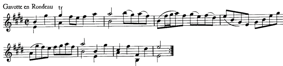
Figura 1 (cc. 1-8)

Esta gavotta mantiene el ritmo binario, y está escrita en compás alla breve . La forma general de esta danza consta de un estribillo que aparece cinco veces, el cual se va alternando con cuatro coplas. En los compases 1 a 8 encontramos el primer estribillo, en Mi mayor (Figura 1).