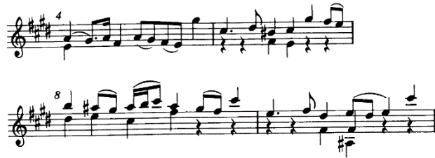
Figura 2 (cc. 4-5 y 8-9)

La sección B inicia con un dibujo melódico de tres notas ascendentes por grado conjunto. Así como en la primera frase del periodo anterior, el compositor escribe la imitación a la cuarta inferior, en la voz grave. En el compás 14 se produce una modulación a la tonalidad de Fa # menor ( ii ). En la siguiente frase de esta parte, la tonalidad regresa a Mi mayor y se generan inflexiones al vi y v (cc. 17-18 y 19, respectivamente), hasta modular a sol # menor.