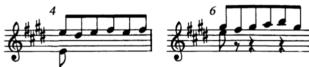
Figura 1 (cc. 4 y 6)

La estructura de la primera sección es de dos frases (cc. 1-4 y 5-8) divisibles en cuatro semifrases de dos compases cada una. Esta división es importante destacarla, ya que el compositor reutiliza constantemente material rítmico y melódico de los motivos del principio y final de algunas semifrases. Por ejemplo, el final de una frase puede contener material similar al de la semifrase que le precede (cc 4 y 6) (Figura 1).