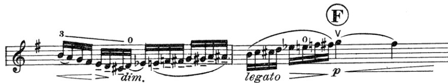
Figura 8 (cc. 74 – 75)

El violín hace una nueva escala cromática ascendente que da paso a la A” (Figura 8).