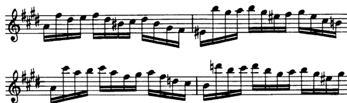
Figura 4 (cc. 86-89)

La parte c , también en do # menor, está creada con material temático del compás 3. A lo largo de ocho compases se mantiene un pedal con la nota sol # . A partir del compás 53, la tonalidad cambia a Si mayor (v) y desde el compás 57 se mueve a la tonalidad de La mayor (iv). La re-exposición es una versión resumida del Tema , donde el material temático y rítmico es el mismo que en los compases 9-12, pero con la variante en La mayor. En la parte a' , el material es presentado de la misma forma, pero en La mayor. La b' , inicia en la misma tonalidad que la parte a' , y el material temático es el mismo que en los compases 29-35. Del compás 86 al 89 comienza otra variación, donde el compositor usa saltos melódicos en las primeras dos semicorcheas (Figura 4) y desde el compás 88, la tonalidad es Fa # menor (ii).