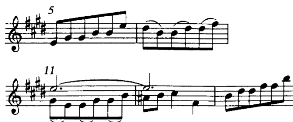
Figura 1 (cc. 5-6 y 11-13)

La parte A (cc. 1-16) comienza con el mismo intervalo de tercera menor superior de la triada del acorde de I , mismos intervalos con los que inicia el Menuet I . El compositor hace uso constante de la cadencia auténtica ( v-I ), sobre todo, para establecer al final del periodo la tonalidad de la dominante. Los saltos melódicos sobre las notas de una triada, en los compases 5-6 y 11-13 (Figura 1), aparecen constantemente como desarrollo motivico en esta sección.