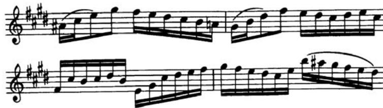
Figura 1 (cc. 9-12)

A' (cc. 17-32) comienza en la tonalidad de Mi mayor y en el compás 18, comienza una progresión (I6-V2/IV-vii o -V7-I) para llegar a la tonalidad de fa # menor (ii) en el compás 20 (Figura 2). En el compás 24 se regresa a La mayor y en el compás 25 a la tonalidad original, para dar paso al último episodio del movimiento (25-28) y a la conclusión de esta danza.