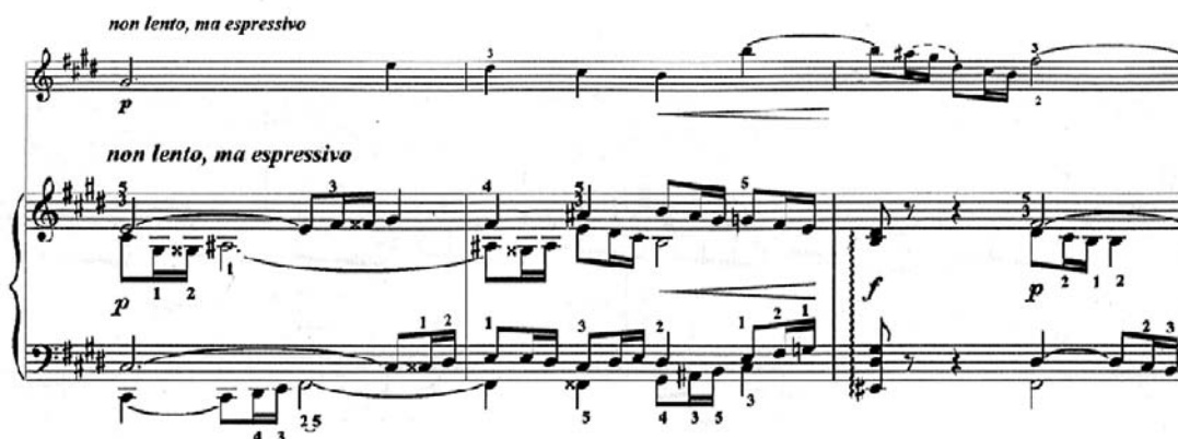
Figura 4 (cc. 33-35)

La sección B comprende de los compases 33 al 40. Aquí, combina material rítmico del puente y lo desarrolla cromáticamente a manera de stretto en el piano (Figura 4). Esta parte continúa en la región de la dominante y desde el compás 37 (segunda mitad de esta parte), prepara el ritornello (A').