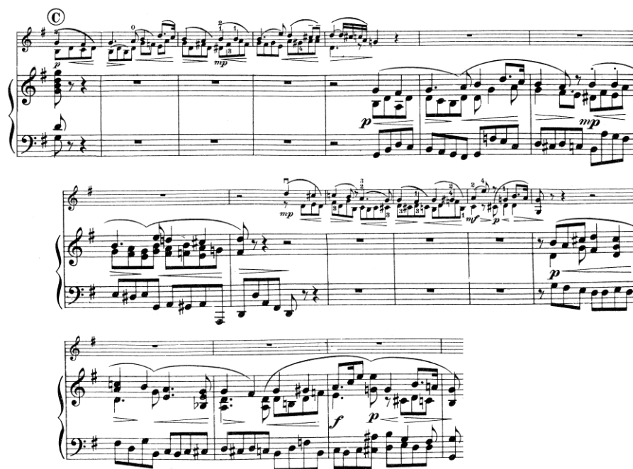
Figura 5 (cc. 36 – 52)

La orquesta vuelve a enunciar un pequeño puente (v7/V) con una cadencia compuesta al relativo ( mi menor ) para dar comienzo al tema C (Figura 6).