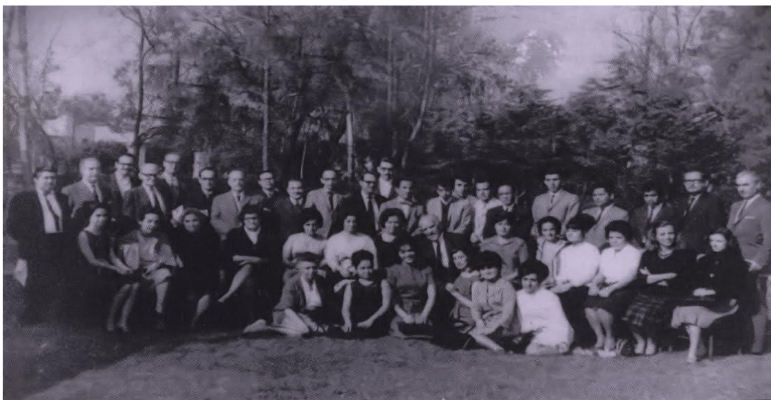
Fundación de la editorial siglo XXI. En la casa de La Morena 430.