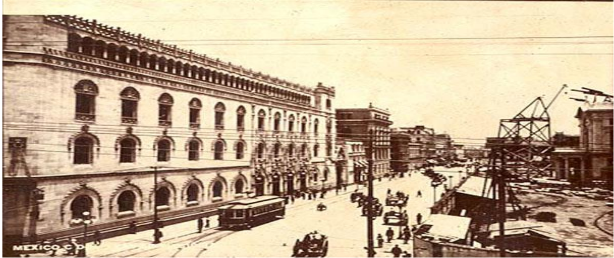
Tranvía de 36 pasajeros circula por un costado del edificio del Correo Central inaugurado por Porfirio Díaz 1907. La acera opuesta del Palacio de Bellas Artes en proceso de construcción, estuvo suspendida durante la Revolución e inaugurado hasta el año de 1934. La imagen quizá corresponda al año de 1910.