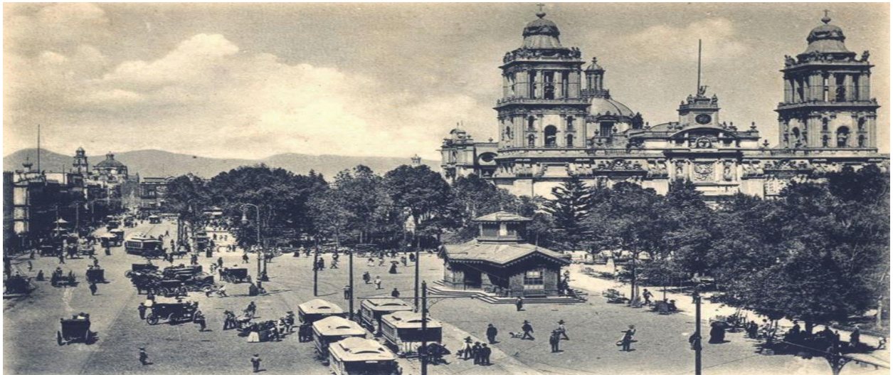
La principal estación de transporte urbano a finales del siglo XIX. En pleno Zócalo, se aprecian los tranvías de mulitas y los carruajes de alquiler, frente al denominado portal Mercaderes, no visible. Atrás la Catedral y la Plazuela del Empedradillo, profusamente arbolada con fresnos.

Todos los vecinos del barrio nos conocíamos bien y tratábamos de ayudarnos. Si alguna vez salíamos de compras o de visitas, mi madre alquilaba una carretela de bandera azul, que costaba un peso la hora y desfilaba, despaciosa, por las calles olorosas a pan y a caballo. Las fiestas señalaban el paso imperceptible de las estaciones. (Benítez, F. 1975, p.7).