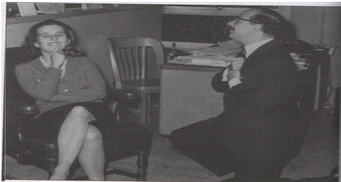
Elena Poniatowska con Fernando Benítez en las oficinas de Novedades (1956-1957).