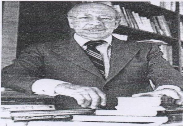
Don Fernando Benítez, en la intimidad de su biblioteca.