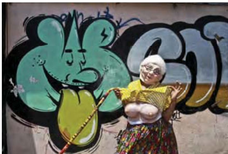
S/t de la serie El lenguaje de las paredes. Comparsa Nochebuena. Autor: RMG 2013