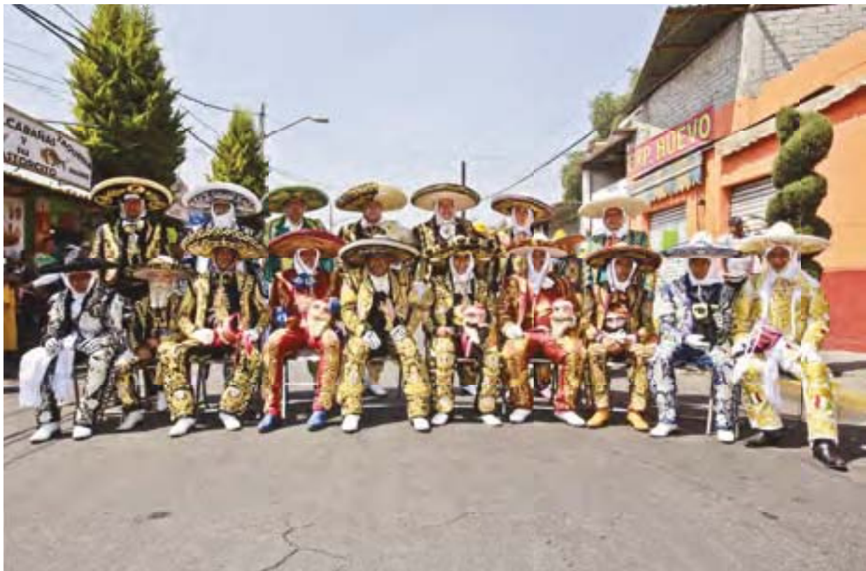
Hombres integrantes comparsa Calaveras Foto: RMG 2014