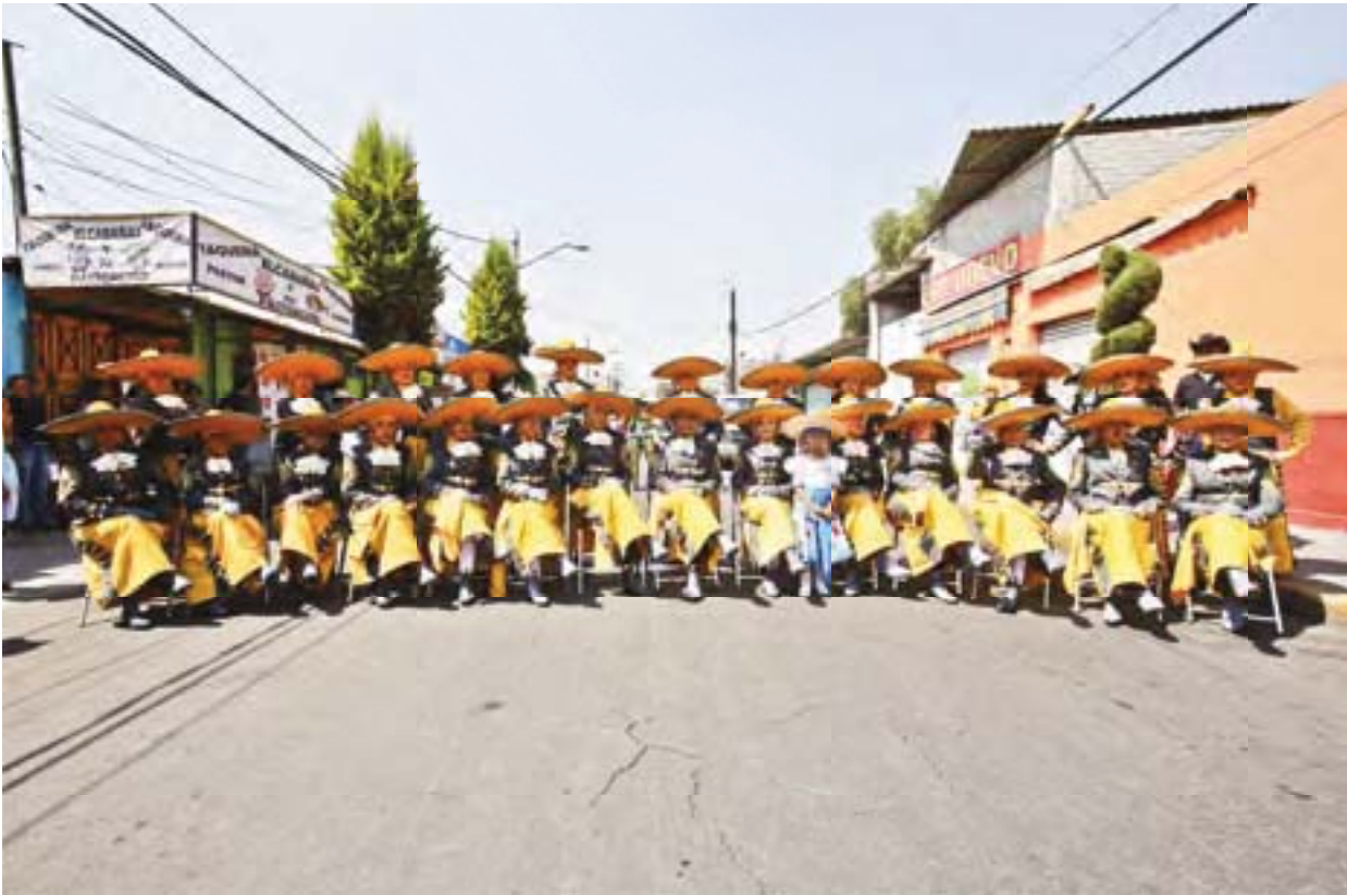
Mujeres integrantes comparsa Calaveras