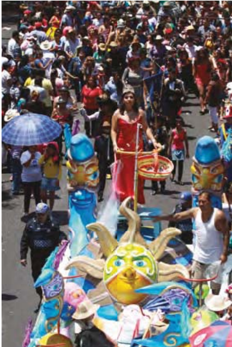
Carro Alegórico comparsa Nochebuena Foto: RMG 2014