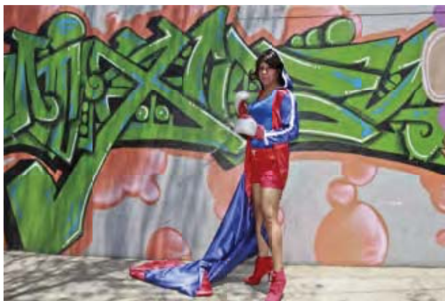
S/t de la serie El lenguaje de las paredes. Comparsa Nochebuena. Autor: RMG 2013