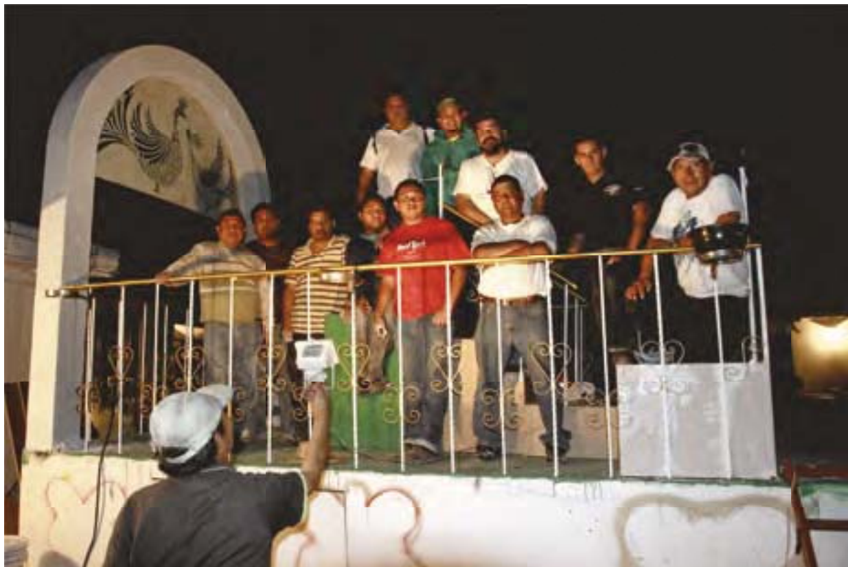
Participantes de la comparsa Calaveras construyendo el carro alegórico.

¿Cómo se mantienen vivas las tradiciones en la comparsa?