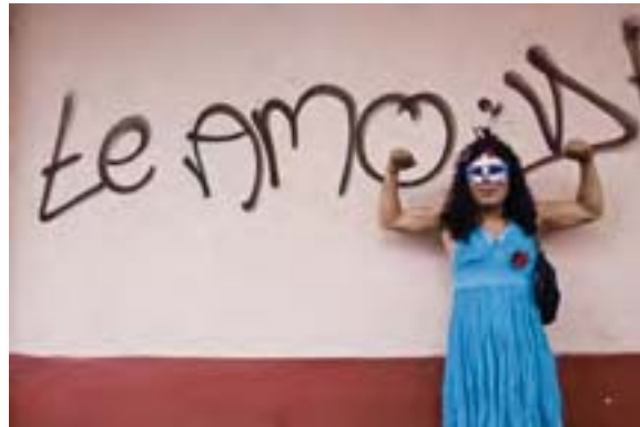
Díptico 2, de la serie Realidad y ficción. Autor: RMG, año 2013