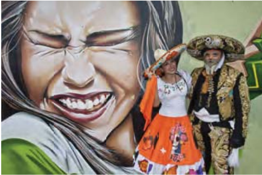
S/t de la serie El lenguaje de las paredes. Comparsa Calaveras. Autor: RMG 2013