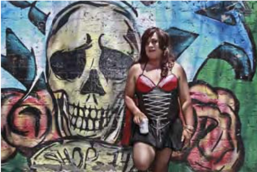
S/t de la serie El lenguaje de las paredes. Comparsa Nochebuena. Autor: RMG 2013

Esta serie lleva el título El lenguaje de las paredes. Es así como logro equilibrar la producción fotográfica en ambas comparsas con los elementos que encuentro en las calles donde ambas comparsas desfilan durante su participación dentro de las festividades del carnaval o baile de mascararas. En este semestre la producción fotográfica de ambas comparsas suma alrededor de 7000 imágenes.