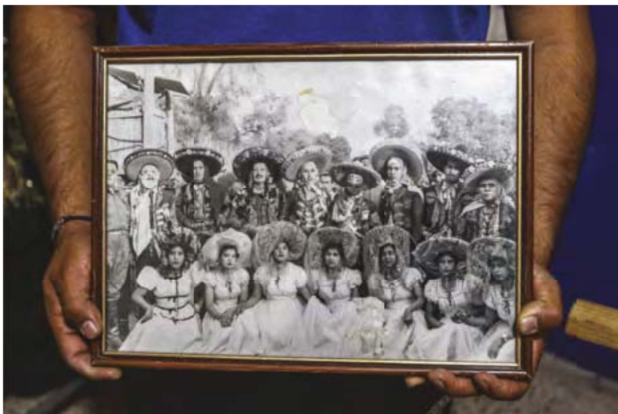
Fotografía antigua 1930 aprxiadamente, autor desconocido Foto: RMG 2013

Los gastos de la reina corren a cargo de su familia el vestido tiene un costo aproximado de 120 mil pesos dependiendo de la tela y la pedrería de fantasía que se utilizó, se compra bisutería para acompañar el diseño del atuendo, zapatos con adornos especiales, la corona y el cetro llevan un trabajo especial, en total suman unos 200 mil pesos para vestir a la reina, la fabricación del carro alegórico, la comida y bebida para toda la comparsa e invitados es un gasto aparte otros 70 mil pesos. Se busca un padrino y el día de la ceremonia de coronación él será quien corone a la nueva reina.