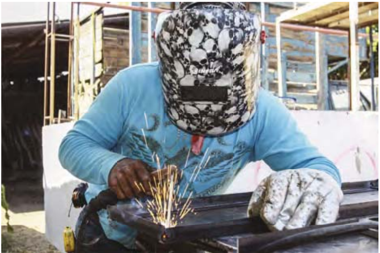
Miembro de la comparsa Calaveras construyendo el carro alegórico.

¿Cuáles son los principales problemas a los que se enfrenta una nueva comparsa? AGV al tratarse de una comparsa nueva no tenemos apoyos económicos de ningún tipo, la delegación apoya a las comparsas con mayor antigüedad, a nosotros no. Diseñamos el carro y lo construimos entre todos para economizar. Varios de los compañeros son carpinteros, herreros, pintores, cooperan con su tiempo y sus conocimientos, en algunos casos con herramientas, los materiales los compramos entre toda la comparsa. Este año tardamos dos semanas en la elaboración del carro alegórico. Es pesado y laborioso pero lo hacemos con gusto, es parte de la convivencia nos une como grupo.