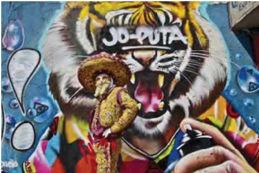
S/t de la serie El lenguaje de las paredes. Comparsa Calaveras. Autor: RMG 2013