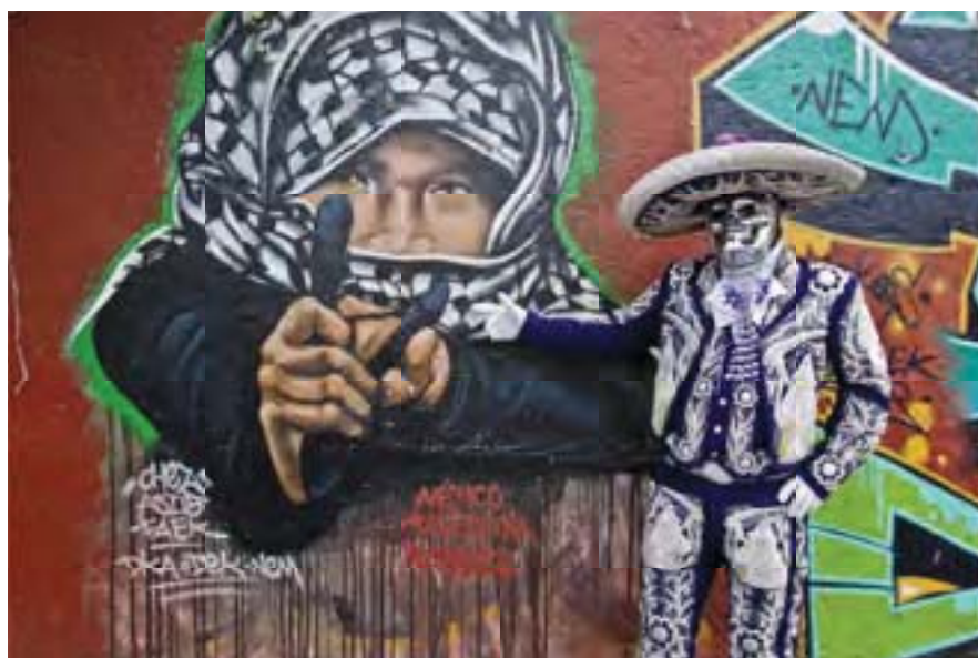
S/t de la serie: El lenguaje de las paredes. Comparsa Calaveras. Autor: RMG 2013

Para el segundo semestre en la materia Investigación Producción II, continuo con el desarrollo del tema Realidad y ficción en la comparsa Nochebuena del Barrio de San Miguel en el centro de Iztapalapa; al mismo tiempo produzco una nueva propuesta visual para la comparsa Calaveras del pueblo de Santa Cruz Meyehualco de la misma demarcación, que no la había involucrado en la primera etapa de producción, con ellos trabajo con los grafitis que encuentro al recorrer las calles de Iztapalapa, trato de involucrarlos con estas pinturas urbanas, con estos lienzos de concreto que forman parte del paisaje urbano, cuando detecto algún mural en la calle que reúne la calidad necesaria y es de mi interés llevo a los personajes de la comparsa y los fotografió de diferentes formas frente a estos grafitis.