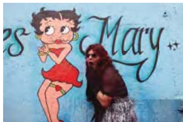
Díptico 3, de la serie Realidad y ficción.