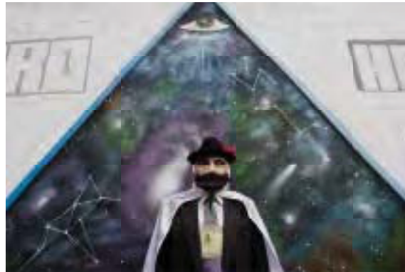
Díptico 1, de la serie Realidad y ficción. Autor: RMG, año 2013