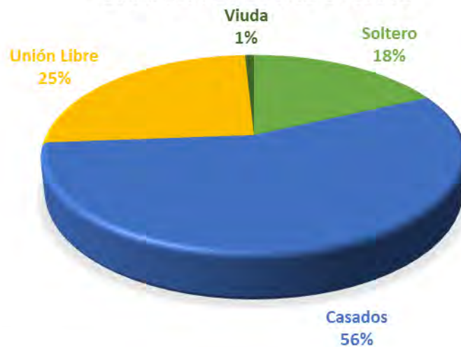
GRAFICA 3. ESTADO CIVIL

En cuanto al estado civil de los padres, se encontró solteros 18% (22 padres), casados el 56% (68 padres), en unión libre 25% (31 padres) y finalmente viuda 1% (1 padre). Gráfica 3