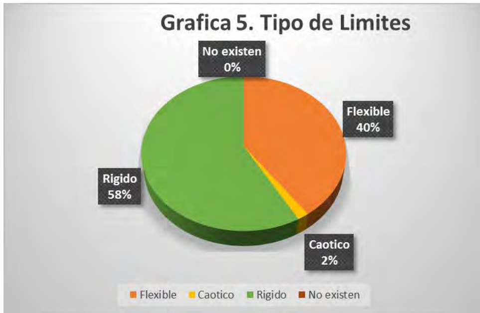
Test Manejo de Limites en los niños

Finalmente el resultado en relación al tipo de límites que se observa en estas familias en relación a la que se establece sobre los niños de 3 a 11 años, fueron: de tipo flexible el 40% (49 padres), el de tipo rígido el 58% (71 padres), en menor número el de tipo caótico 2% (2 padres) y sin registro de que los padres no lleven ningún límite. Grafica 5